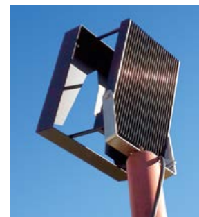
Primer reflektorja z nameščeno masko, s katero se zmanjša sipanje svetlobe mimo cerkve.

10 % svetlobnega toka mimo fasade. Določena je tudi največja intenziteta osvetljenosti za različne objekte, tudi reklamne panoje. Stavbe so za nekatere živalske skupine pomemben del življenjskega okolja, mnoge vrste netopirjev imajo v podstrešjih cerkva porodniške kolonije, tam gnezdijo tudi sove in hudourniki. Uredba določa, da fasade, kjer ležijo preletne odprtine ogroženih vrst živali, ne smejo biti osvetljene. A praksa je še prepegosto drugačna.