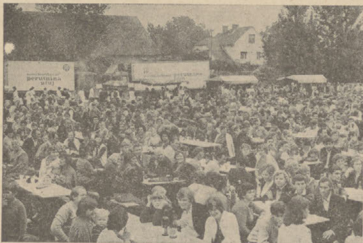
Kljub ničkam obetavnemu vremenu se je zbralo več tisoč obiskovalcev dneva perutninarjev