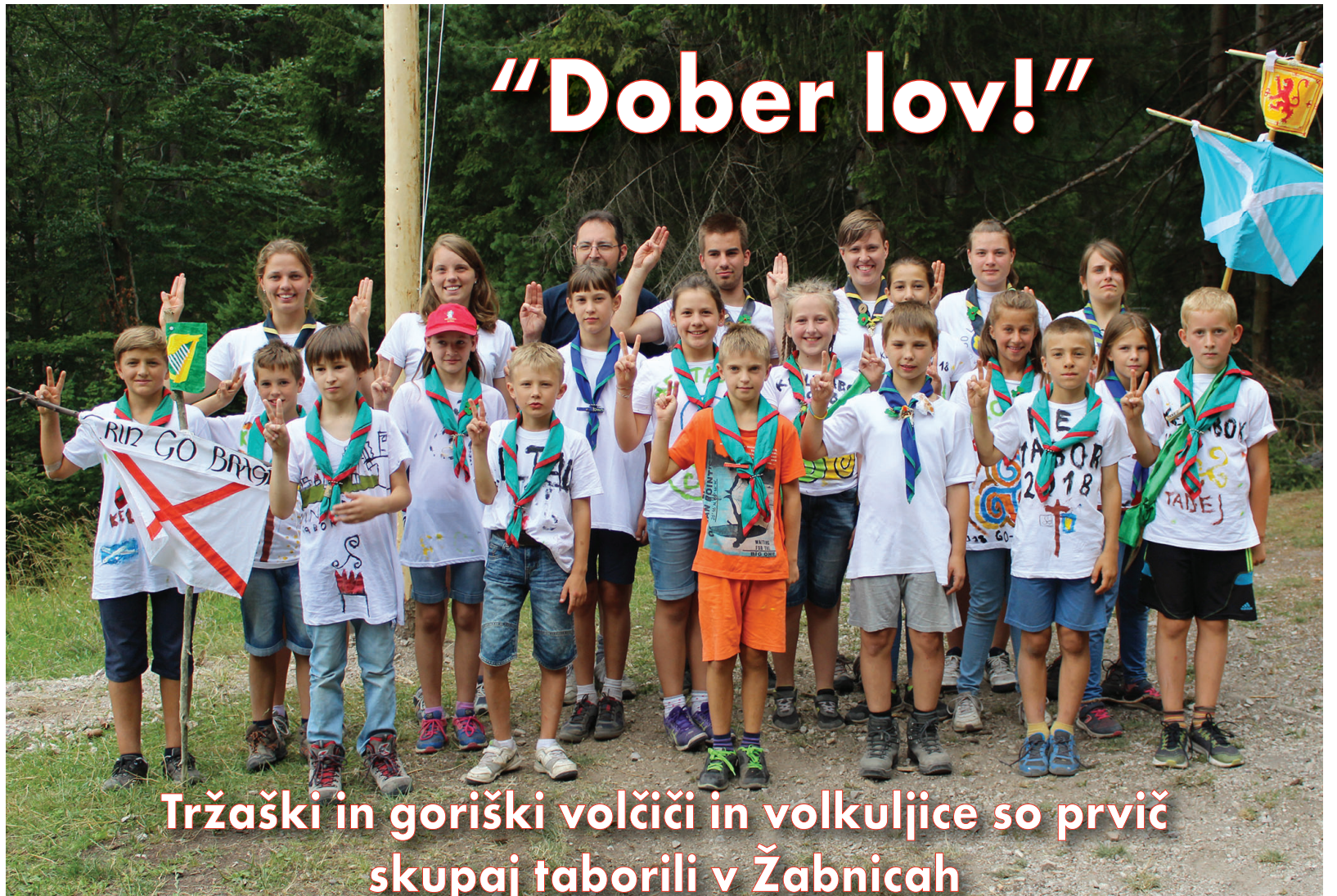
Tržaški in goriški volčiči in volkuljice so prvič skupaj taborili v Žabnicah

Papež Frančišek je jassen, ko govori o spolnih zlorabah v Cerkvi, potrebno jih je takoj prijaviti, sodno preučiti, krivce kaznovati, predvsem pa teh stvari Cerkev in njen vrh ne smeta skrivati in ne pometati pod preprogo, kot se je prevečkrat počenjal, ampak jasno in javno obsoditi. Preveč gorja je že bilo zaradi prikrivanja teh zločinov, Cerkev je potrebna očiščenja, jasno pravi Frančišek.