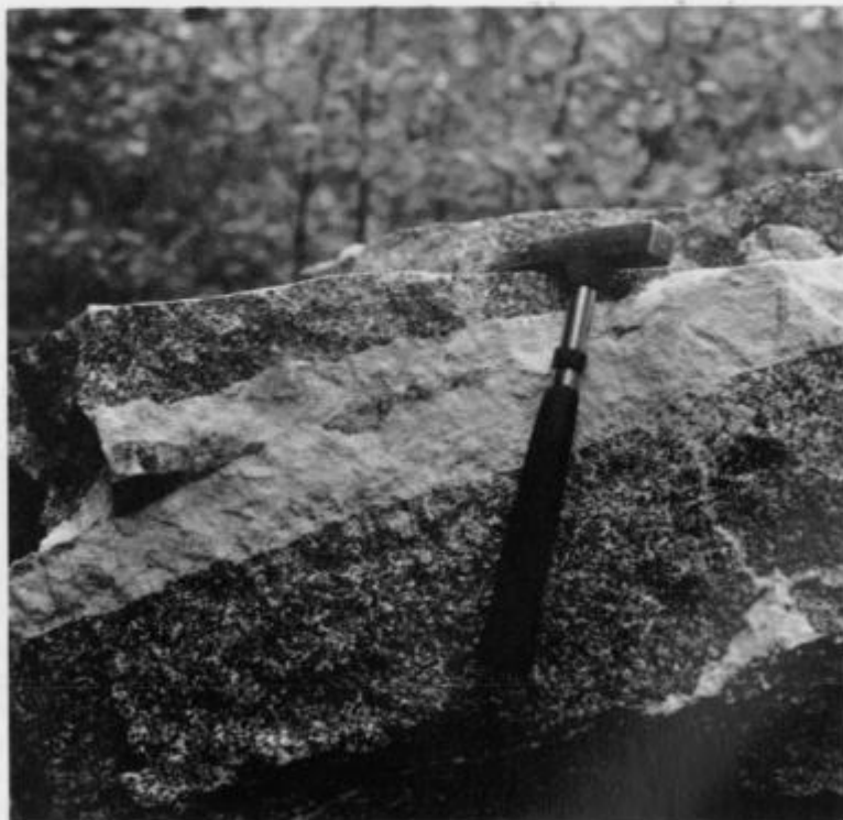
Sl. 2. Aplitna žila v čizlakitu

Pegmatit – gre za debelozrnati različek, ki lokalno prehaja v rdečkasti drobnozrnati aplit – večinoma sestavljajo plagioklazi, ki v povprečju ustrezajo oligoklazu z 11% anortita, alkalni glinenci – ti predstavljajo ortoklaz in vsebujejo v povprečju 25% albitne komponente – ter kremen. Mineralno paragenozo dopolnjujejo v majhnih količinah še biotit, klorit, granat in neprozorni minerali, večinoma pirit (Faninger, 1970, 1973).