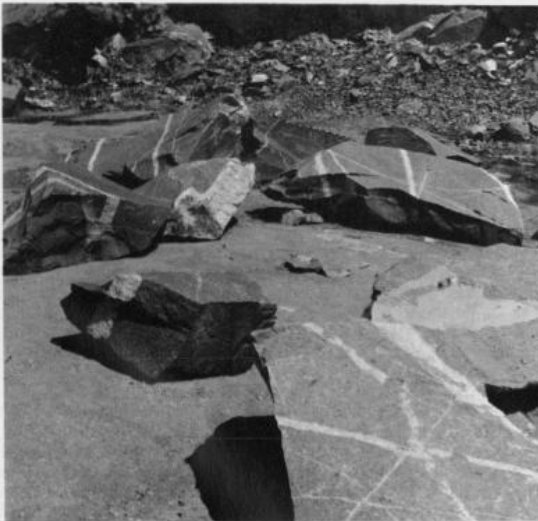
Sl. 1. Pegmatitne in aplitne žile v tonalitu Fig. 1. Pegmatite and aplitite veins in tonalite

Tako pohorski tonalit kot čizlakit prepletajo številne aplitne in pegmatitne žile (slika 1 in 2). Najverjetneje so nastale zaradi migracije ostankov magme, katere večji del je že izkristaliziral. V bistvu so to kisli diferenciatni tonalitne magme. Aplitne žile se po strukturi ločijo od pegmatitnih žil. Zanje je značilna drobnozrnata struktura, medtem ko pegmatitne žile odlikuje debelozrnata struktura. Pri terenskih raziskavah smo ugotovili, da gre za več generacij omenjenih žil, katerih starostnega zaporedja nam zazdaj še ni uspelo natančno določiti. Kjer se aplitne in pegmatitne žile sečejo, vidimo, da je aplit običajno starejši od pegmatita (slika 2). Vendar moramo poudariti, da smo našli tudi tanke aplitne žile, ki sečejo pegmatitne. To dokazuje, da so apliti nastajali tudi potem, ko so bile nekatere pegmatitne žile že formirane. Podobno kot aplitne tudi pegmatitne žile ne pripadajo le eni generaciji. Pogosto namreč opazimo,