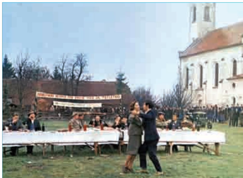
Prizor iz filma Rdeče klasje