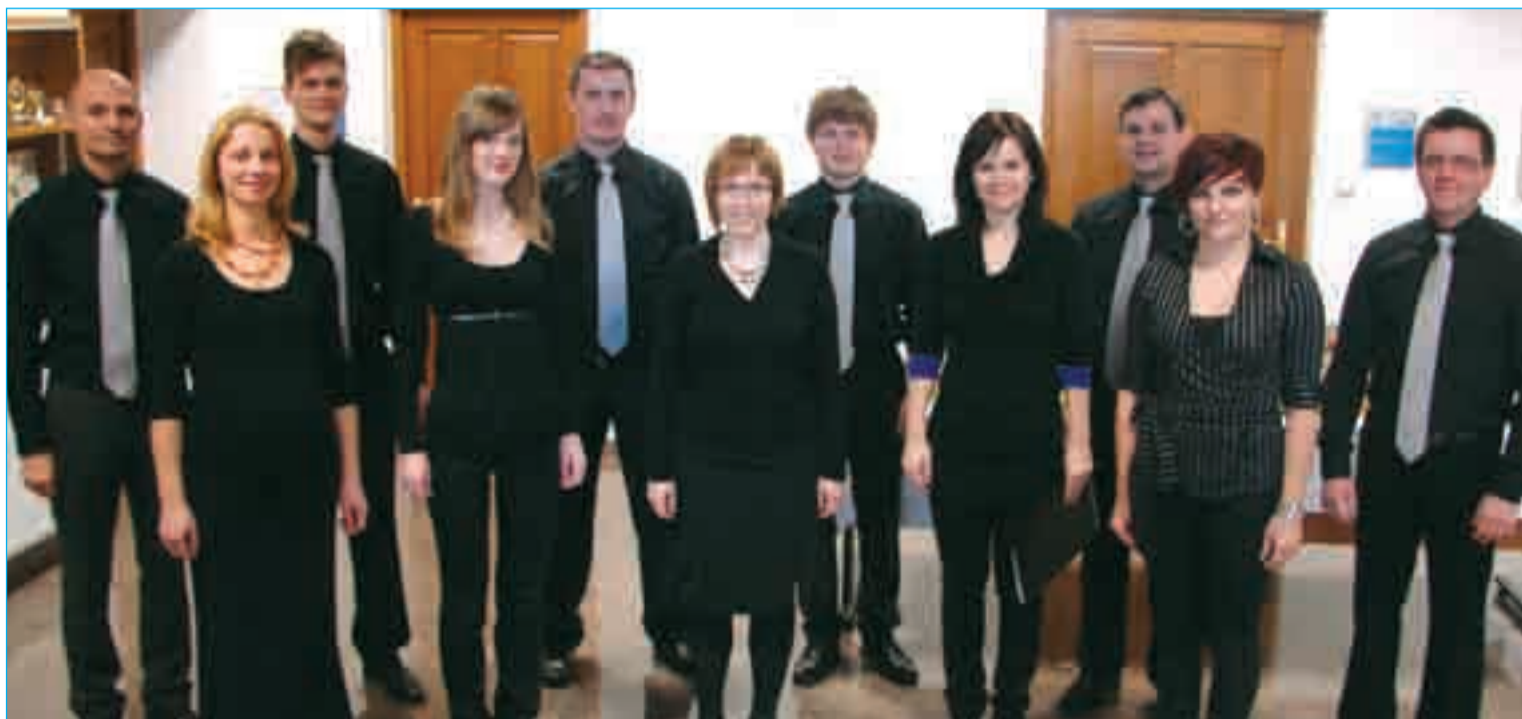
Pevci Kulturno-umetniškega društva KulTura

Med načrti, ki so si jih na ustanovnem občnem zboru zadali pevci Kulturno umetniškega društva KulTura, so sodelovanje na območni in tematski reviji pevskega zbora, izvedba balkanskega cikla s simfoničnim orkestrom, pri čemer načrtujejo nastopa v Markovcih in na mariborskem Lentu, prav tako pa bodo nastopili na prireditvah po domači in sosednjih občinah ter tudi širše.