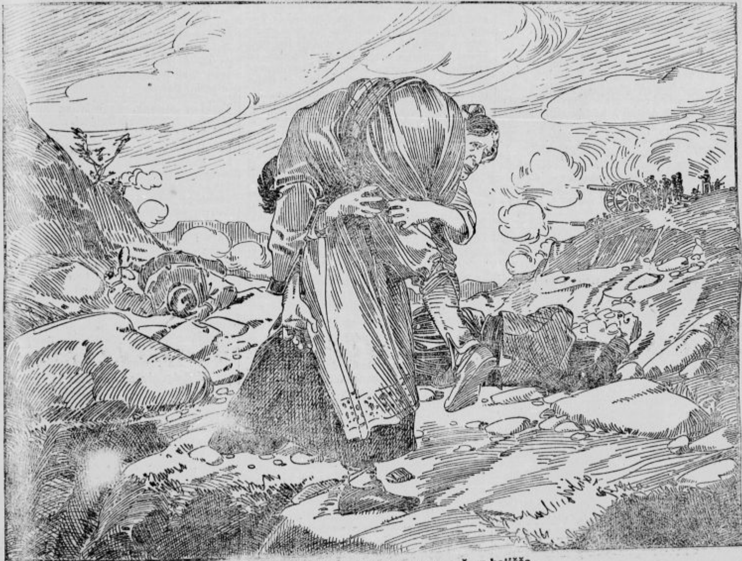
Črnogorka nese svojega ranjenega moža z bojišča.

Srbska armada pod generalom Živkovičem, ki je osvojila Novi Pazar, hitela je dalje proti jugu in zavzela staro srbsko mesto Prizren. To mesto je važno in znano