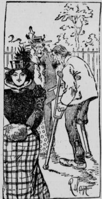
Za pomoč pripravljen.

Zemljevid bojišča , neobhodno potreben za vsakega, ki zasleduje velike vojne dogodke na Balkanu, se dobi v Katoliški Bukvarni v Ljubljani. — Cena K 120 za izvod, po pošti 10 vin. več.