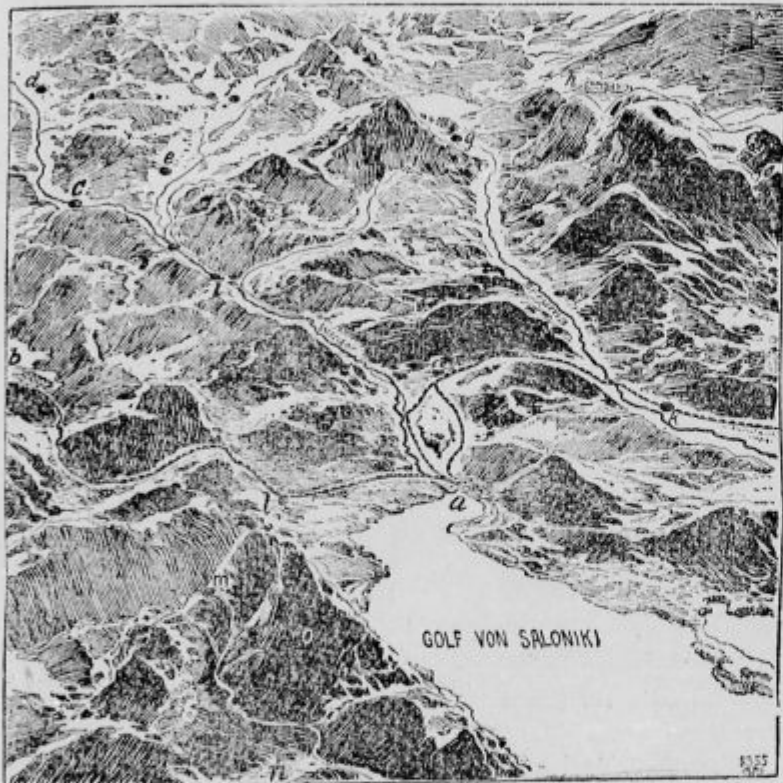
BOJIŠČE OKOLI SOLUNA.

Lozengrad je imel najmodernejšo utrdbe. Tri največje so zidali nemški inženirji, in sicer tako, kakor zahteva najnovejša vojaška veda. Dozdevale so se sploh nepremagljive. Trdnjave so bile oborožene s kakimi 100 topovi. Poleg tega je bilo še dve vrsti manjših utrdb: forti, okopi, kule in nasipi, vse oboroženo s poljskimi topovi. Vrh vsega pa ima mesto tudi po naravi tako lego, da se ga da lahko braniti.