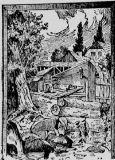
Kje je žagar?