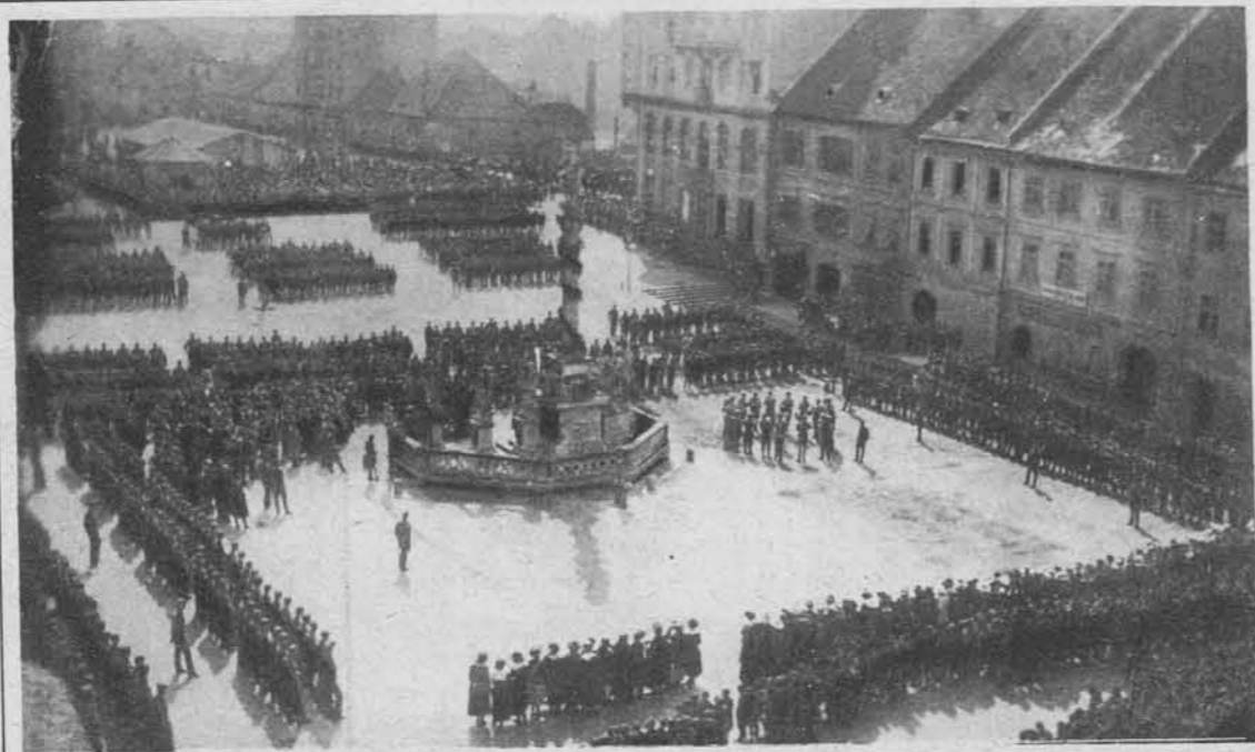
Proslava prvega maja v Mariboru l. 1919.