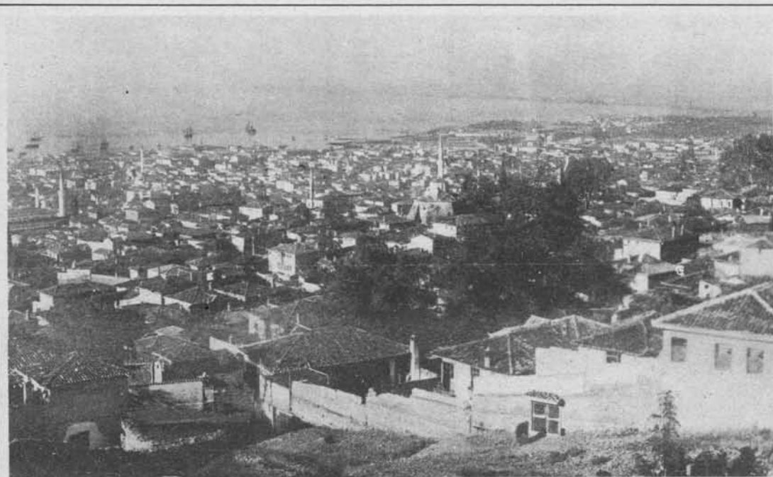
Iz Grške, dežele večnih revolucij.

Lani smo že poročali o Amundsenovi ekspediciji na severni tečaj, ki pa kljub svoji zanimivosti ni dosegla svojega cilja. Pred kratkim se je podal Amundsen ponovno na to pot, in sicer preko Rusije, skoro istočasno pa tudi Amerikanec Wilkins, ta pa z ameriške strani. Naša slika nam kaže ekspedicijsko ladjo »Viktorjo« na poti na Aljasko, odkoder poleti Wilkins potem proti tečaju.