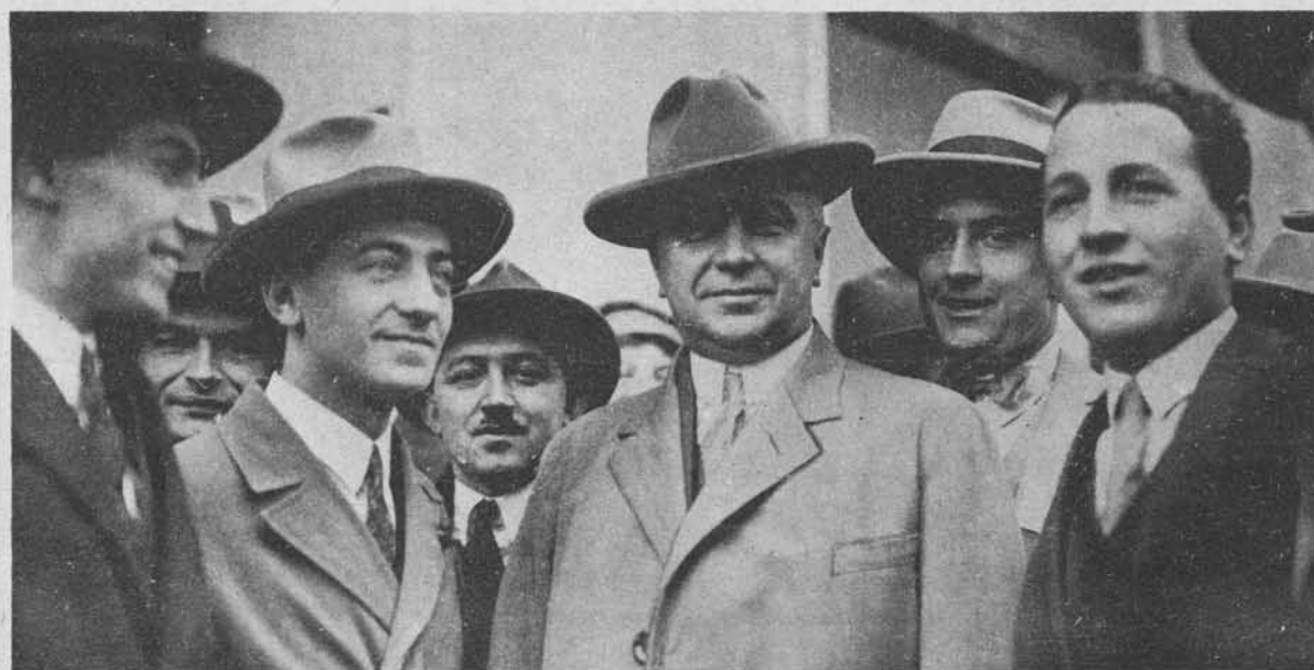
Dr. Milan Srškić, minister za izenačenje zakonov razlaga časnikarjem motivacijo demisije vlade dne 4. aprila.

Slika na desni: Nikola Pašić nosi v dvor ostavko RR vlade, tik za njim na desni je videti belgrajskega poročevalca »Slovenca«, g. V. Schweigerja.