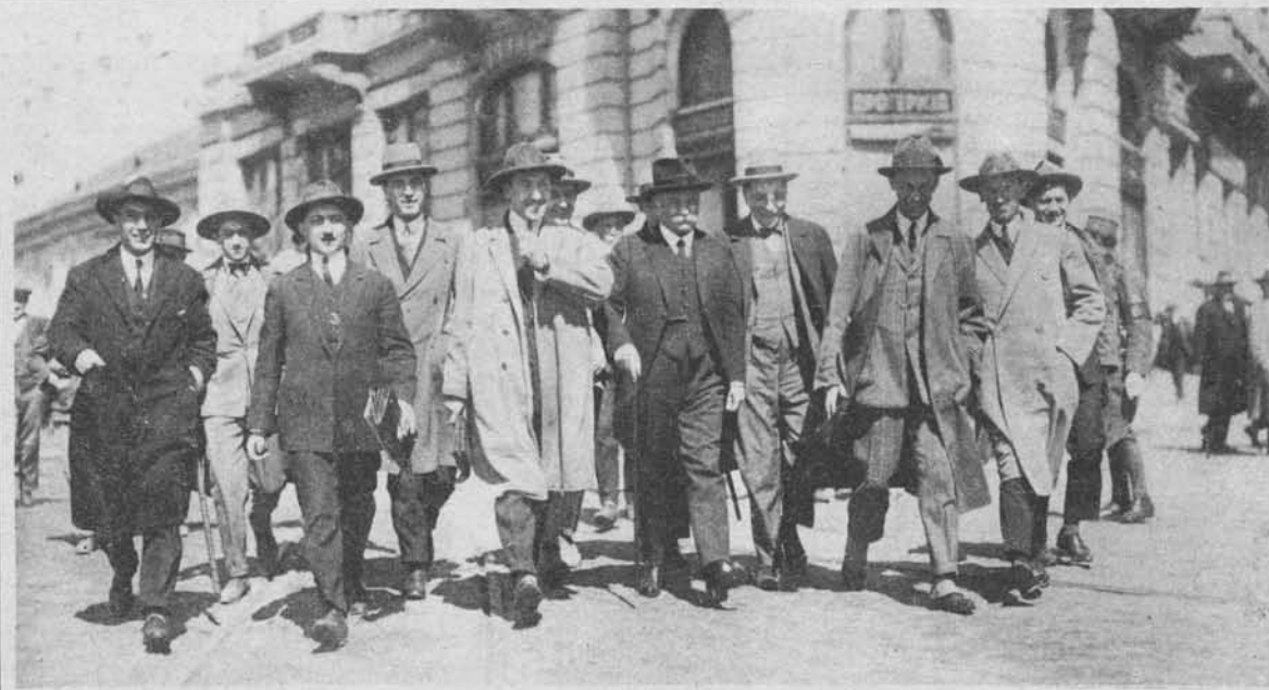
Ljuba Davidović po avdijenci pri kralju dne 5. aprila na poti v demokratski klub, spremljan od množice časnikarjev, ki ga prosijo za izjave.

Slika na desni: Nikola Pašić nosi v dvor ostavko RR vlade, tik za njim na desni je videti belgrajskega poročevalca »Slovenca«, g. V. Schweigerja.