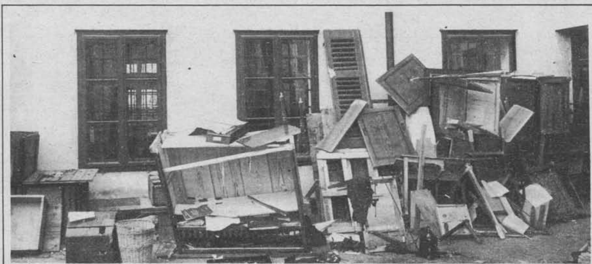
Dokumenti dvatisočetne italijanske kulture.

na katerega je bil izvršen nedavno atentat in je bil ob tej priliki lahko ranjen v nos. Slika nam ga kaže z zakrpanim nosom.