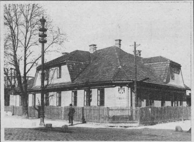
Poslopje, v katerem je nastanjena »Posredovalnica za delo«

za Slovenijo (Ljubljana, Poljanska cesta). Delavska zbornica je najvažnejša delavska ustanova, ki ima nalogo gospodarske in pravne koristi delavstva varovati in zastopati.