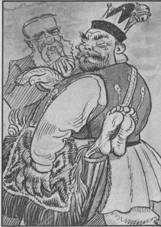
Slovenija l. 1921.