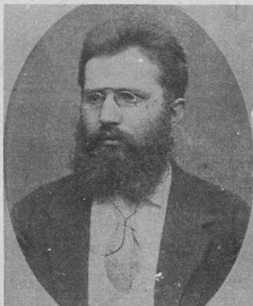
Bedenek Jakob (1850—1916), pisatelj.