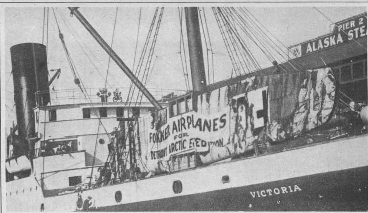
Dve novi ekspediciji na severni tečaj.

novi romunski ministrski predsednik, voditelj dosedanje opozicije.