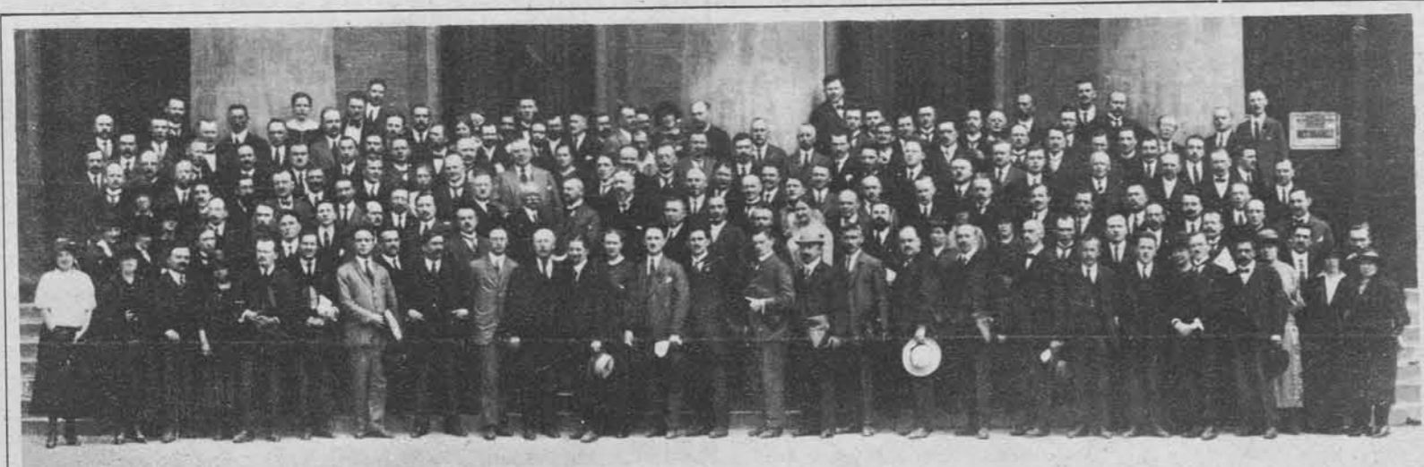
Udeleženci II. internacionalnega kongresa krščanskih strokovnih organizacij v Inomostu I. 1922. Krščansko delavstvo vseh narodov in držav je gojilo že pred vojno tesnemedsebojne stike, po vojni si je pa osnovalo tudi svojo mednarodno zvezo, ki ima svoj sedež v Utrechtu.