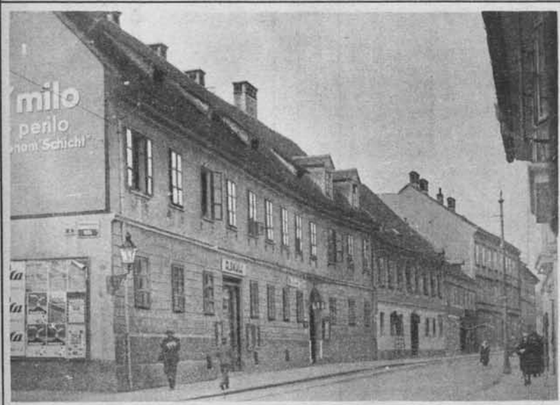
Poslopje, v katerem je nastanjena »Delavska zbornica«

ine 17. septembra 1925: Padli Druzi in legionarji, med katerimi je tudi več Slovencev.