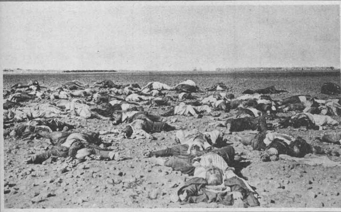
Po boju francoske armade in njene tujske legije z upornimi Druzi v Siriji

Od ljudi, ki ne vidijo za ped pred nosom, se zadnje čase vedno močneje pojavlja propaganda za izseljavanje, ki je pa v današnjih razmerah naravnost zločin nad delavstvom. Naloga delavskih organizacij in korporacij je, da napnejo vse sile, da dobe naši ljudje dela in zaslužka doma na domači zemlji in skušajo v to svrhu vplivati na ozdravljenje naših razrvanih gospodarskih razmer, izseljevanje je pa prav poslednji izhod v skrajni sili, a še tedaj se mora vršiti vestno organizirano in z intenzivnim sodelovanjem poklicanih činiteljev, katerih je pa mnogo, mnogo. Če kje, je tu demagogija pogubonosna. F. E.