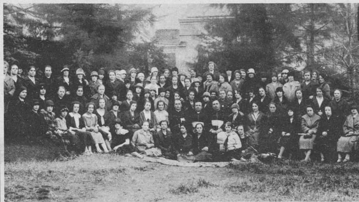
Društvo katoliških služkinj v Belgradu, povečini Slovenke.

Pred kratkim se je vršila v Št. Ilju v Slov. goricah velika vinska razstava — doslej največja v Sloveniji —, ki je vzbudila med interese veliko pozornost in priznanje. Na naši levi sliki vidimo požrtvalne gospe in gospodične, ki so stregle gostom, desna slika nam pa kaže del razstave same.