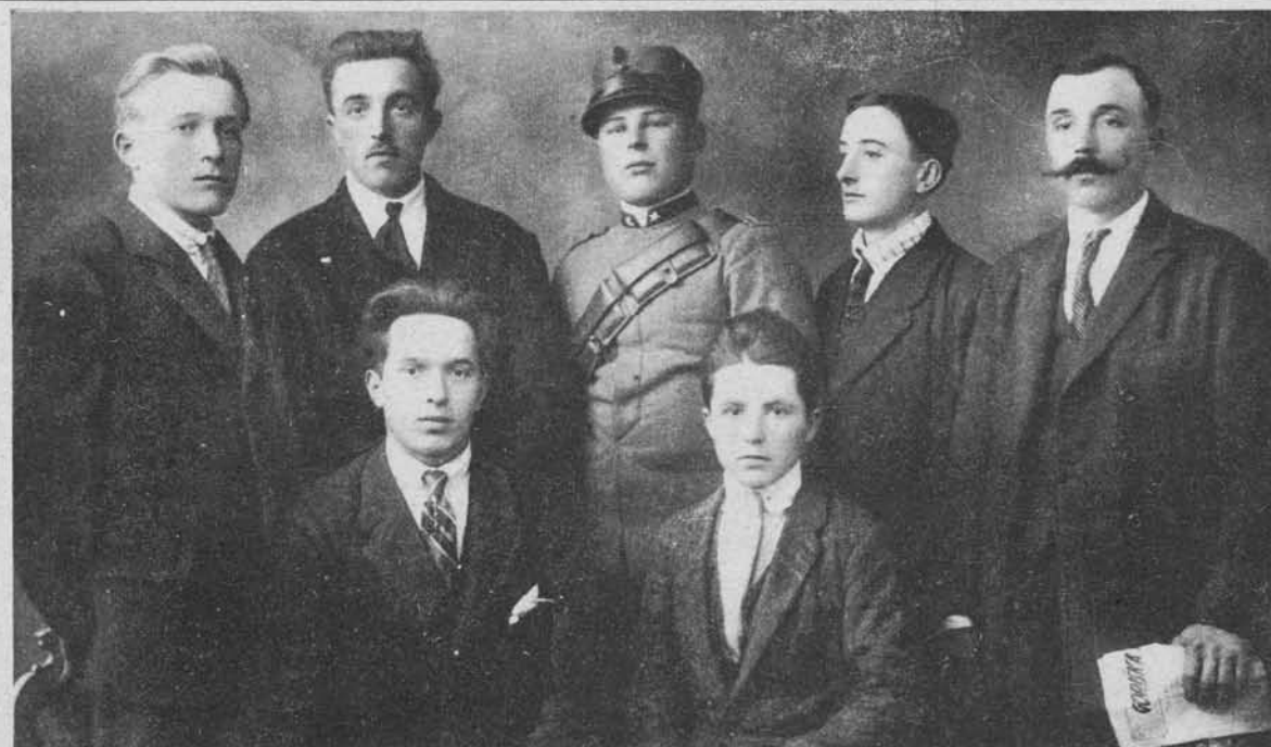
K sliki na levi:

znani slovenski skladatelj, ki je dne 17. t. m. umrl v Novem mestu v 89. letu svoje starosti. Njegova opera »Gorenjski slavček« ter neštne cerkvene skladbe so zanesle njegovo ime pač med najširše plasti ljudstva.