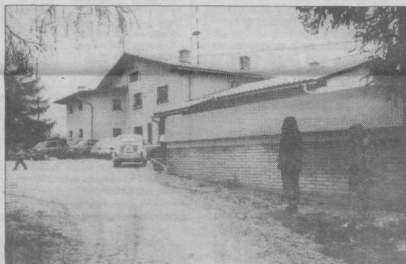
Zaradi pomanjkljivosti in napak pri izvedbi del, za katera mora odgovarjati SCT, krajan Janče ne vedo, kdaj bo zgrajen vodni zbiralnik pri planinskem domu naposled služil svojemu namenu. Bodo še dolgo plačevali tretjino denarja (dve tretjini pa občina) za prevoz in oskrbo z vodo in »podpirali« gospodarski kriminal.