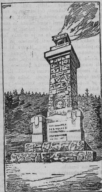
Das Rosegger-Denkmal in Jägerndorf.

Velikemu kmetskemu pisatelju dr. Petru Rosegger postavili so nemški železničarji v Jägerndorfu krasni spomenik, katerega prinaša današnja slika. Spomenik je