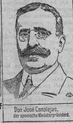
Don José Canalejas, der spanische Ministerpräsident.