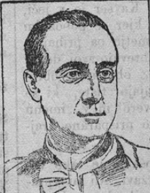
Kardinal Staatssekretär Merry de Val, welcher die Verhandlungen für den Vatikan führt.