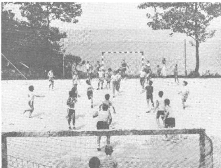
Škoda, ker fotografija ni barvna. Videli bi lepo modro morskno ozadje in navdušene nogometaše na pacuškem športnem igrišču, oblečene v pisane majice. Da pa uživajo, se pa tako ali tako vidi.

Republiški odbor za šport je s problematiko seznanil tudi odbor za vzgojo in izobraževanje ter telesno kulturo na ravni Skupščine Republike Slovenije ter predlagal, da se v njem obravnavajo najpomembnejša odprta vprašanja, med drugim tudi predlog za ustanovitev samostojnega republiškega upravnega organa za šport.