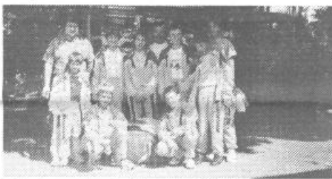
Mlada namiznoteniška ekipa ŠD Podpeč-Preserje

Zgraditi je bilo potrebno nov dimnik. Zgrajena je bila tudi tuš kabina. Potrebno pa bo pred mrazom še toplotno izolirati strop v celem objektu, za kar pa nam manjka sredstev. Radi bi tudi uredili garderobe za igralce. Z ogrevano dvorano smo prišli do prostora, ki je uporaben celo leto, izjemoma tudi za druge namene.