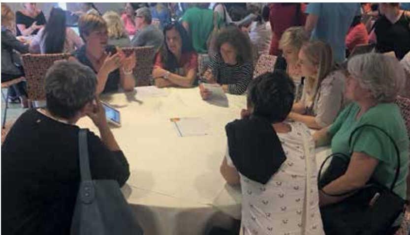
Slika 1: Konferenca o učenju in poučevanju matematike (KUPM 2018).

Pod temo Poti za izboljšanje učnih dosežkov smo v začetku leta 2018 (26. januar) izpeljali seminar Kako ohranjati radovednost in spodbujati ustvarjalnost pri predmetih spoznavanja okolja, naravoslovje in tehnika ter družba . Udeleženci so bili deležni bogatih strokovnih izhodišč na temo radovednost in ustvarjalnost ter idej za prakso. Tudi sami so se preizkusili v različnih dejavnostih, ki so od njih zahtevale ustvarjalen pristop.