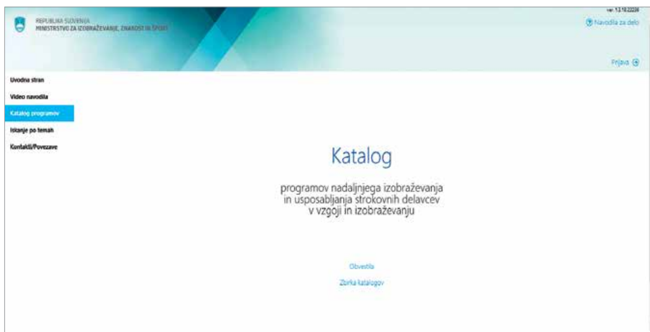
Slika 2: Katalog Katis