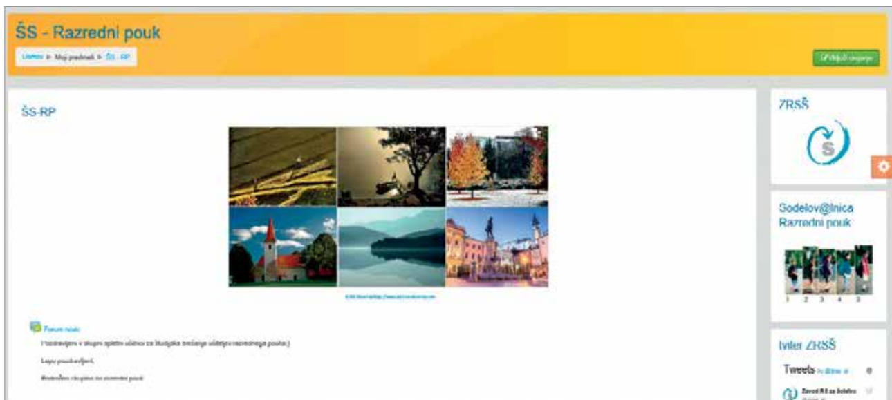
Slika 1: Spletna učilnica za študijska srečanja.

Prijave na študijsko srečanje bodo potekale preko e-prijave na povezavi https://www.zrss.si/prijava/studijske-skupine-os/ .