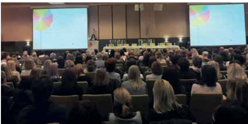
Slika 2: Konferenca za učitelje razrednega pouka.