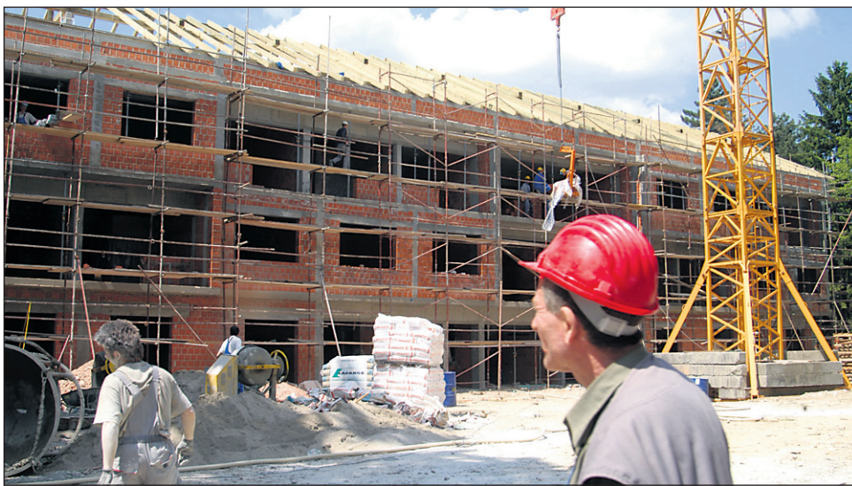
Na nov dom za starejše občane v Kidričevem so v teh dneh že postavili ostrešje, prihodnji teden pa naj bi ga tudi pokrili.

domu bodo imeli predvsem občani z območja občine Kidričevo in sosednjih krajev,