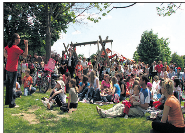
Čarovnika Grega je požel obilen aplavz.