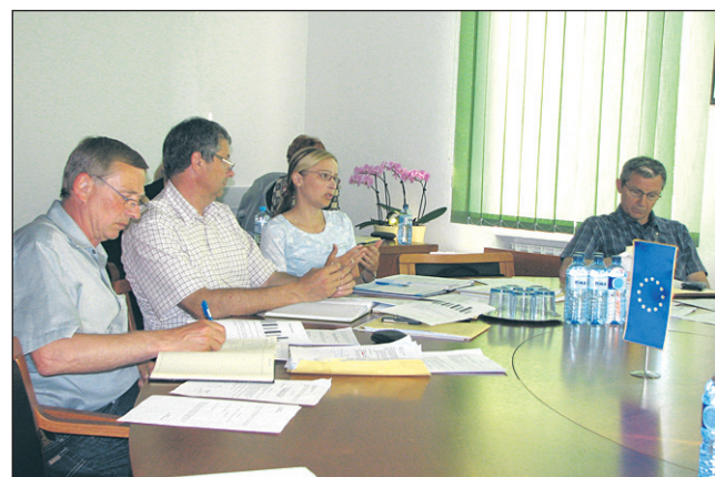
Seja se je začela v bolj okrnjeni sestavi.

Sveta Trojica • Četrta izredna seja sveta