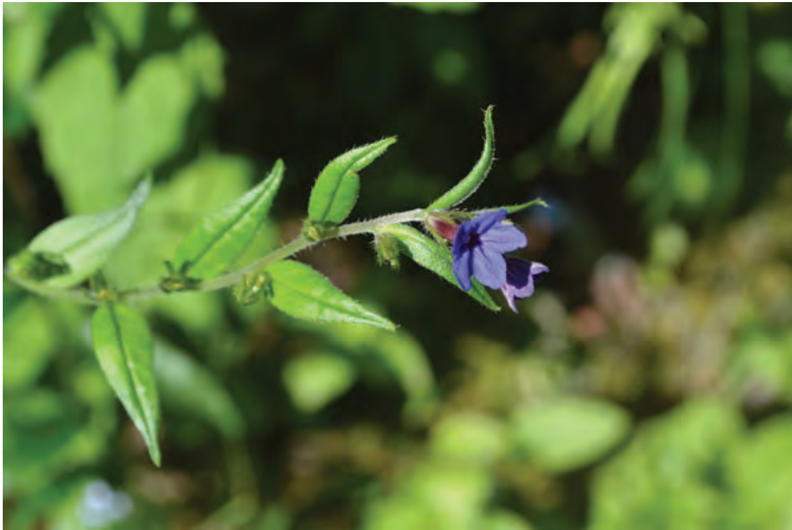
Figure 2 (Slika 2): Buglossoides purpurocaerulea , Grajska Jama