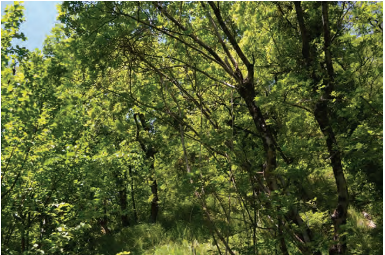
Figure 4: Site of Buglossoides purpurocaerulea in the southern Julian Alps (Gajšč under Skalca, above the village of Volarje) Slika 4: Rastišče škrlatnomodrega ptičjega semena ( Buglossoides purpurocaerulea ) v južnih Julijskih Alpah (Gajšč pod Skalco nad Volarjami)