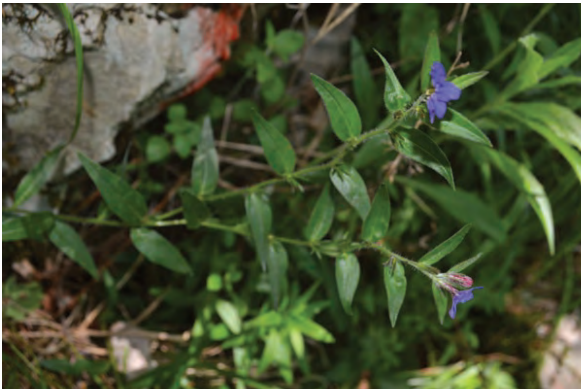
Figure 3 (Slika 3): Buglossoides purpurocaerulea , Gajšč (Volarje)