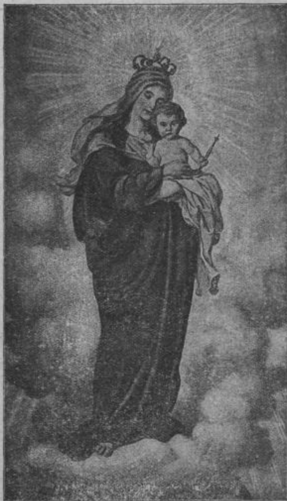
Marija z veseljom varje svojega Jezuška.

Na té reči nebeske matere se je svetnik jako potolažo, ar je spoznal ž njih, kak njoj je ljübljeno, če čas-