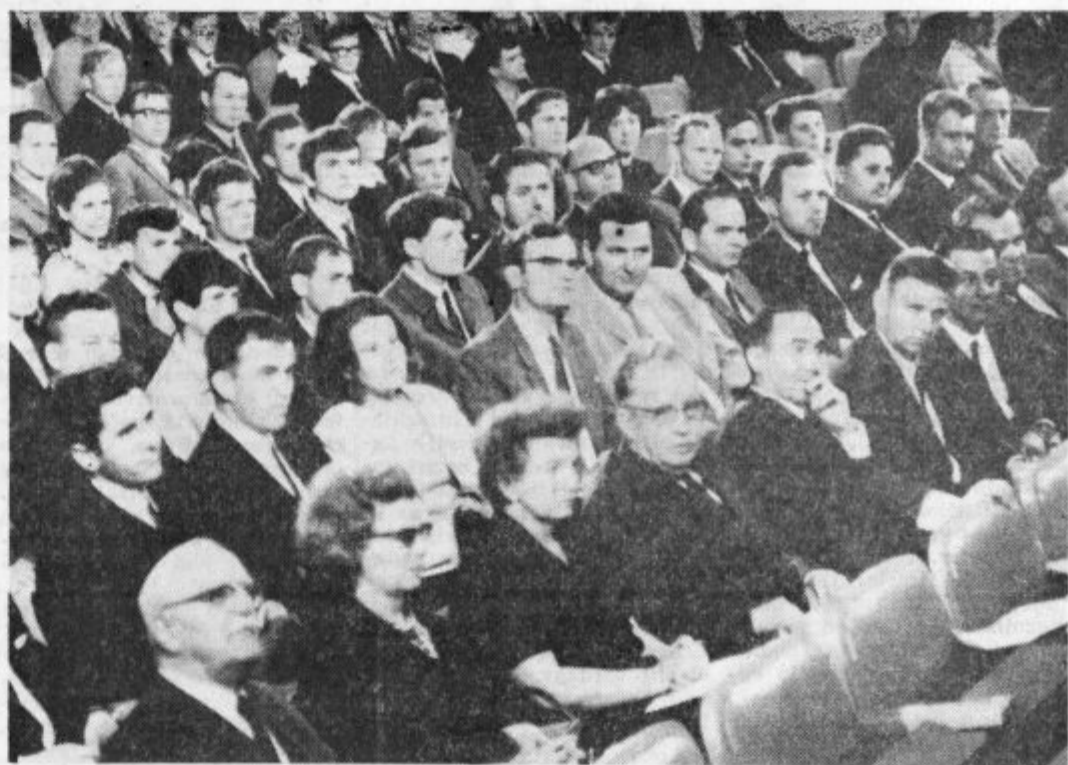
GOSTI IN DELEGATI NA 8. KONGRESU ZMS V VELENJU