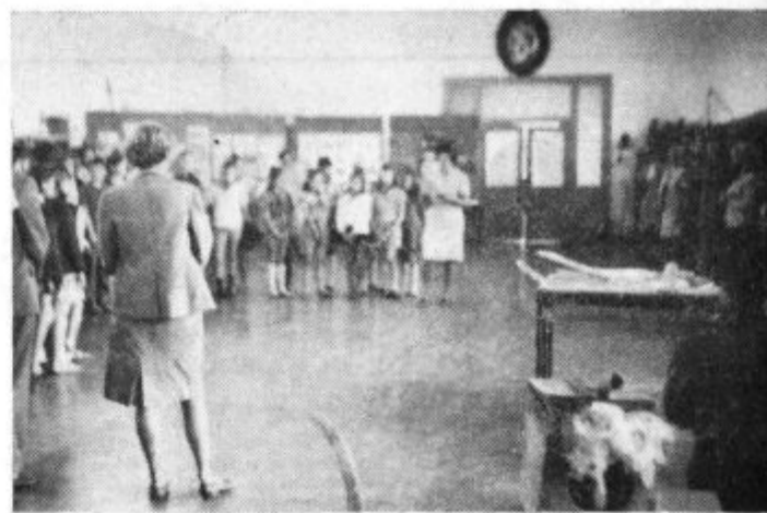
Z otvoritve razstave v osnovni šoli Miha Pintar-Toledo

Pionirji pa razstavljajo tudi izdelke tehničnih krožkov na šolah.