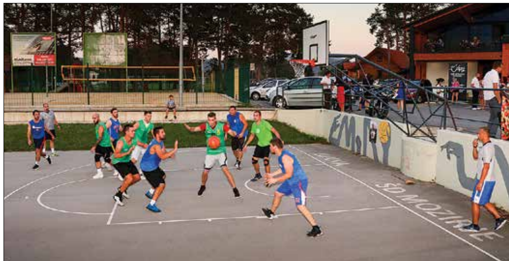
Pod košem se je za naziv najboljše potegovalo šest ekip.

Organizatorji so pripravili tudi tekmovanje v metanju trojk. Pod ko-