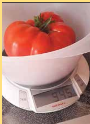
Na eni sami sadiki je bilo kar osem kilogramov paradižnika.

Da ne bo pomote, ogromen paradižnik ni zrasel na vsem znanem nogometnem igrišču, ampak le streljaj stran na domačiji, ki se ji po domače pravi pri Mizarju oziroma Albinu. Po besedah tamkajšnje gospodinje Ane Slovak je bilo na eni sami sadiki kar osem kilogramov paradižnika. Če bi sodili le po enem izmed njih, ki je tehtal nekaj deset dekagramov manj kot kilogram, v tamkajšnji shrambi letos sigurno ne bo manjkalo pripravkov, ki vsaki gospodinjji še kako prav pridejo pri pripravi raznovrstnih kulinaričnih dobrot skozi vse leto.