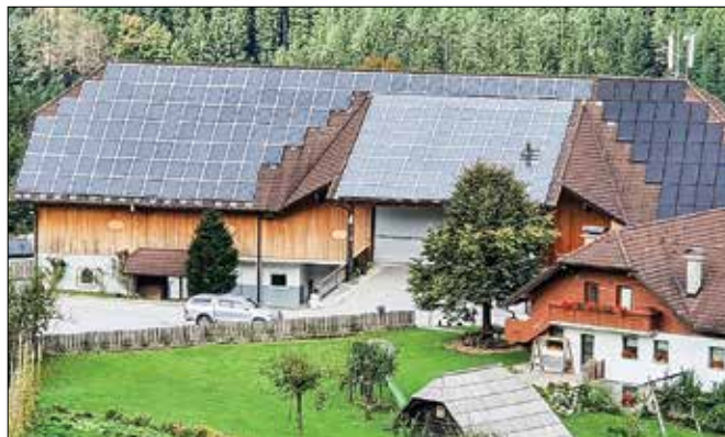
Lastniki so postavili sončne elektrarne na devetih objektih.