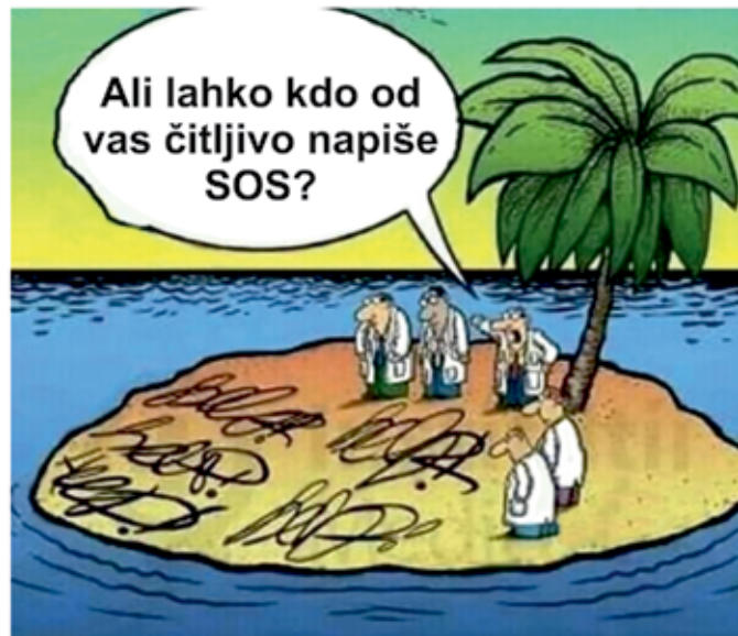
Zdravniki na samotnem otoku

Dare: "Ljubica se mi ne javlja na telefon."