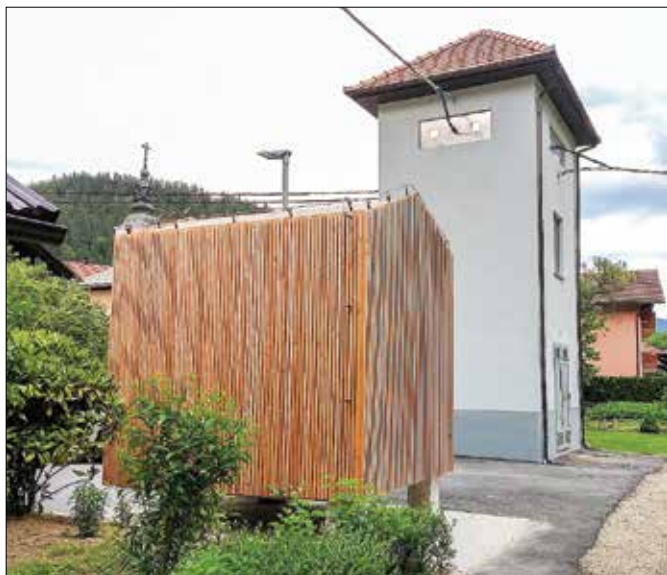
Sistemska baterija napaja 35 merilnih mest.

Metulja, na omrežje pa so priključeni še poslovalnica Pošte Slovenije, gasilski dom in kotlovnica ter poslovni prostori podjetja Biomasa. Krničani so se vključili v projekt predvsem zaradi slabih vodov in pogostih izpadov električne ener-