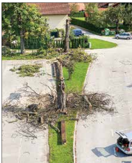
Dela ob športnem parku na Forštu