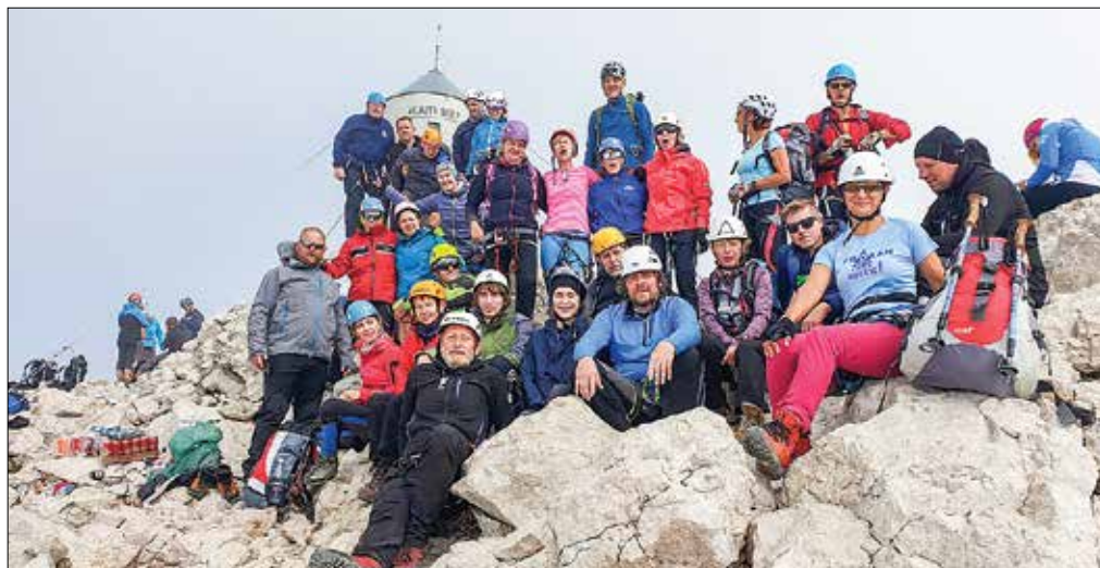
Jubilej društva so nazarski planinci proslavili na najvišji točki države.

Pot so pričeli na planini Blato, od koder so se podali do planine Jezero. Tam jih je pričakal izjemen pogled na vrhove, ki so se vzpenjali v modrino neba. Ta kulisa jih je ves dan spremljala na njihovi poti čez Dedno polje, Ovčarjino in Prode, vse do kočice pri Triglavskih jezerih. Ob jezerih so se povzpeli do Prehodavcev in se že precej utrujeni »pregrizli« čez Hribarce. Tisti z več moči so se vzpeli tudi na Kanjavec. Čakal jih je še spust do kočice na Doliču, kjer so se predali za-