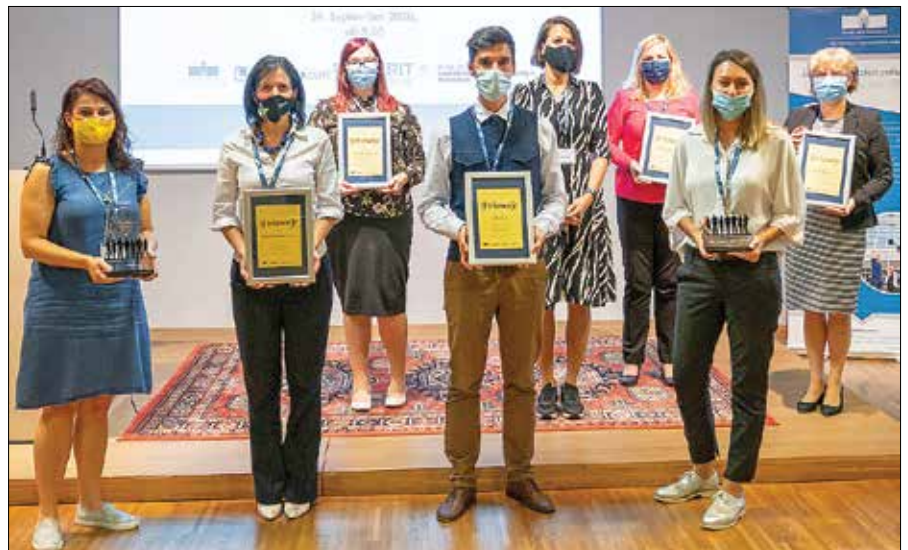
Prejemniki priznanj in nagrad za najboljše kadrovske prakse 2020

»Podjetje Plastika Skaza si je nagrado za najboljšo kadrovske prakse 2020 prislužilo, ker s svojimi ukrepi in programi omogoča ravnovesje med poklicnim in zasebnim življenjem zaposlenih, skrbi za pozitivno organizacijsko kulturo, spodbuja zaposlene k razvoju in izobraževanju, poleg tega pa je v lanskem letu prikazalo naj-