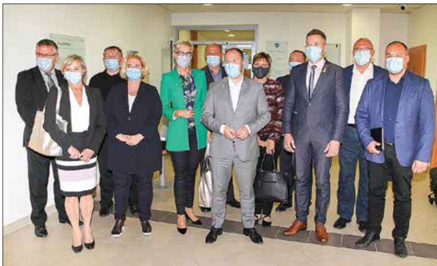
Minister Jernej Vrtovec (v svetlo sivi obleki) je po pogovorih izrazil upanje, da bo še v času aktualne vlade izvedenih vrsta projektov, o katerih se je pogovarjal z lokalnimi oblastniki.

Po dvournih pogovorih so se udeleženci iz sejne sobe Občine Mozirje zadovoljni zbrali v avli, kjer so sledile izjave o dogovorjenem. Minister Vrtovec je dejal, da želi biti blizu podeželju in da razume problematiko, ki se tu pojavlja.