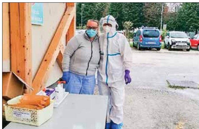
Testiranje za covid-19 izvajajo pri nazarski zdravstveni postaji po sistemu drive-in.

Izvajajo tudi samoplačniško testiranje. Na samoplačniški bris za