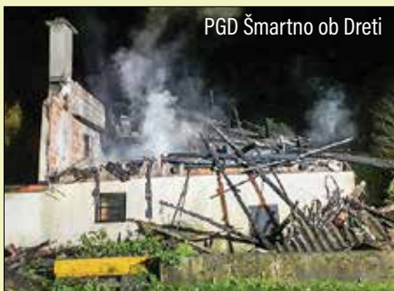
PGD Šmartno ob Dreti

Gasilcem uspelo preprečiti širjenje ognja na stanovanjsko hišo ..... 27