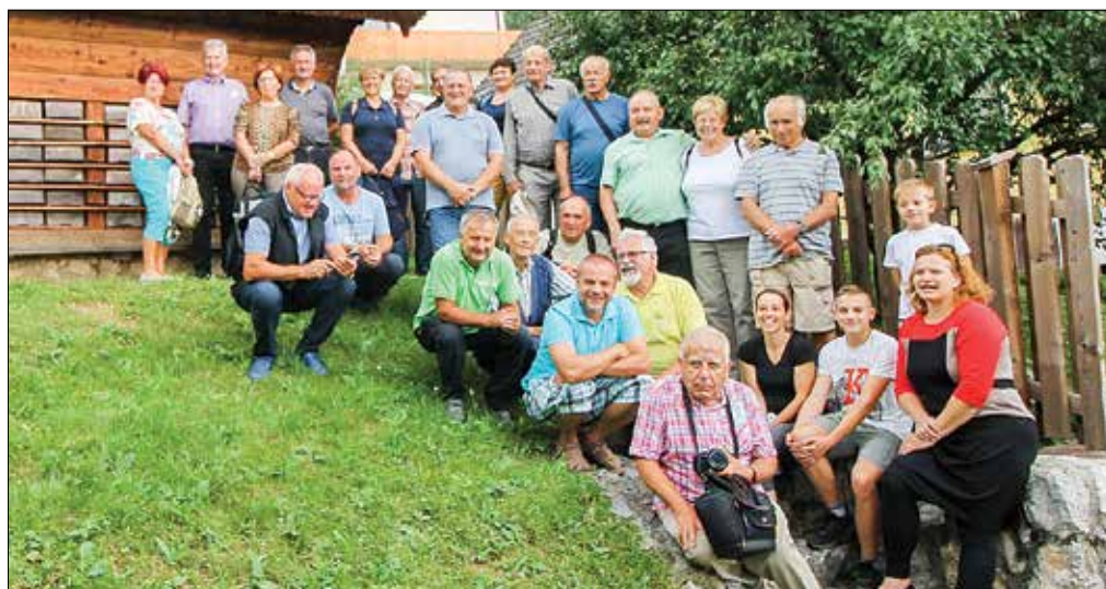
Ogled zanimivega in lepo ohranjenega Janševega čebelnjaka (fotodokumentacija zveze)

Sledil je voden ogled čebelnjaka znamenitega čebelarja Antona Janše, nato pa kosilo pri Lovskem domu Stol, kjer je na ogled