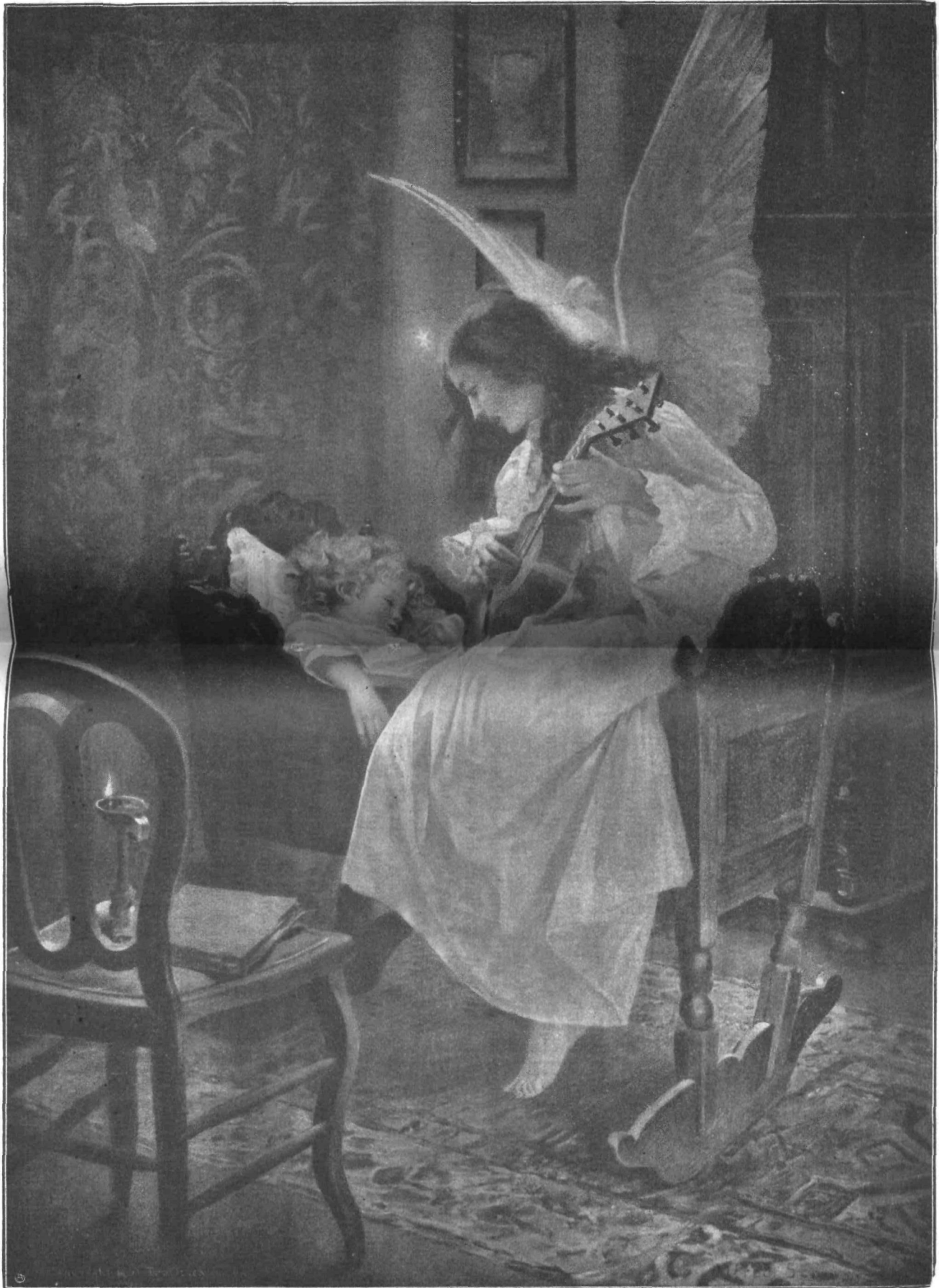
❖ V sladkih sanjah ❖