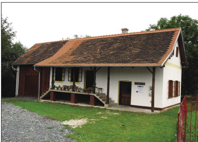
Iža se je obnovila v okviru projekta Saused k sausedi

pa zaka je prišla ta ideja, od tauga de zdaj nam on pripovejdo.