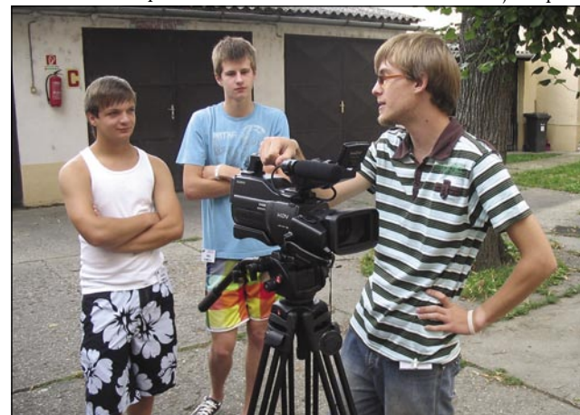
Fante je najbolj zanimalo delo s kamero

»Na ta tabor sem se prijavila zato, ker me je zmeraj zanimal svet medijev in se želim tudi pogovarjati po slovensko z udeleženci iz Prekmurja in upam, da se bom veliko naučila od njih. Najbolj me zanima novinarski poklic, v katerem sem se že tudi preizkusila, in upam, da bom ime-la možnost pisati za časopise