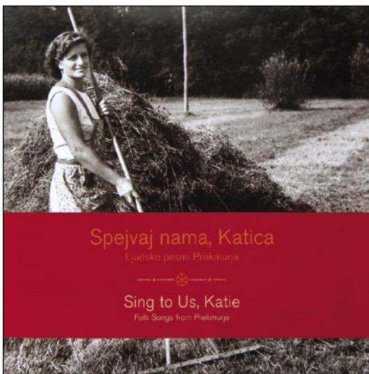
Kulturno podobo Prekmurja je oblikovala zavezanost zemlji. Grabljica v Nedelici leta 1973.