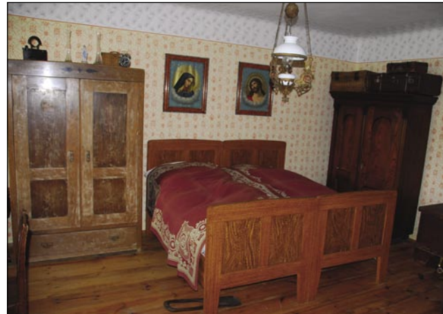
Lepau vred vzeta soba

»Prvin kak bi župnik Ferenc Merkli odišo iz Porabja je emo idejo, ka v vsakšoj po-