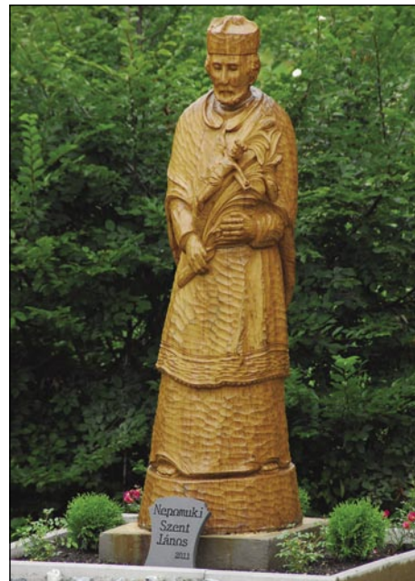
Kip sv. Janoša Nepomukija

rabskoj vesi postavi eden taši leseni kip (szobor), šteri je značilen za tisto ves. Na Dolejnem Seniki teče največ potokov pa še Raba, zato smo si tak zmislili, ka se tü postavi leseni kip sv. Janoša