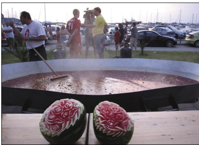
Golaž se je kuhal za petsto ljudi

šotori, v katerih smo gostom ponujali posebnosti naše države in jim pokazali, zakaj je vredno priti na Mad-