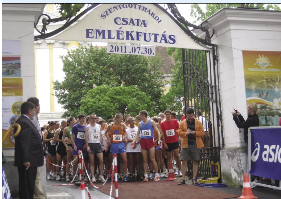
Teka v različni kategorijaj se je udeležilo več kak 250 lidi

tau bitki smrt strpalo 25 gezero törski sodakov, spadnilo je dosti paš (paša je v törskoj soldačiji bijo takši rang kak generališ v krščanskoj), krščanski sodacke so njim krajvzeli 15 štükov pa 40 zastav.