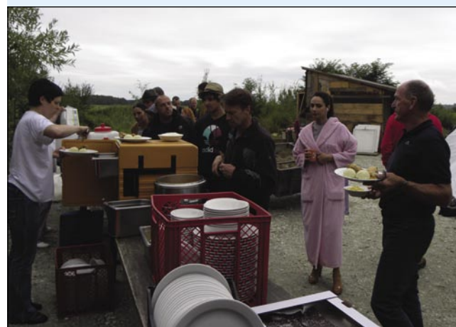
Ne samo igra/film, tudi kruh/kosilo

drugimi ustvarjalci, s katerimi smo že sodelovali, se ustvarjalno družili in bili pri tem uspešni. » Šanghaj je ljubezenska zgodba. Glavni protagonisti so člani ciganske družine Mirga . Spremljamo življe-