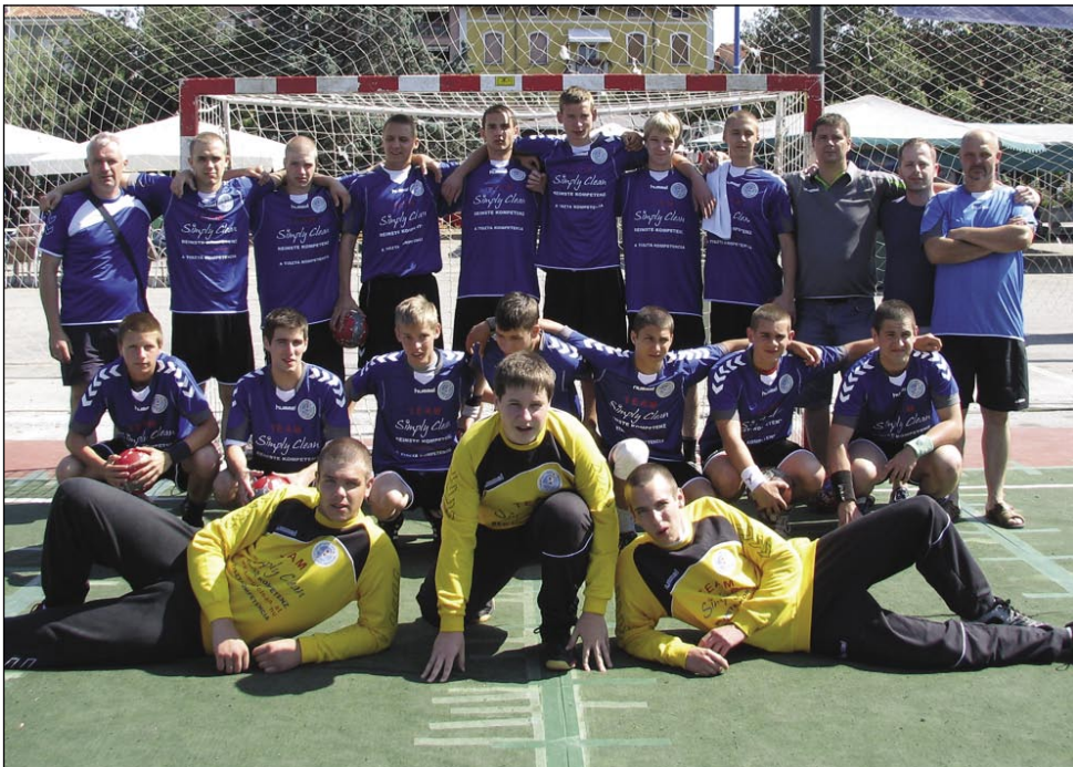
Monoštrska ekipa je trikrat zmagala in trikrat igrala neodločeno

čije, Avstrije, Portugalske, Češke in Madžarske. To leto je več kot 130 ekip tekmovalo v različnih kategorijah, med njimi tudi madžarska moštva: Simple Clean Szentgotthárd, Hajdúböszörmény, Veszprém (Gimnazija Vetési) in Budimpešta (Kőrösi DSE). Na prireditvi, ki je trajala šest dni, je bil posebni večer prijateljstva, na katerem se je letos predstavila Madžarska. Seveda so za predstavitev prosili nas, Monoštrčane, saj ima občina Izola dobre stike z Monoštrom.