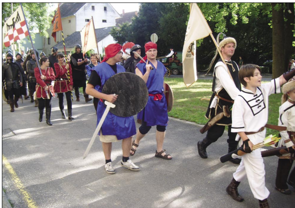
Monoštrski zgodovinski dnevi so se začnili v petek zadvečerek s povorko

Varaška bitka, stera se je po istini odvijala v dolini Rabe od Slovenske vesi do Dolenjoga Senika, je Törkom nej pistila, ka bi prišli prejk Rabe pa bi šli prauti Beči. Törški sodacke so bili na naši strani Rabe, tabor so meli pri Sakalauvcaj pa Dolenjom Seniki, vodo nji je veliki vezir Ahmed Köprülü, krščanski sodacke so bili prejk Rabe po modinski bregaj, nji je vodo Montecuccoli. Krščanskim sodakom so pauleg toga, ka je bijo Montecuccoli dober voj, pomagale višje sile tö. 1. avgusta, gda je bila glavna bitka, se je kauli 11. vöre prej tak začno dež lejvati, ka je Raba vövdarila, poplavila, zatok so Törki s svojimi štüki veznili pa težko konjenico so tö nej mogli tak ponücati kak so steli. Krščanski sodacke so nji potisnili v Rabo, dosta nji se je zalezalo potistim tö, gda so že bežžali. Po podatkaj je v