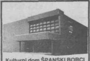
Kulturni dom ŠPANSKI BORCI