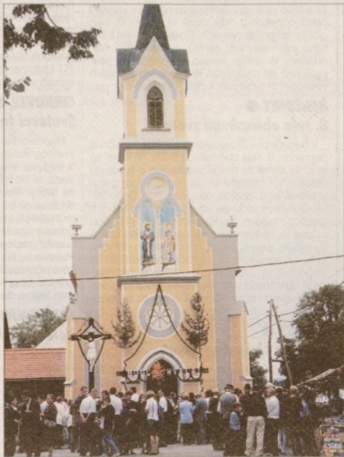
Na Anino nedeljo je bil tudi blagoslov obnovljene cerkve sv. Družine in križa.