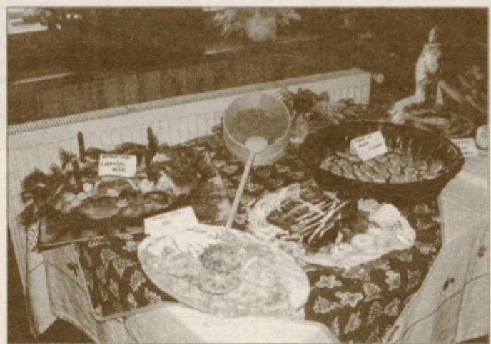
Vabljuje praznične jedi juršinskih gospodinj na razstavi...

Društvo gospodinj iz Juršinc je preteklo nedeljo kljub nenaklonjenemu deževnemu vremenu uspešno izpeljalo svoj 4. gospodinjjski praznik. Gospodinjje so tokrat predstavile tradicionalne praznične jedi ter pripravile pester kulturno-zabavni program.