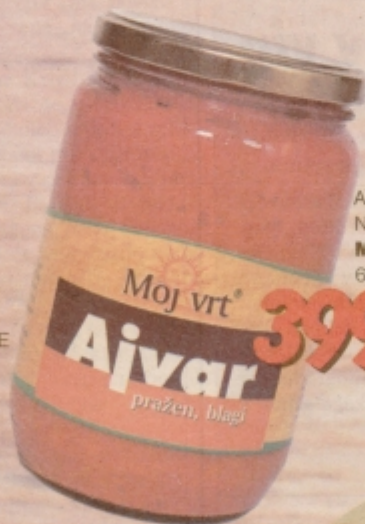
AJVAR NEPEKOČ MOJ VRT 650 g