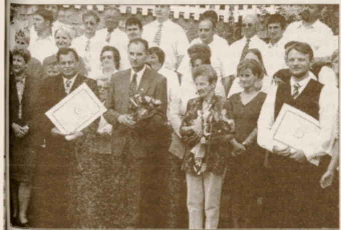
Dobitniki najvišjih občinskih priznanj za dobro in uspešno delo na vseh področjih.