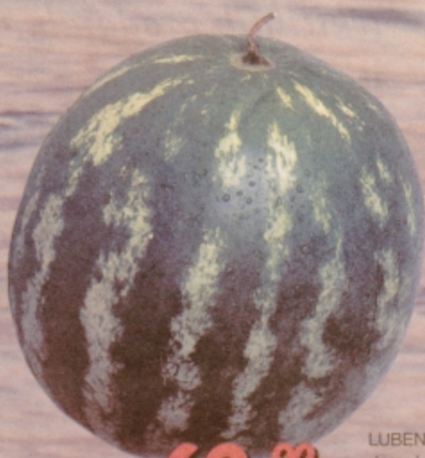
LUBENICE, domače MOJ VRT iz Slovenskih goric