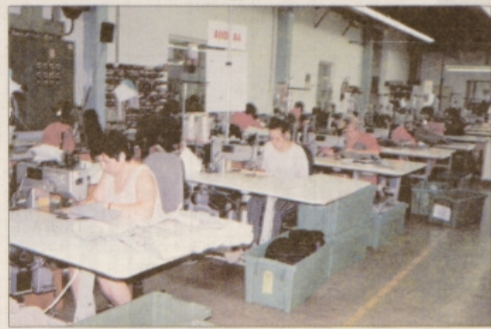
Večinski del kolektiva sestavljajo ženske, saj je med 771 zaposlenimi le 40 moških.