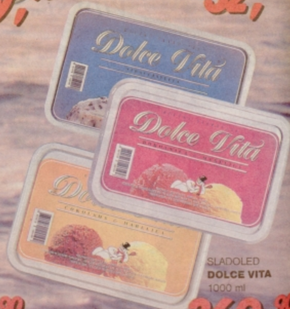
SLADOLED DOLCE VITA 1000 ml