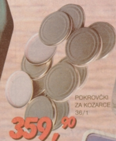
POKROVČKI ZA KOZARCE 36/1