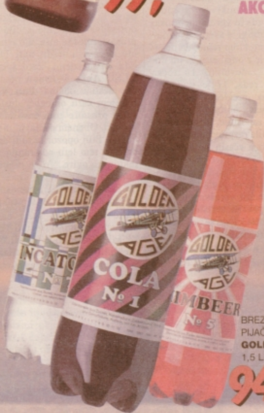
BREZALKOHOLNA PIJAČA GOLDEN AGE 1,5 L, različni okusi