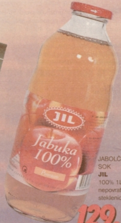
JABOLČNI SOK JIL 100% 1L nepovratna steklenica