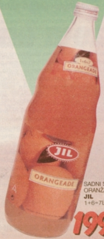
SADNI SIRUP ORANŽA JIL 1+6=7L