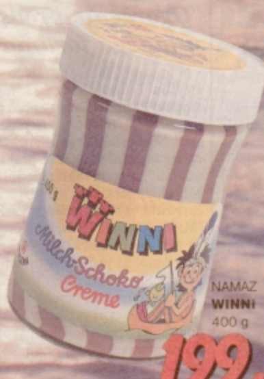
NAMAZ WINNI 400 g