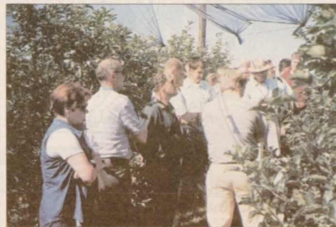
V sadonosniku z mrežami zavarovanim pred točo.

in se napotiti k sosedom v druge kraje ter se prepričati, kaj in kako počno na področju stroke, mimogrede pa si članstvo tako širi obzorje s pomočjo tamkajšnjih kulturnih in drugih značilnosti. Po uspehi ekskurziji pred dvema letoma k vinogradnikom v Goriška Brda, lansko leto v Belo Krajino, je v letošnjem začetku julija pot veljala našim sosedom na Južno Štajersko v Avstriji. Cilj potovanja in največ pozornosti je veljal ogledu Štajerske jabolčne ceste. Pokrajino med kraji Gleisdorf - Kaindorf - Stubenberg in Weiz na Južnem Štajerskem, oddaljeno okrog 40 km vzhodno od deležnega mesta Graz, povezuje 25 km dolga simbolično poimenovana Štajerska jabolčna cesta. Pokrajina, ki je po reliefu, padavinah, temperaturi in drugih naravnih značilnostih povsem podobna našim Slovenskim goricam, je skrbno urejena in zasajena s sadovnjaki. Po Štajerski jabolčni cesti nas je