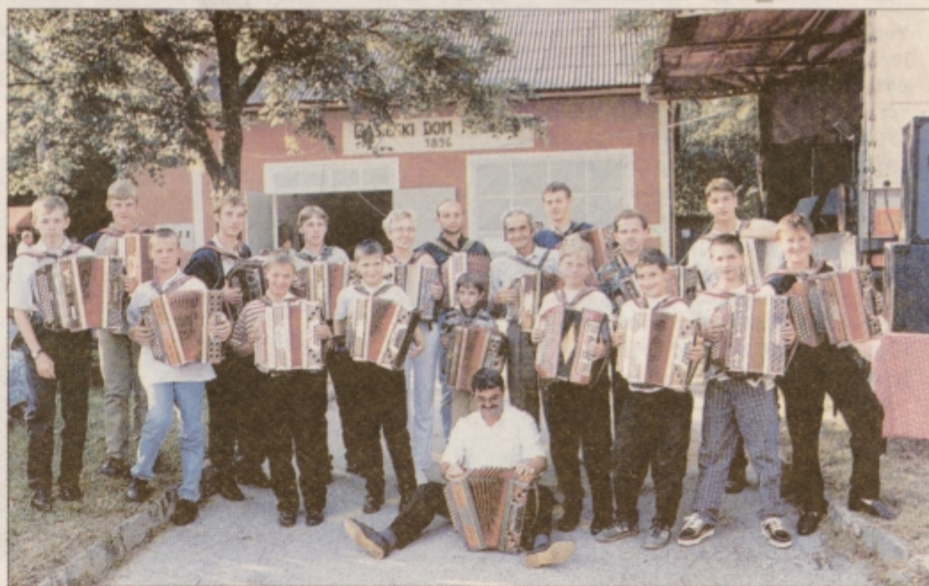
Na Hardeku so se zbrali frajtonarji vseh starosti