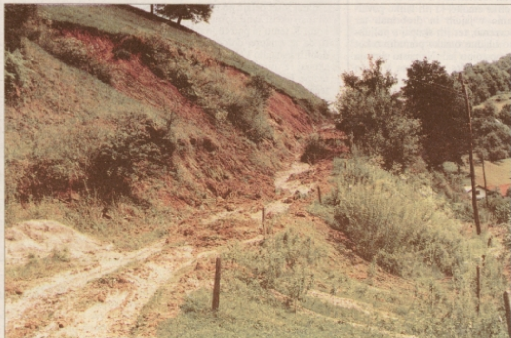
Najprej je bilo potrebno zagotoviti prevoznost lokalnih cest, ki so bile na več deset krajih zaradi plazov povsem neprevozne.