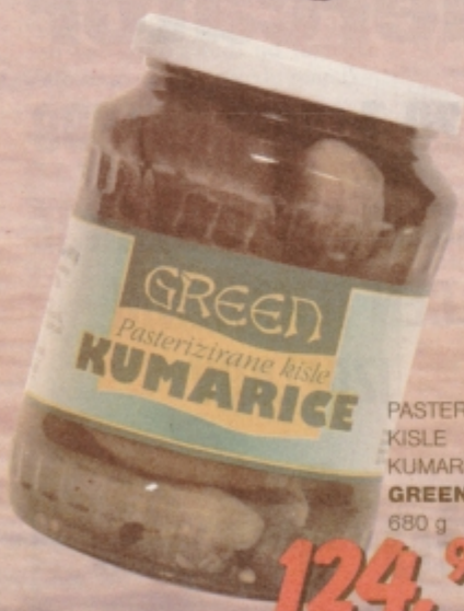
PASTERIZIRANE KISLE KUMARICE GREEN 680 g