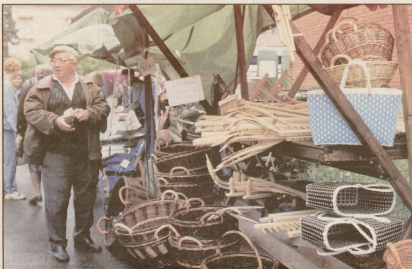
Konec julija Jakobovo v Ormožu, v začetku avgusta Ožbaltovo v Ptuj. Čas za trženje!

LJUBLJANA / BRANOST, GLEDANOST, POSLUŠANOST