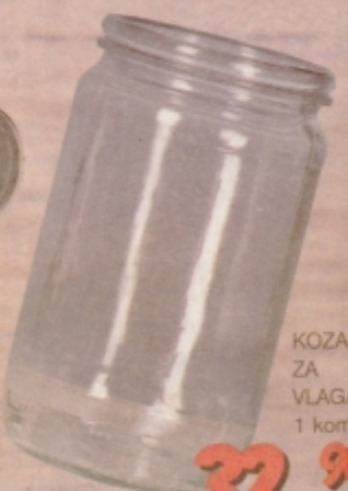
KOZARCI ZA VLAGANJE 1 kom