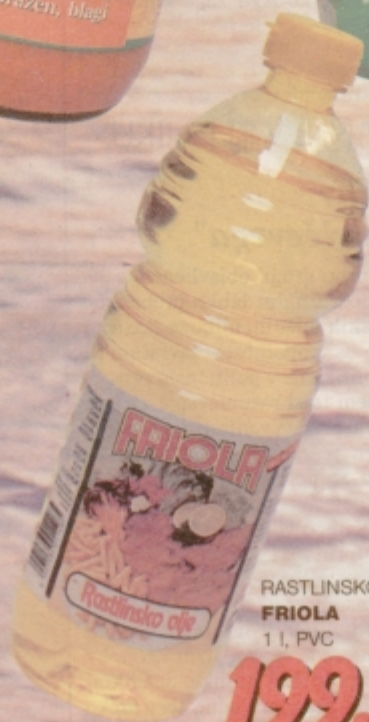
RASTLINSKO OLJE FRIOLA 1 l, PVC