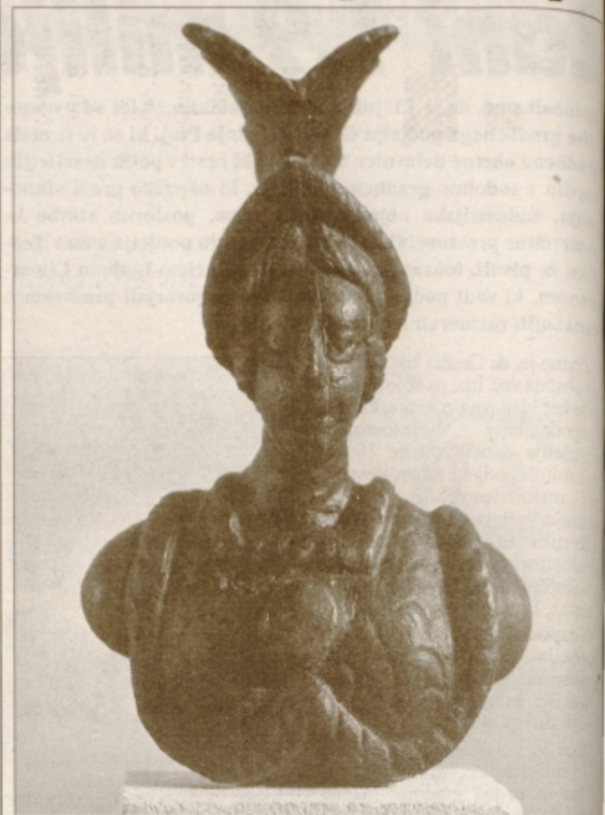
Katera boginja je na fotografiji?