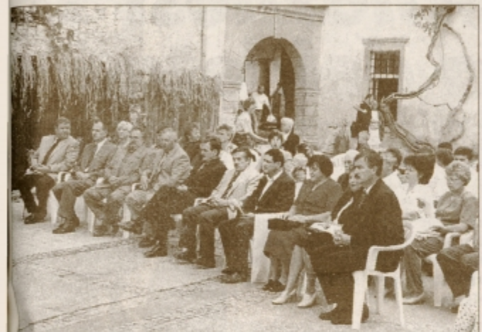
Na praznovanje gorišniškega praznika so prišli tudi nekateri župani sosednjih in bližnjih občin na Ptujskem.