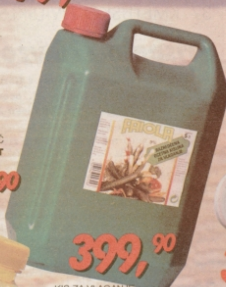
KIS ZA VLAGANJE FRIOLA 5 L