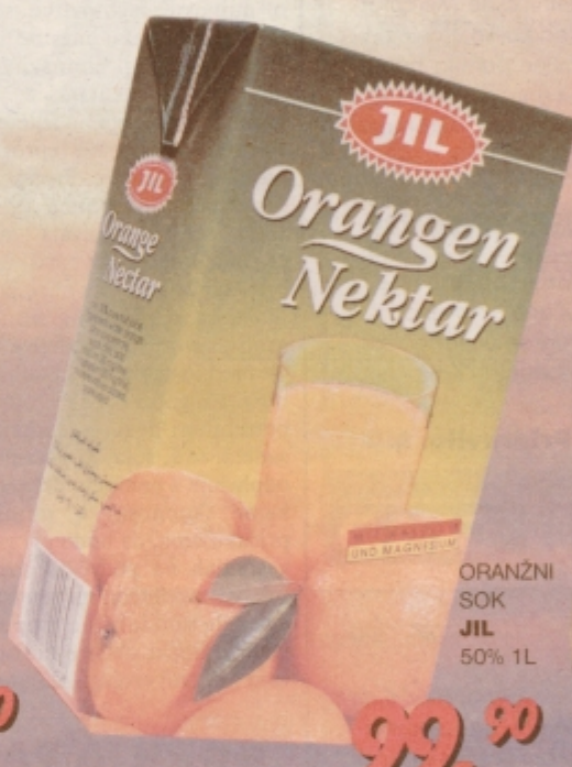
ORANŽNI SOK JIL 50% 1L