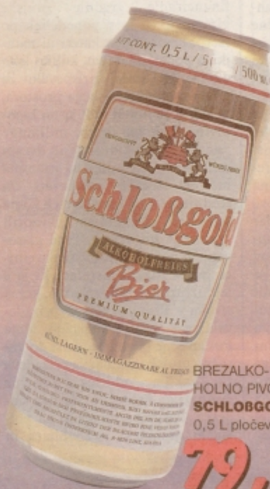
BREZALKO- HOLNO PIVO SCHLOßGOLD 0,5 L pločevinka