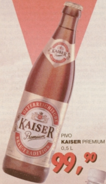
PIVO KAISER PREMIUM 0,5 L

AKCIJSKI POPUSTI, POSEBNE UGODNOSTI - IZKLJUČUJEJO STALNI POPUST!