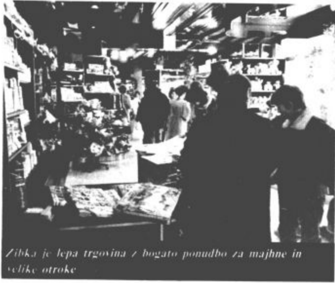
Zibka je lepa trgovina z bogato ponudbo za majhne in velike otroke