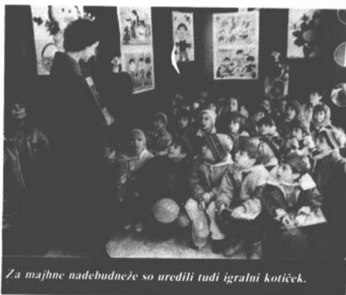
Za majhne nadebudneže so uredili tudi igralni kotiček.