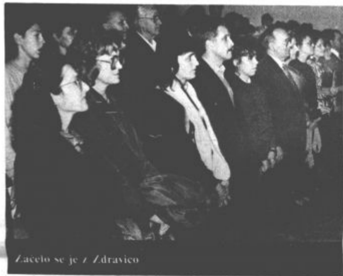
Začelo se je z Zdravico