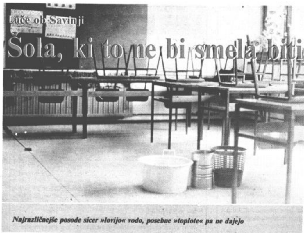
Najrazličnejše posode sicer »lovijo« vodo, posebne »toplote« pa ne dajejo

Kako neodgovorno in neresno se v naši ljubi družbi obnašamo, ali smo se obnašali, najbolj zgovorno priča primer osnovne šole v Lučah ob Savinji. Z vsem pompom je bila odprta pred devetimi 13 leti ob takratnem prazniku Mozirje.