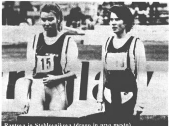
Rantova in Steblovnikova (drugo in prvo mesto)