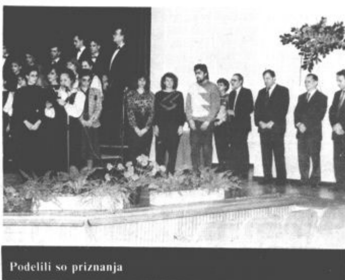
Podelili so priznanja