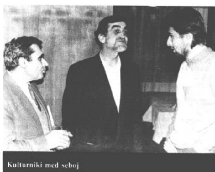
Kulturniki med seboj