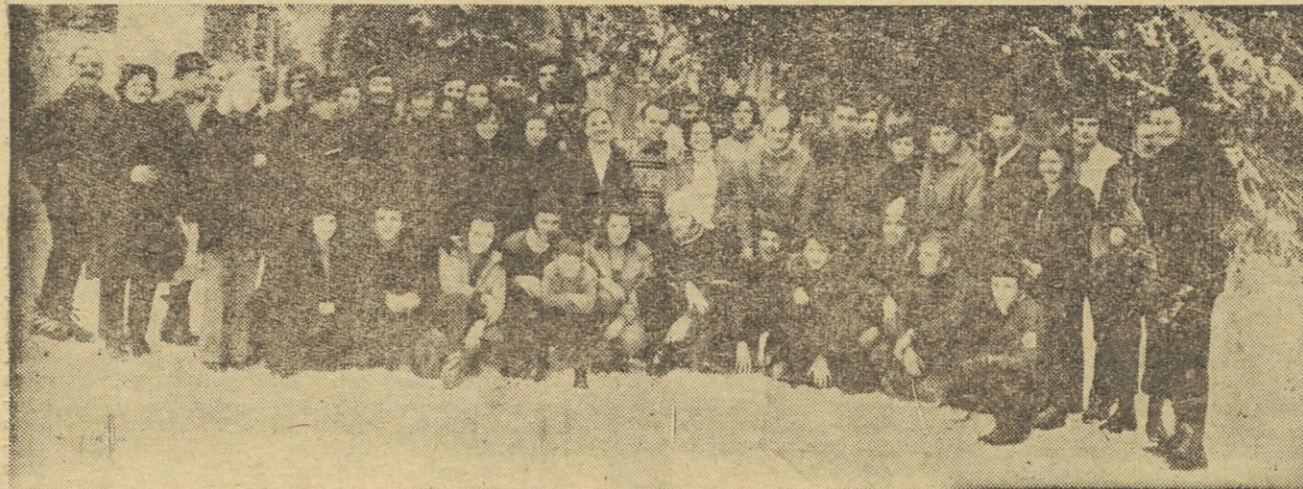
Z obrazov udeležencev prvega rekreacijskega izleta v Kranjsko goro odseva zadovoljstvo.

Cena tečaja: za odrasle 670,00 din za otroke 580,00 din