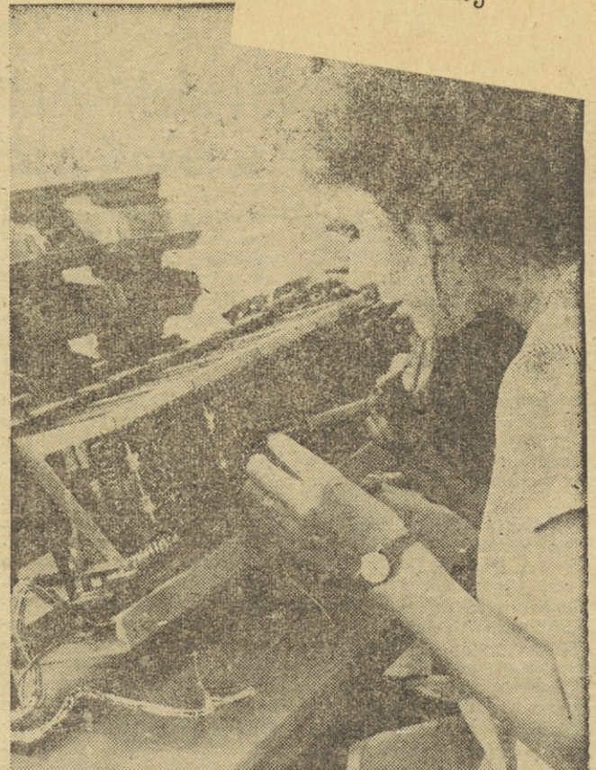
ELEKTROMEHANIKA — Spajkanje el. enot v obratu ATN

Ob zaključku tega poročila moramo še poudariti, da so navedeni kazalniki samo primerjava med proizvodnim načrtom in njegovo realizacijo. Predstavljajo sicer eno izmed glavnih osnov, s katero bomo ugotavljali uspešnost poslovanja, vendar bomo morali za dokončno ugotovitev, kako smo delali in gospodarili v preteklem letu, počakati še na zaključni račun tovarne. Eno sicer lahko ugotovimo, da smo take rezultate dosegali s povprečno manjšim številom delavcev, kot smo ga načrtovali, čeprav smo morali v zaključnem obdobju leta zaposliti več novih sodelavcev že v odnosu na predvideno povečanje proizvodnega načrta v letu 1973. Tako lahko zaključimo, da smo načrt uspešno izpolnili, čeprav obseg ni bil dosežen v celoti. Zato se moramo tem bolj usmeriti v naprej, kajti naloge, pred katerimi stojimo, so neprimerno večje in zahtevnejše, kot so bile dosedanje.