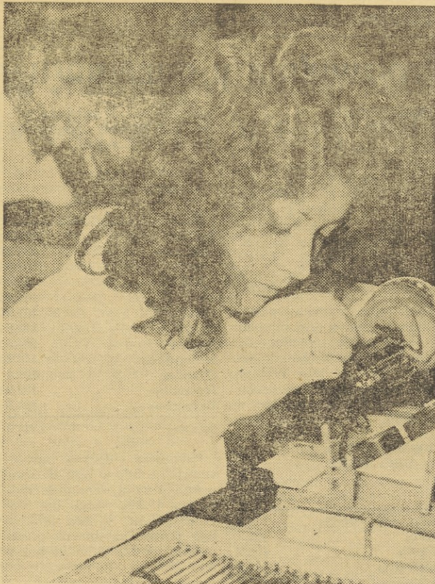
MOJCA SMOLEJ justira releje v obratu telefonskih elementov na Blejski Dobravi