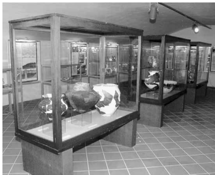
Pogled v arheološko razstavišče z različnimi tipi shrambnih posod. razstavišče v gradu Ormož, december 2008.