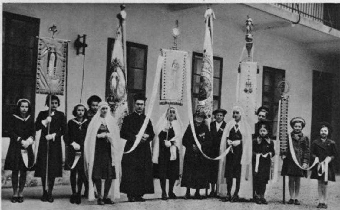
Ob 40 letnici ustanovitve deklaške Marijine kongregacije na meščanski šoli pri uršulinkah v Ljubljani — Zastopnice domače in sosestrskih kongregacij