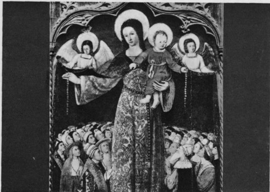
Mater omnium — Mati vseh

»V mesto pojdem; vsak gospodar bi me vzel in morda še katerega mojih sinov« — ta misel ga je omamljala. Pa je končno le ostal junak, poln zaupanja v božjo Previdnost.