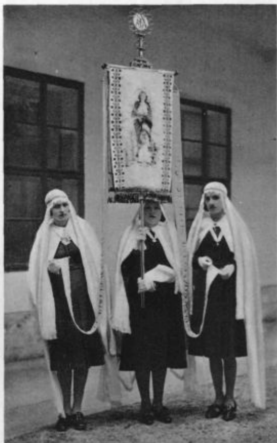
Nova zastava Marijine družbe za učenke uršulinske meščanske šole v Ljubljani