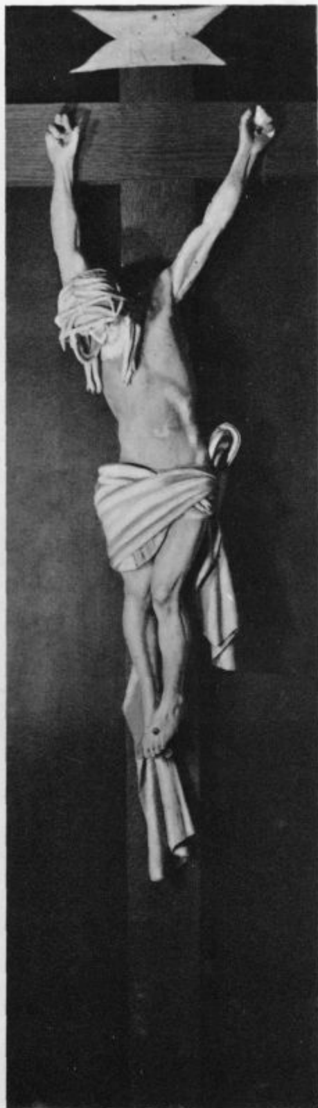
Jezus na križu