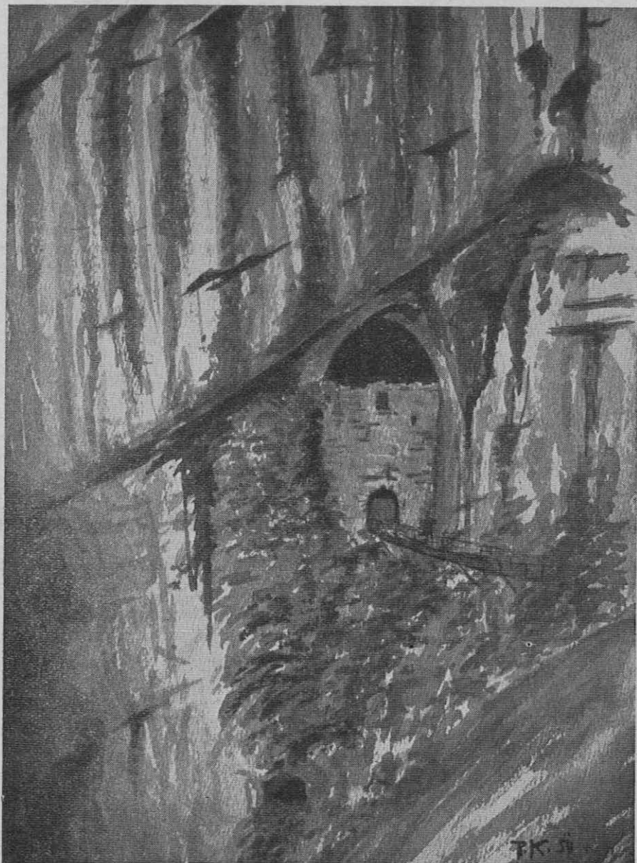
Risal Pavel Kunaver

Slika 4. Vhod v glavno jamo pod Predjamskim gradom. Prvi del jame se imenuje »Hlev«, ker je v srednjem in v začetku novega veka bil hlev za konje. Človek pa je v prvih 150 m jame prebival od kamene dobe dalje.