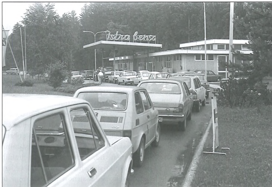
Gneča na bencinski črpalki (na klancu) v Medvodah, 12. 6. 1982.

se leta 1988 na trgu pojavila nova neravnotežja. Na strani povpraševanja se je spomladi povpraševanje po nekaterih trajnejših živilih tako razmahnilo, da so bile potrebne dodatne intervencije iz blagovnih rezerv. Dejavniki neravnotežja in motenj na trgu so bile konec osemdesetih še vedno cene, ne več kot nizke, temveč kot relativno visoke. 92