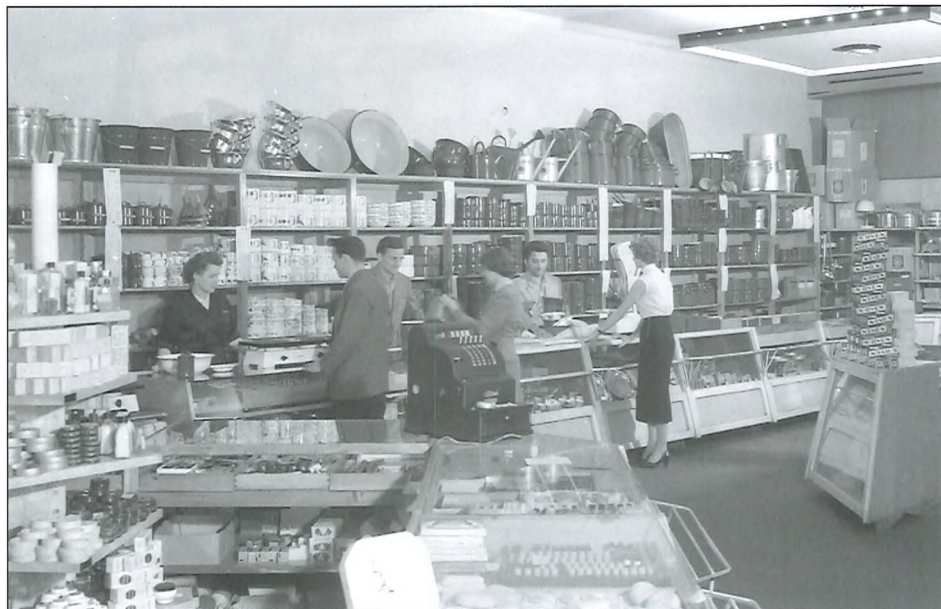
Nama, Ljubljana, junij 1956.

V obdobju 1955–1990 je trgovinski promet naraščal pri skoraj vseh vrstah blaga. Struktura blagovnega prometa na drobno je ustrezala strukturi blagovne potrošnje prebivalstva. Porabo nekaterih vrst blaga so zaradi spreminjanja potrošniških navad potrošniki opustili ali omejili. V skupini živil je poraba moke ves čas postopno upadala in je bila leta 1990 v primerjavi z letom 1955 za 57 % nižja. V petdesetih letih 20. stoletja je bilo v navadi, da so ljudje kupovali krušno moko ter kruh zamesili in spekli doma, ali pa ga nesli speč k peku. Do leta 1990 pa so se navade občutno spremenile. Kruh so bolj kupovali, kot pa ga sami pekli, zato je prodaja vseh vrst kruha naraščala.