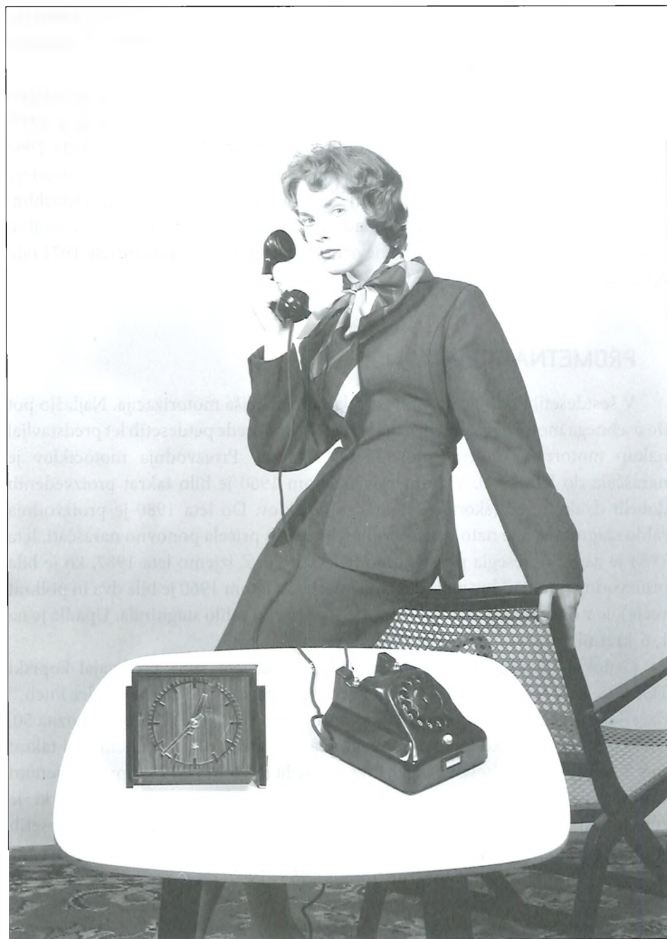
Izdelki Iskre Kranj, junij 1955.