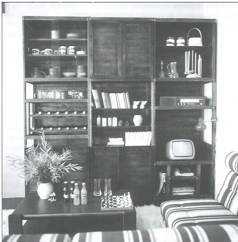
Dnevna soba tovarne Hoja, Ljubljana, november 1976.

obvezno domači barček. Ta je dajal videz obilja in udobja. Priljubljene so bile kontrastne kombinacije močnih barv: bela v kombinaciji s toplo rjavo, oranžno ali rdečo. Razširjeni so bili beli in topli toni, balonaste steklene in pozneje plastične Meblove luči; kosmate preproge; pohištvo iz krivljenega lesa in pleteno pohištvo. 33 Analiza prodaje nam kaže, da so se gospodinjstva najbolj množično opremljala s stanovanjskim pohištvom (sobnim in kuhinjskim) sredi sedemdesetih let. Kupna moč prebivalstva se je po letu 1968, ko se je intenzivno začela izvajati politika uveljavljanja potrošniških kreditov, zelo povečala. 34