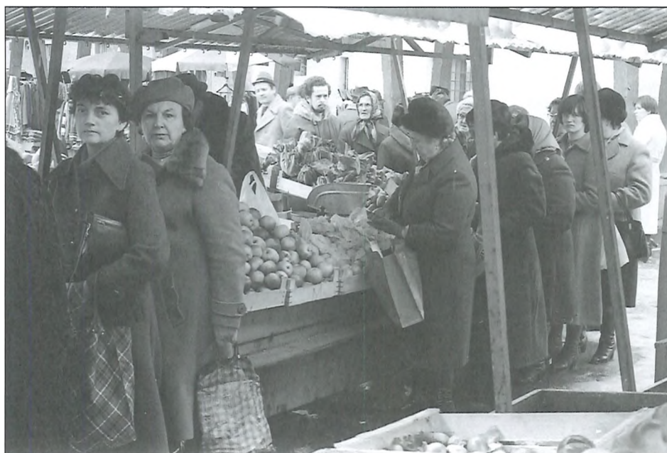
Vrste na ljubljanski tržnici, 25. 2. 1981.

svežega sadja naglo krčila in do leta 1990 se je količinski promet v primerjavi z letom 1975 skoraj prepolovil. 85 S preskrbo, kvaliteto in cenami južnega sadja pa po pisanju časopisa Tovariš potrošniki niso bili zadovoljni že v sedemdesetih letih. Sadje je bilo večkrat nagnito, prezrelo, poškodovano, imelo je predebelo lupino, premalo soka in visoko ceno. 86