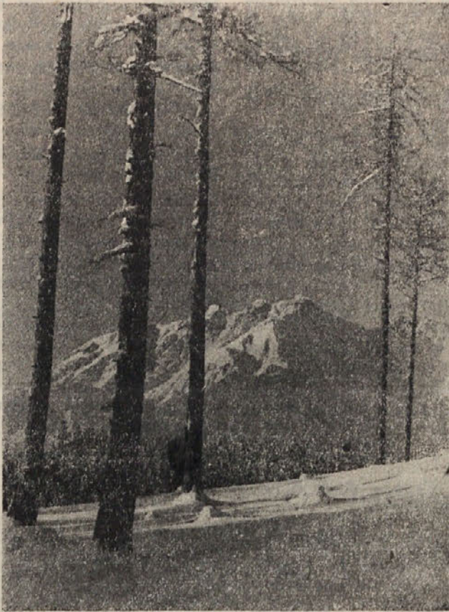
ZIMA SE POSLAVLJA — POMLAD SE BLIŽA

Na splošno večkrat smo že povabili nakupa potrebne ali željne čitatelje, naj se predvsem pri večjih nakupih ali nakupih koles, motornih koles, avtomobilov in sličnega obrnejo na naš oglasni oddelek, ki jim bo izposloval določen popust.