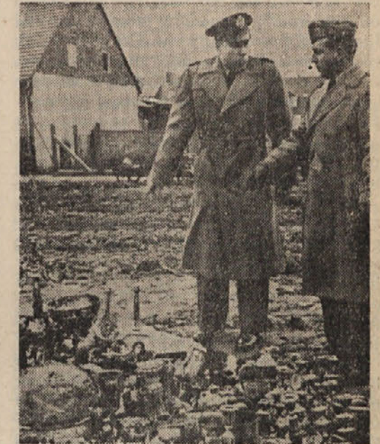
V Württembergu v Nemčiji so našli ameriški pionirji v nekem prepravljemem rovu srebrnine za 100.000 DM. Zvedeli so, da je to srebrnino skrnil nekaj mesecev pred koncem vojne neki tovarnar srebrnih predmetov v zaboje in te zakopal v zemljo. Ker ta tovarnar vojne ni preživel, so dali zdaj to srebrnino njegovim dedičem. (AND/INP)

Sočnato, po možnosti doma skisano zelje (z zelnico) denemo v skledo in ga lepo narahljamo. Potem si pripravimo na štedilniku lonec z vrelo vodo in ga pokrijemo z narobe obrnjeno pokrovko. Na to pokrovko postavimo skledo s kislim zeljem in pustimo, da se lepo počasi ogreje. Medtem razbelimo 1/8 l dobrega olja ali nekaj masti, zrežemo drobno dve do tri čebule in jih dušimo v olju ali masti, da so mehke. Tik preden damo zelje na mizo, ga polijemo s to zabelo in ga krepko premešamo z 2 vilicami. V tako pripravljemem kislem zelju so ohranjeni vitamini in važne rudninske snovi, ki se sicer izgube, če zelje dolgo kuhamo in mu celo odvezamo vodo, v kateri se je kuhalo. Toplo surovo kislo zelje se prilega dobro ostalim kuhanim jedem.