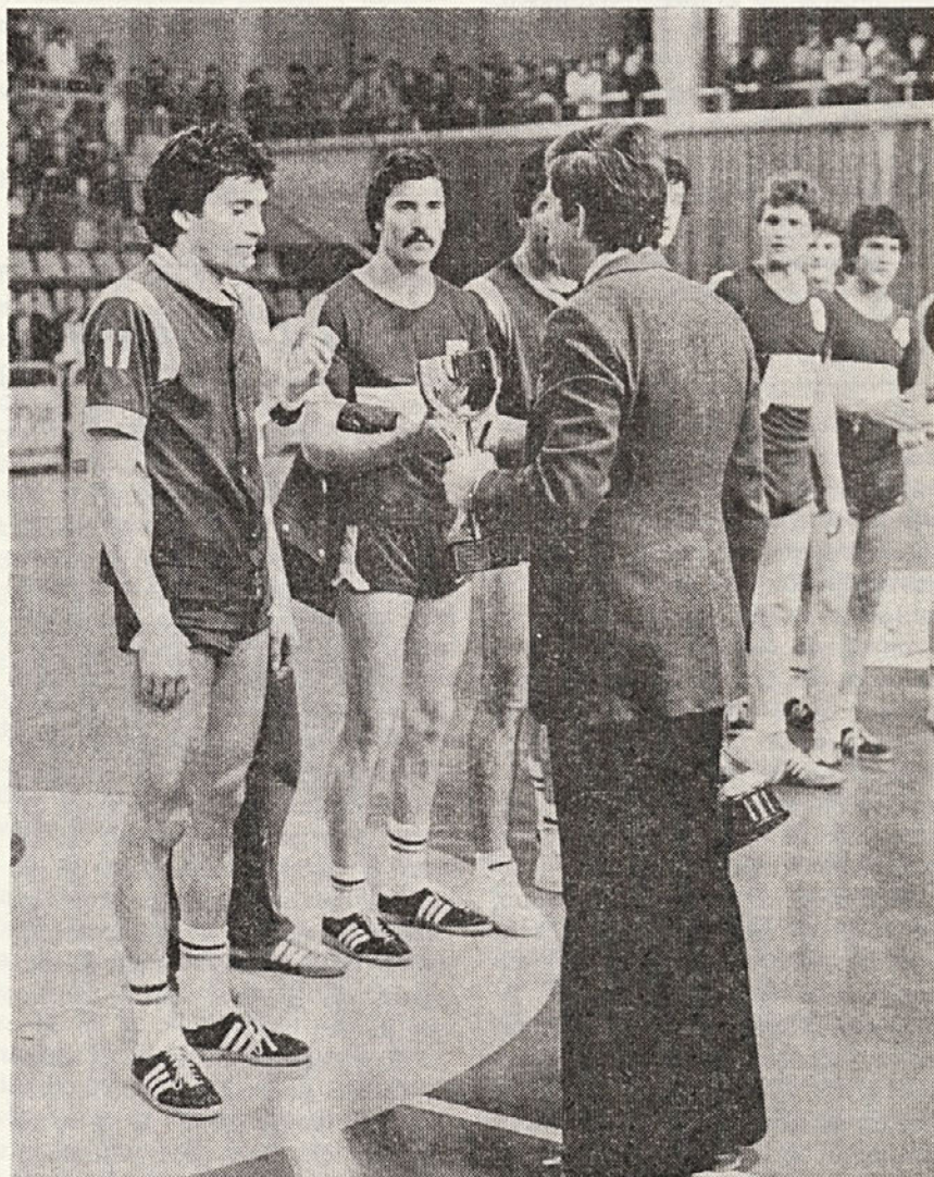
Rokometna ekipa AERO Celje je z zmago proti Kolinski Slovan postala pokalni prvak Slovenije

Posamezne športne sekcije pa se udeležujejo tudi raznih prijateljskih srečanj, ki pa jih v programu ne moremo predvideti. Tako bo npr. že junija srečanje naših nogometašev z nogometaši slovenskega atletskega kluba v Celovcu.