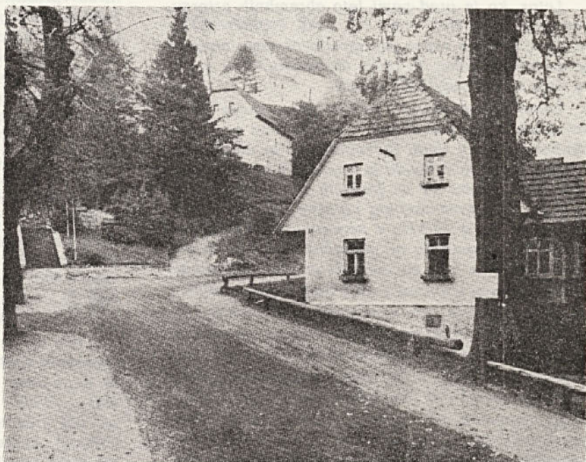
V tem kraju, Duhu pri Ostrem vrhu, bo letos, 4. julija, osrednja slovenska proslava

Pomlad 1919. Končala se je prva svetovna vojna, to je bil čas velike gospodarske krize. Milijoni brezposelnih po svetu so iskali delo, špekulacija je cvetela, cene osnovnim živilom so se dvignile za 300—400 odstotkov. Delavstvo je živelo v obupnih razmerah. Njihova bivališča niso ustrezala niti osnovnim higienskim pogojem.