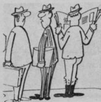
Ali se je maskiral? Ne, pri njih žena nosi hlače!