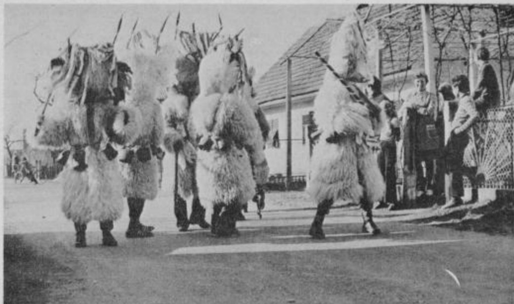
Koranti v svoji rojstni vasi, v Markovcih, sredi mladih občudovalcev, ki bodo kmalu tudi sami koranti. „Dežela kurentov“ vendarle skrbi za svoj podmladek.