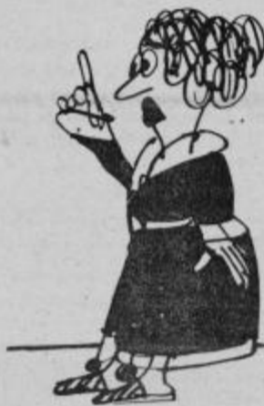
Ce bi ocenjevali ljudi po višini davčne napovedi...