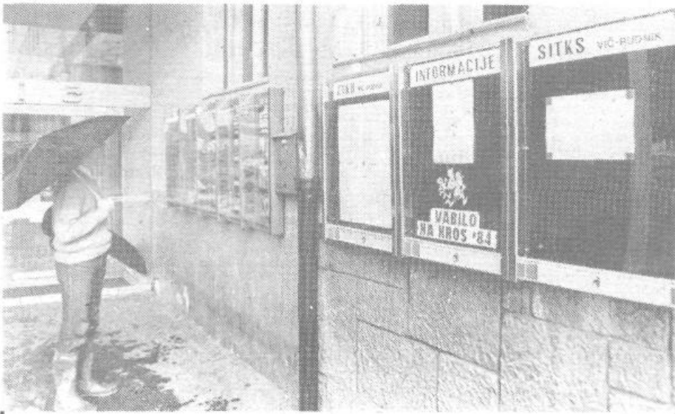
V tej vitrini, postavila jo je občinska ZTKO ob vhodu v kino Vič, bodo rekreativci in ljubitelji športa odslej lahko redno prebirali obvestila o rekreativnih aktivnostih in rezultatih.