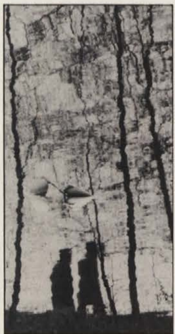
Tihožitje ob celovškem centru

Upodabljanje-fotografiranje-okolice začasnega ali stalnega bivanskega in življenjskega okolja sodi prav tako med stalnice Wiplingerjevega umetniškega izražanja kot pesniško reflektiranje o holocaustu, judovskih pokopališčih in sprehodih ob Vrbskem jezeru. Pretekli teden se je v celovski hiši umetnikov začela razstava Wiplingerjevih fotografij-zrcalnih slik, ki jih je posnel ob Sotnici, celovškem Lendkanalu in Vrbskem jezeru. Najmočnejše in tudi najbolj žgoče sporočilo te razstave pa je brezdvomno fotografov klic v sili za pomoč obubožnim bolgarskim književnikom.