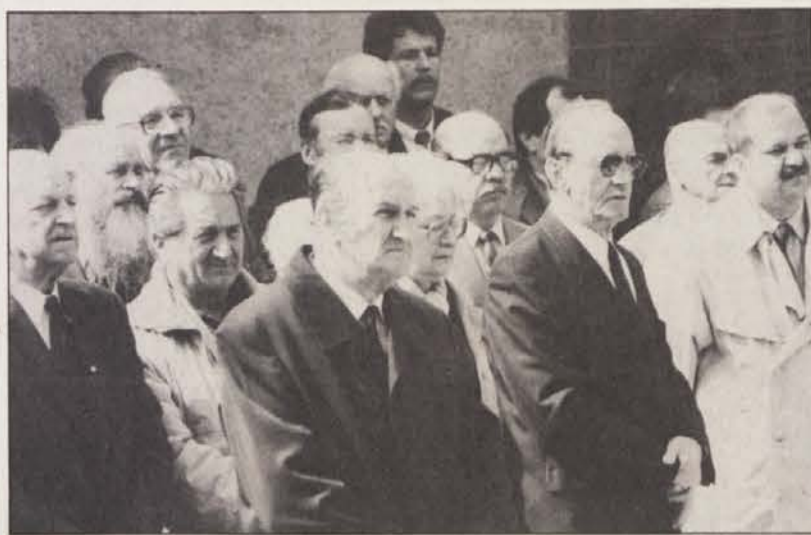
Poklonili so se padlim borcem za svobodo