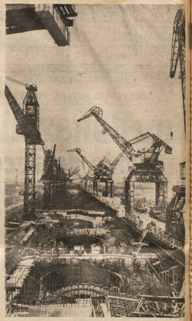
Cez mesec dni bodo otvorili v Sovjetski zvezi novo električno centralo. Nova centrala, ki se nahaja v Kujbisevu je največja na svetu. Proizvajala bo letno 10,5 milijard kilovatin električne energije.

Cez mesec dni bodo otvorili v Sovjetski zvezi novo električno centralo. Nova centrala, ki se nahaja v Kujbisevu je največja na svetu. Proizvajala bo letno 10,5 milijard kilovatin električne energije. Električna centrala, ki so bile zgrajene v SZ v teku pete petletke, proizvajajo letno 78 milijard kilovatin električne energije!