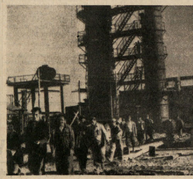
Naprave čistilnice petroleja v Cerriku (Albanija)

strije. Uzbekistan je postal za časa sovjetske oblasti veliko tekstilno področje. V republiki so bili zgrajeni in se gradijo industrijski veličani, ki proizvajajo blago ne samo za Uzbekistan, marveč tudi za ostale sovjetske republike. Tekstilni kombinat v Taškentu, ki ga danes še razširjajo, proizvaja več tekstilnega blaga kot vrsta vzhodnih dežel skupaj. V republiki obstajata druga dva veličana: svilarna v Margelanu in kombinat v Fergani. V peti petletki se je poudarila proizvodnja svilenega blaga, za 50% pa se je povečala proizvodnja bombažev. V novi petletki bodo razširili kombinat v Taškentu, preuredili svilarno v Margelanu, svilarno v Samarkandi in druge tovarne