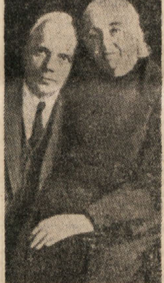
Béla Bartók z materjo

Pred desimi leti je umrl v pregnanstvu veliki madžarski glasbenik in skladatelj Béla Bartók, čigar odlični doprinos v obnovi moderne glasbe je znan po vsem svetu. V glasbenem življenju se je mladi Bartók uveljavil v pr-