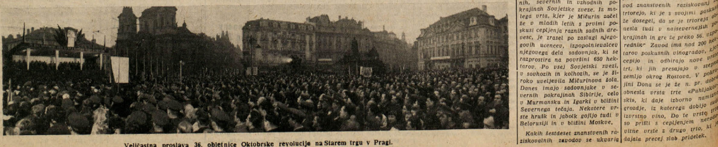
Velicasta proslava 36. obletnice Oktobrske revolucije na Starem trgu v Pragi.

mokratičen in človekoljuben. Svojo domovino, takrat zatirano za Rothrujo je zapustil, in je v svojih nesmrtnih delih, ustvarjenih v pregnanstvu, izrazil svojo ljubezen do narave, do človeštva in otrok v prerokovnanju novega življenja v miru in blagostanju. V svojem delu za otroke «Konarjeva izpoved» je povsem izraženo njegovo naročilo in njegova ljubezen do življenja. Njegova važnejša dela so «Medvedov ples», v katerem je čudovit do potankosti opisal madžarsko pokrajino, značaj in življenje