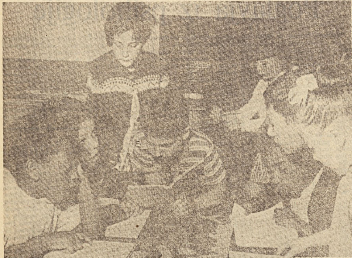
V prejšnjem šolskem letu je bilo v neki angleški osnovni šoli 65 % otrok emigrantov in od tega večina sploh ni govorila angleško. So različnih starosti in prihajajo v vse razrede osnovnih šol. Nekatere kar vključijo v redno šolo, za druge pa imajo posebne razrede. Čim mlajši je otrok, tem prej ga vključijo v redno šolo. Na sliki: trije Grki, deček iz Jamaike, Italijanček, deček iz Zahodne Indije in Turčije