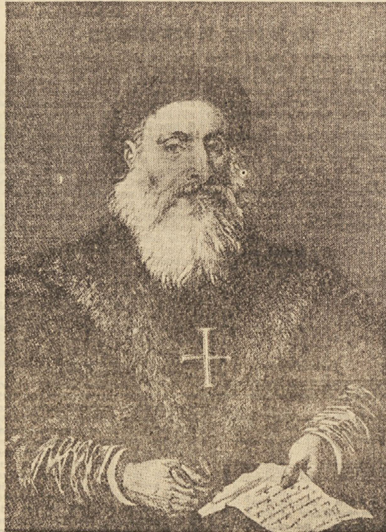
VASCO DA GAMA

Tako se je tudi rodila misel, da je Afriko mogoče na jugu objadrti in nato v vzhodni smeri priti v Indijo. Prvo, namreč objadrti afriško celino, je uspelo portugalskemu kapitanu Bartolomeu Diasu že leta 1487, šele deset let pozneje, in sicer 8. julija 1497, pa je iz lizbonskega pristanišča pod poveljstvom plemiča Vasca da Gama odrinilo majhno ladjeve z izrecno nalogo, naj odkrije pomorsko pot v Indijo. Vasco da Gama bi se moral pravzaprav svojim predhodnikom, ki so doživeli poraz, in njihovim izkušnjam zahvaliti za svoj uspeh. Vsekakor pa gre njemu zasluga, da je prvi opravil to, za tiste čase skrajno nevarno in tvegano pot. Bil je prvi Evropejec, ki je prišel v neposredni stik s trgovino v indijskih pristaniščih. Po nekaj letih surovega vojskovanja pa so Portugalci iz Indije docela izrinili arabske trgovce in reka bogastva se je brez posrednikov začela izliti v zahodnoevropska pristanišča. Sredozemska trgovska in pomorska mesta so jela propadati, svet je postal večji, Evropa pa bogatejša na račun prebivalstva v novoosvojenih deželah. Odkritje pomorske poti v Indijo pomeni rojstvo evropskega kolonializma.