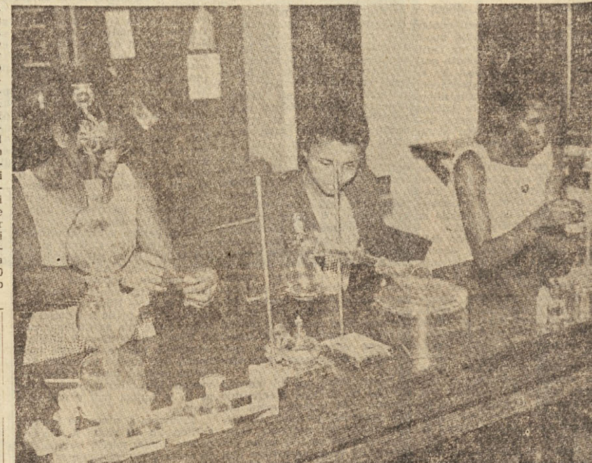
V kemijskem laboratoriju neke ganske šole

Duševno zaostalim otrokom posvečajo v Angliji vso pozornost, zlasti imajo veliko ur telesne vzgoje. Učijo jih tudi plavanja. — Pa tudi v Rusiji se zelo zavzemajo za duševno zaostale otroke. Učitelje posebej pripravljajo za take šole, tudi plače imajo višje. Posebno težke primere (idioti) v posebnih zavodih usposobijo za kakšno koristno delo in ni nobenega problema o njihovi bodoči zaposlitvi