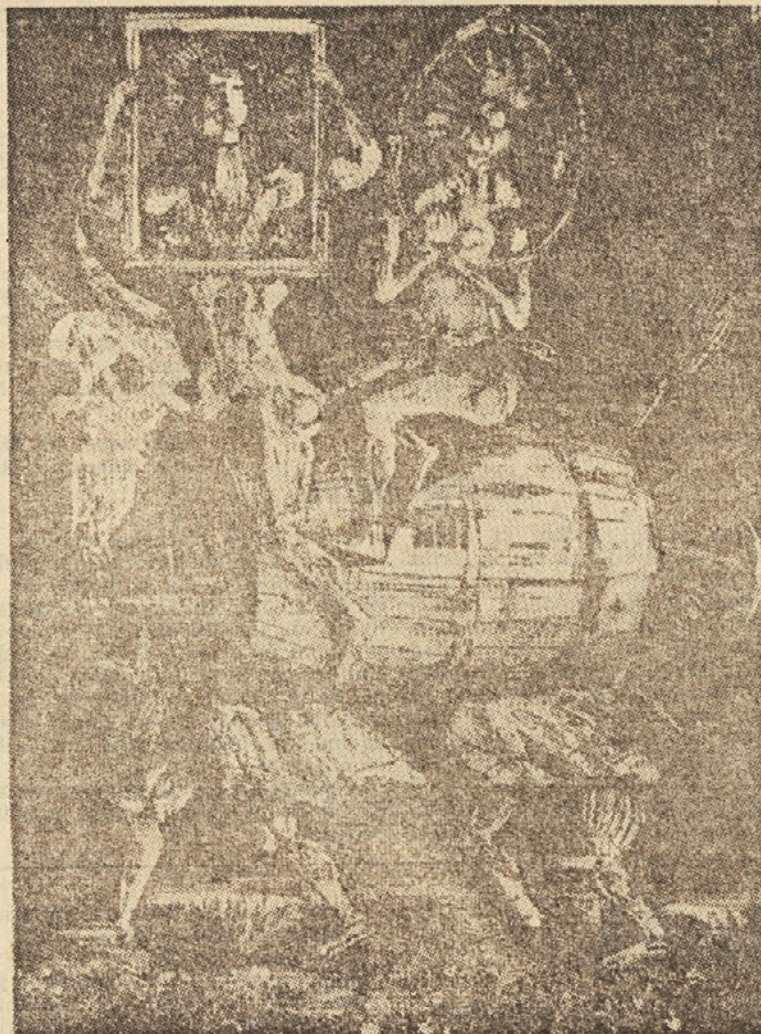
Oj ti pust, ti čas presneti...

bro in slabo stranjo. Tako pravi tudi naš priljubljeni Frane Milčinski- Ježek. Naprosili smo ga, naj nam pripravi oddajo o lepem vedenju. Povedal nam bo v šali, duhovito, da mu bomo zares vsi prisluhili in si potem marsikaj zapomnili.