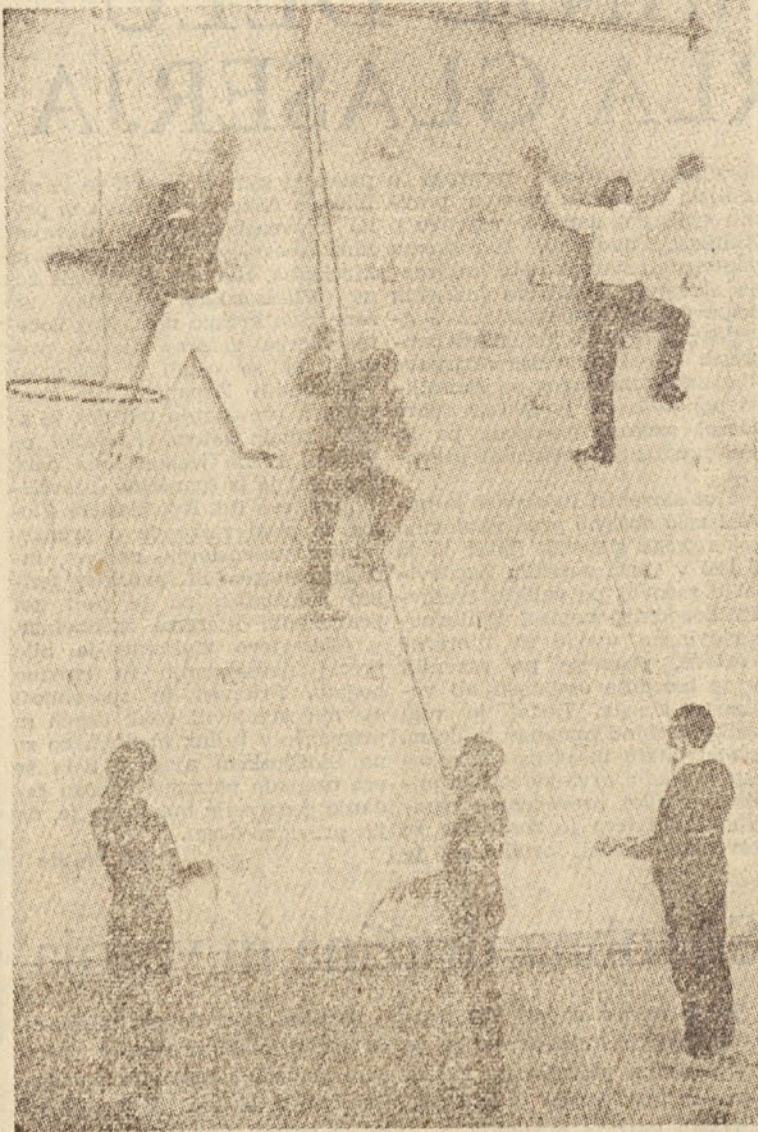
Solska telovadba je včasih pomenila samo obvezno šolsko uro. Vaje so bile stalne in stare, odvisne tudi od letnih časov. Isto trpljenje je šolska telovadba pomenila tudi telovadnim učiteljem. Nekateri trpijo še danes, kajti med njimi je še vedno nekaj nesportnih tipov. (Tako pravijo v Angliji, od koder je tudi gornji posnetek plezalne vaje v neki šoli v Birminghamu)