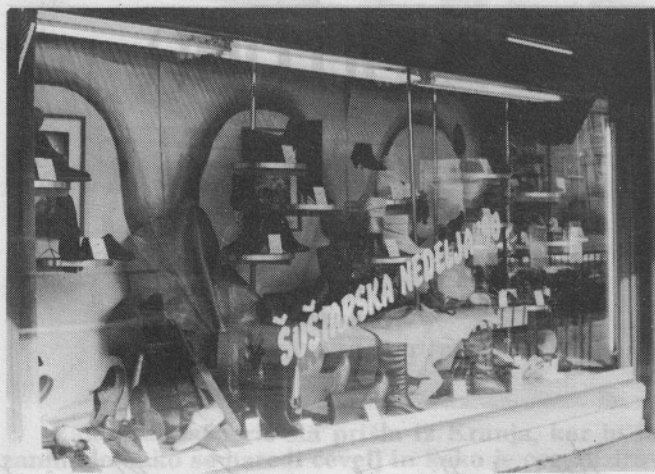
V trgovini Deteljica so se skrbno pripravili na ŠUŠTARSKO NEDELJO. Tudi izložba je pritegnila marsikaterega kupca