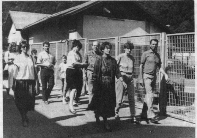
Dan odprtih vrat