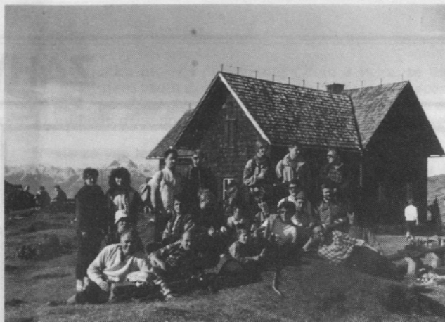
Z izleta na Ratitovec