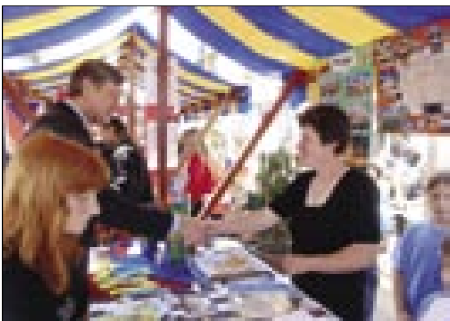
Našo stojnico je obiskal tudi predsednik R Slovenije dr. Danilo Türk

prireditev je organiziral Evropski socialni sklad, v sodelovanju s Šolo za ravnatelje.