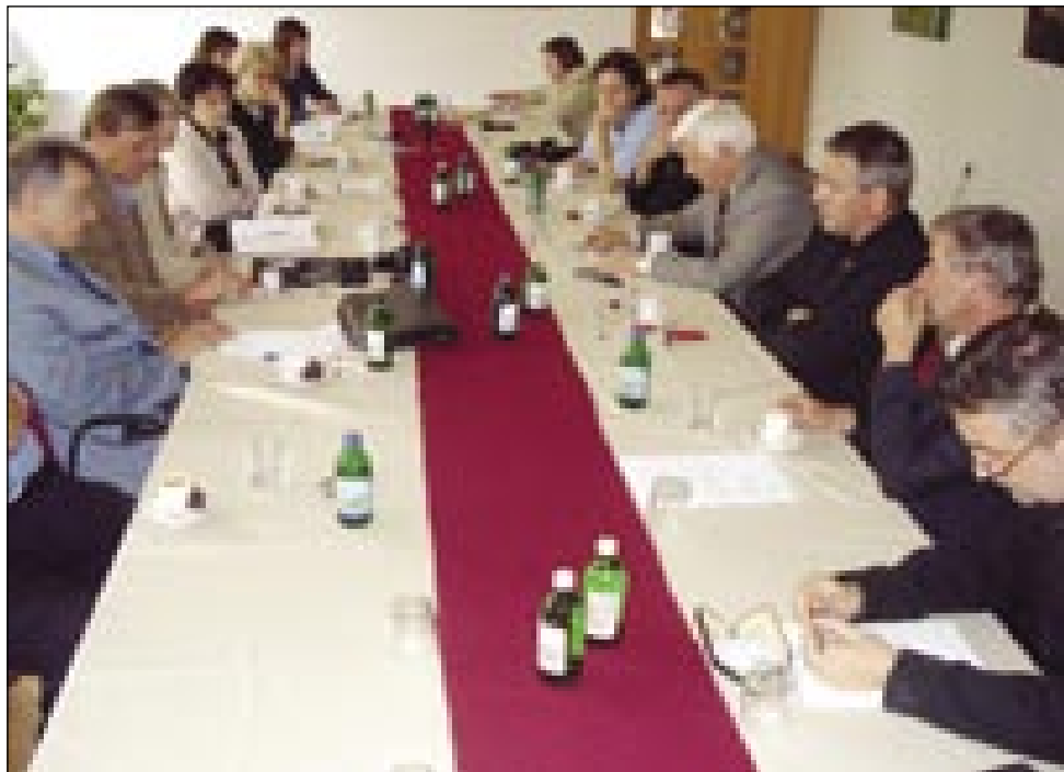
Udeleženci sestanka so se pogovarjali o možnostih za izboljšanje pretoka informacij in medijskega pokrivanja življenja in delovanja slovenske manjšine v Porabju