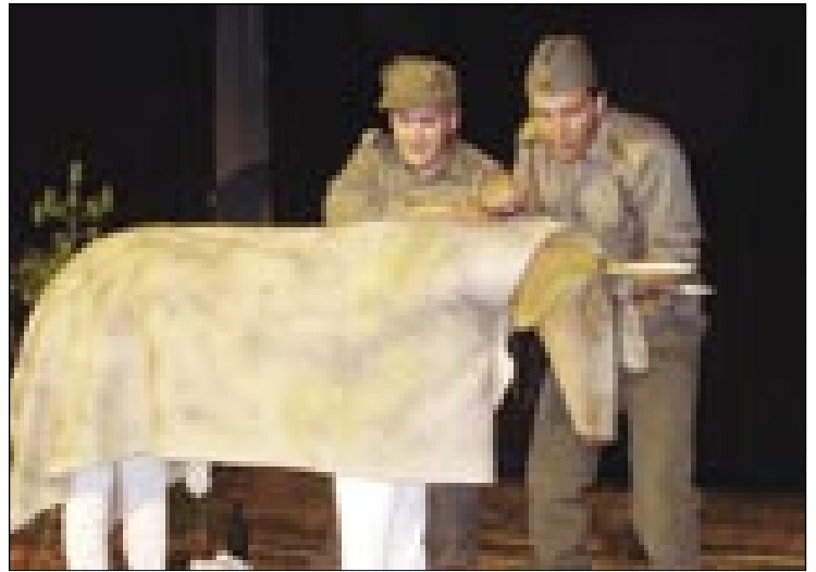
Krava, stera je vujšla prejk granice z Lajošom pa stari komandir

V predstavi je proslava tō, kak so go meli za den graničarov (határórség napja) inda,