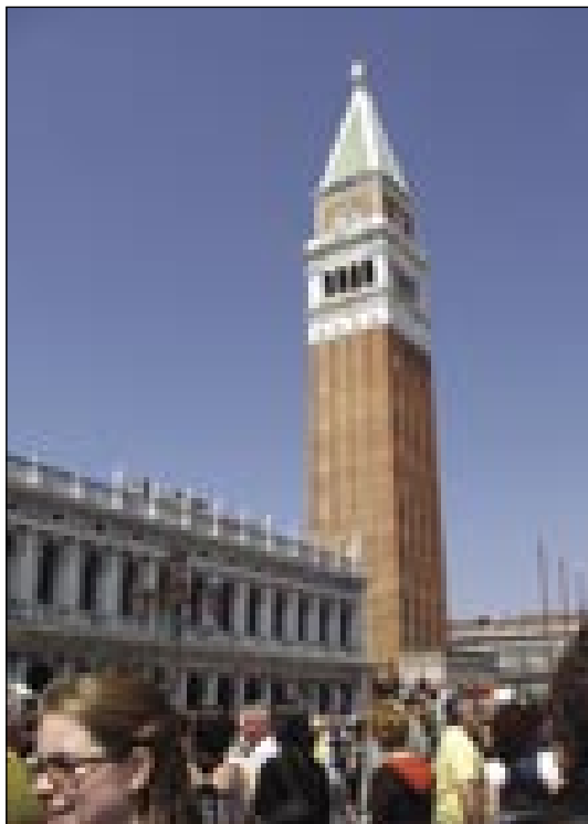
Zvonik, ki velja za najvišjo stavbo v Benetkah