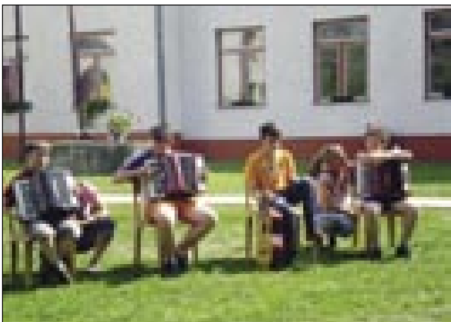
Učenci šole so zaigrali na raznih inštrumentih

čke, ki so jih morali drug drugemu z žebeljem preluknjati. S tem se je tekmovanje kon-