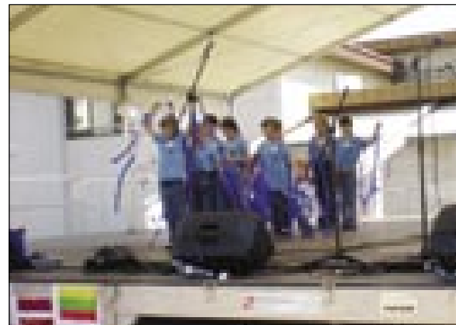
Naši učenci na odru

smo razne plakate, na katerih so obiskovalci lahko videli in brali o zemljepisu, o umetnosti Češke, o znanih osebah te države. Naredili smo zastave in znamke. Na znamke smo