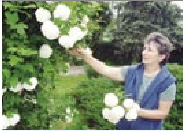
Margita ma trno rada rauže

Če se v Otkovce pripelamo, na levi strani pred bautov so eden za drugim nauvi rami, šteri so se deset, petnajset lejt nazaj zidali. Leko povejmo,