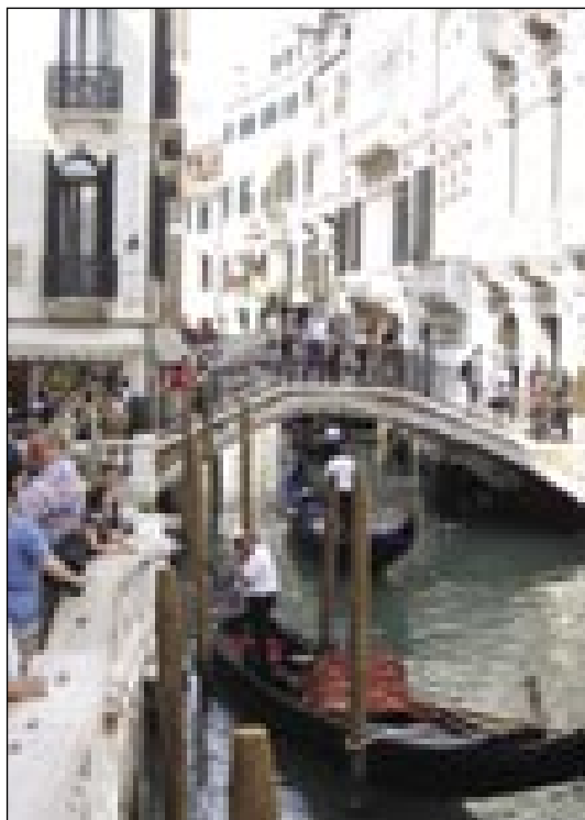
Benetke so mesto mostov in kanalov

ča, da smo na najbolj romantični točki na svetu. Prva pot nas je vodila do trga sv. Marka, kjer na milijone tujih in domačih obiskovalcev že ne