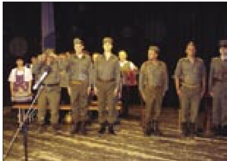
Sodacke pa vaščani na proslavi

(büszké) na tau, ka so bili v vojski. Dja sam tō biu šče v jugoslovanskoj vojski. Vsi so pripovedjali nikše hece, ka so se v vojski vsigdar norosti delale. Tē sam si dja tau malo zapomno pa sam si par stvari zapiso, nastala so nekatera dejanja (jelenet), vcūj sam djau šče eno de-