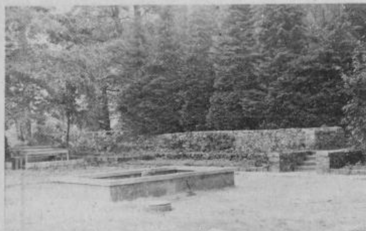
Nov vodomet v neurjenem okolju.

Pred kratkim so v središču Oplotnice zgradili lep vodomet. To je rezultat večmesečnih razmišljanj, kako izkoristiti prazen prostor v osrčju krajevnega parka. Zgraditev vodometa je bila gotovo dobro zamisljena in uspešno izvedena akcija. Vodomet sedaj deluje. Ob težavah z vodo pa „oživi“, če uspeš odpreti pipo.