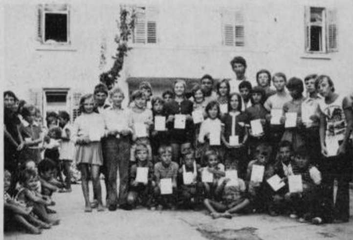
Na plavalnem izpitu prejete diplome

„Sam sem se prijavil za počitnice v Biogradu, seveda z odobritvijo staršev. Pisal sem jim že, da nam je