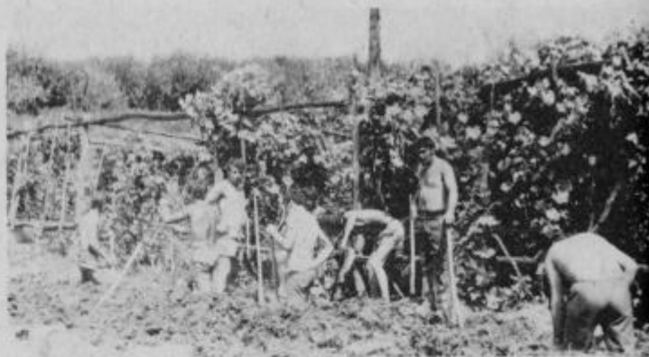
Mladi iz Studenic pri kopanju jarkov okoli doma kulture

Člani mladinskega aktiva v Studenicah pri Poljčanah so letošnje počitniške dneve preživeli predvsem v delovnem okolju. Ker je obdobje letnih počitnic čas, ko se mladi najraje sestanejo v večjem številu, so sklenili del svojega letošnjega akcijskega programa izvršiti v tem času. Kljub temu, da so mnogi med njimi nekaj svojega počitniškega razpoloženja posvetili obmorskim ali planinskim krajem pa so takoj po vrnitvi prišli za delo.