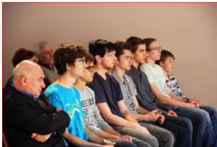
Iz sprejema uspešnih mladih šahistov Šahovskega društva Ptuj pri županu MO Ptuj v Mestni hiši, 17. septembra.