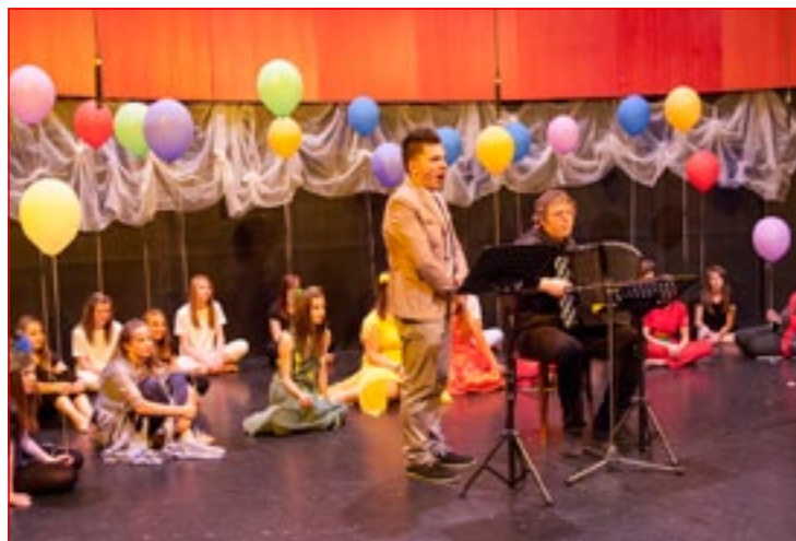
Iz glasbene predstave Rainbow

Novost tega šolskega leta je tudi Vokalna skupina Allegro, ki medse vabi dijake in študente, ki bodo preko študija klasične zborovske literature, rock, pop in jazz skladb,