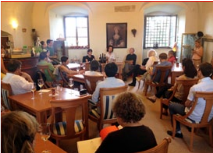
Na fotografiji zelo dobro obiskana Huda pokušnja!, ki je potekala v Kavarni na ptujskem gradu. Sicer pa sta Zasebno branje in Huda pokušnja! najbolj privlačna dogodka poleg Velikega pesniškega branja.

pesniki, udeleženci slovensko-švedske prevajalske delavnice. »Najbolje obiskana so bila velika večerna branja na Vrazovem trgu, kjer je nastope pesnikov, ki jim je vsak večer sledil tudi koncert, poslušalo med 500 in 700 obiskovalcev, vseh dogodkov pa se je po podatkih, ki so jih zbrali organizatorji iz založbe Beletrina, udeležilo več kot sedem tisoč ljudi,«