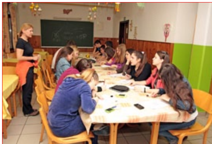
Pri pisanju spisa o doživetjih na Ptuj

slovenski jezik in slovensko kulturo, otroke v teh društvih pripeljale na daljši izlet v Slovenijo. Lani so bivali pri družinah v Radencih ob Kolpi, kjer so spoznavali deželo Petra Klepca. »Letos smo spoznavali Ptuj in deželo kurentov. V Slovenijo smo pripeljali 44 otrok, starih od 7 do 18 let. Ob prihodu so nas pričakali dijaki z Gimnazije Ptuj ter učenci osnovnih šol Breg in Dornava. Naši otroci so prvo noč prespali pri njihovih družinah, naslednji dan pa obiskali pouk na njihovih šolah, da so začutili slovensko šolo, videli, kakšen je šolski program, in seveda, da so spoznali svoje vrstnike. Kasneje smo se nastanili v domu Štrk v Spuhlji. Tukaj smo za otroke pripravili