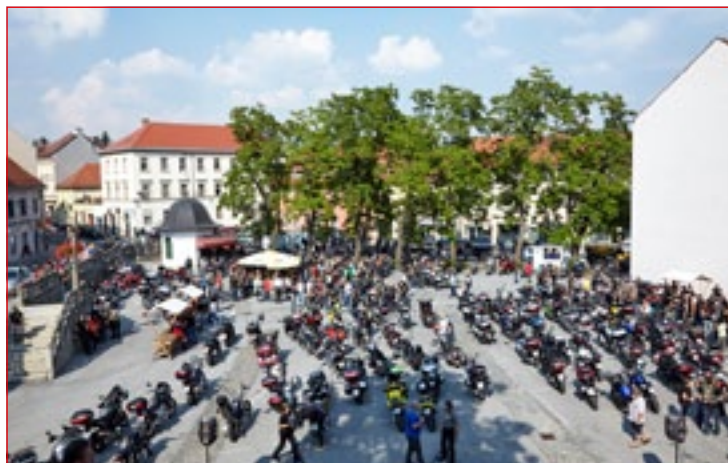
Iz mednarodnega srečanja motoristov na Mestni tržnici

V počastitev občinskega praznika so pripravili še 13. tradicionalno tekmovanje članov Zveze veteranov vojne za Slovenijo v lovu rib s plovcem, 36. Ptujski padalski pokal v skokih na cilj, 5. odprto prvenstvo Ptujja v golfu, dan spoštovanja vrednot NOB na Ptujskem, pohod na najvišji vrh ptujške občine in mednarodno karting dirko za državno in pokalno prvenstvo RS v Hajdošah.