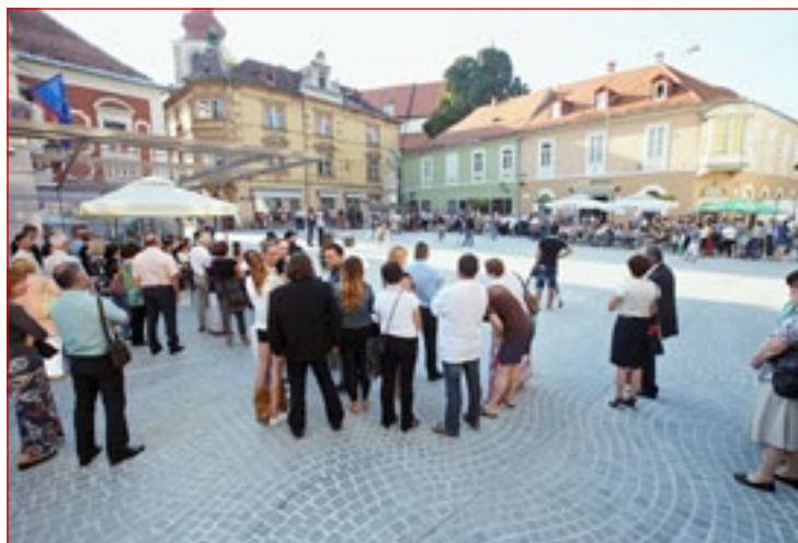
Slovesnost ob odprtju prenovljenega Mestnega trga

Ob občinskem prazniku so odprli prenovljen Mestni trg. Z njegovo obnovo so začeli v začetku marca letos, v okviru del pa so zamenjali komunalne vode in priključke v objekte, dogradili plinovod ter položili vode za javno razsvetljavo in komunikacije. Izvajalec del so bile Javne službe Ptuj, d. o. o., s podizvajalci. Projekt so v času nastajanja usklajevali z Zavodom za varstvo kulturne dediščine Slovenije, dela pa so potekala ob prisotnosti arheologov. Ti so sproti dokumentirali staro kanalizacijo, ki je v delu na Slovenskem trgu grajena iz peščenca in opek, v Murkovi ulici pa samo iz opek. Po pridobljenem gradivu so na zahodnem delu Murkove ulice ostaline iz rimskega obdobja, vse drugo pa je iz mlajših obdobj od 17. do 20. stoletja. V obdobju rimskih časov je bilo na območju Mestnega trga pristanišče, kar so potrdili tudi izsledki georadarja, v srednjem veku pa je bila tam živinska tržnica. Zgodovinsko dokazano prisotnost tekoče vode in smeri rimskega pristanišča ponazarja tlakovanje v vzorcu valovnice, izdelano iz