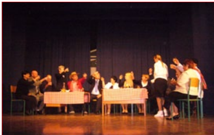
Igralko in igralce dramske sekcije Kulturnega društva Grajena, ki so letos igrali v predstavi Svečana večerja v pogrebem zavodu.

»Svoje igralko in igralce zelo dobro poznam kot osebnosti, saj