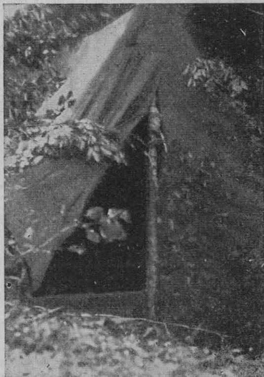
Naši najmlajši si sami postavljajo domove

Himalaja: (Karakorum). 1878. Grazioli; 1908. Cesare Calciatti, 1909.