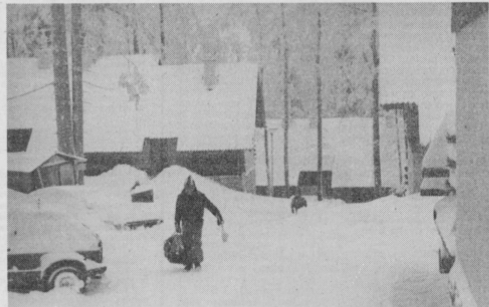
Naselje počitniških hiš na Pungartu: poleg sedanjih 450 naj bi v naslednjih treh letih tam zgradili še 600 postelj v počitniških hišah in 400 v apartmanih v skupnem objektu.

Odkar se je razširilo naselje počitniških hišic na Pungartu, imajo na Kopah precej težav s pitno vodo. Pozim jo stalno zmanjkuje, zato jo morajo dovažati v cisternah iz doline. Takšni prevozi pa so precej dragi, saj stane kubični meter vode kar 6.000 dinarjev. Gradnja novega vodovoda je zato toliko bolj nujna stvar.