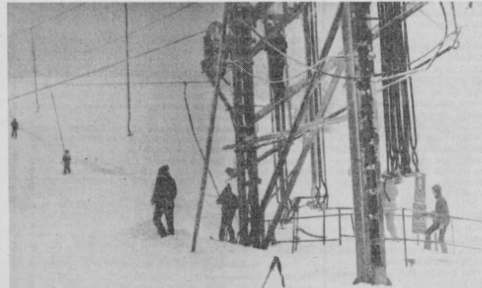
Vlečnica na Pungartu: prihodnje leto jo bodo zamenjali z novo, dvojno vlečnico. Sicer pa so smučišča na Kopah, odkar so kupili nov teptalec snega, dobro urejena, letos pa so večji del smučarske sezone delali tudi vlečnici za povezavo med Pungartom in Kaštivnikom.

Svetloba jima je zableščala v oči, dobro videla kdo vse ju je zunaj.