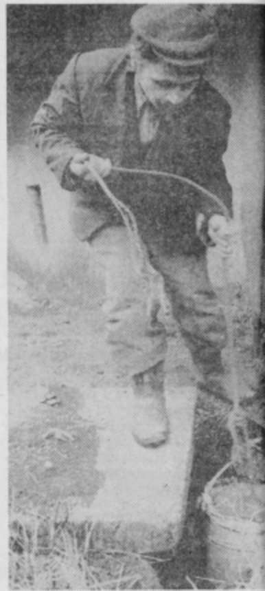
Tudi z vodo so težave. Po kapnicodan, živini je treba postreči tudi z treba prinesiti v hlev.