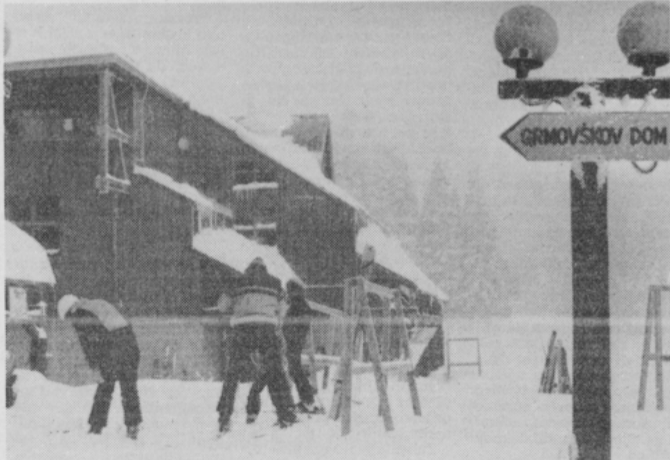
Prizidek Grmovškemu domu: lep, a nefunkcionalen.

Merx je pred petimi leti dobil v upravljanje sorazmerno dobro urejena smučišča s programi za zahtevnej-