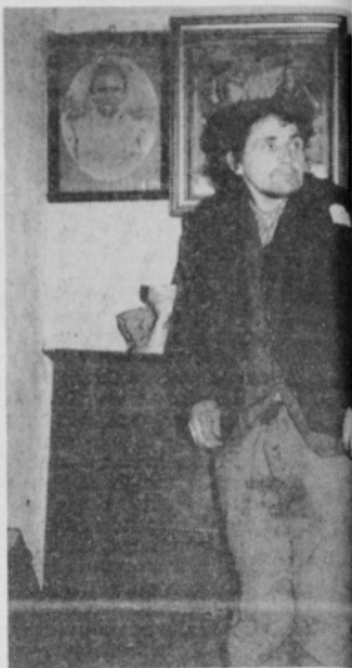
Ko bo katera prišla v hišo, si bo o skrbno hrani za prav posebne prilike.