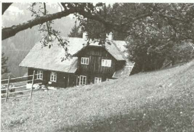
Stara ojstriška šola