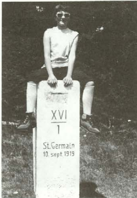
Državni mejnik na Košenjaku

Kmetje so dobro kmetovali in gojili celo semenski krompir. Nato pa so se mladi začeli naglo odseljevati.