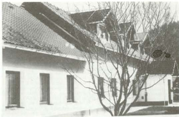
Dom za cerebralno paralizo