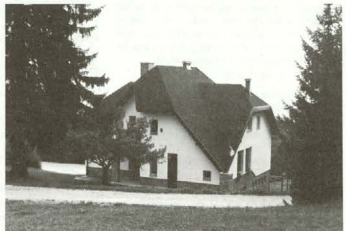
Nova ojstriška šola