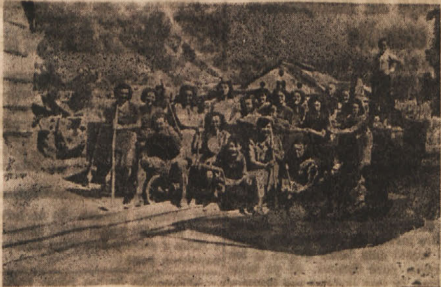
Mladina okraja Bruševše

Pošteno delo v rudniku pa je nalletelo na težkoče. Takoj na prvi pogled že nevesče oko lahko ugotovi, da je idrijski rudnik zastarel industrijski aparat izpred let prve svetovne vojne. To nam jasno priča, da fašistična Italija ni vložila niti pare za renoviranje zastarelih naprav, ampak