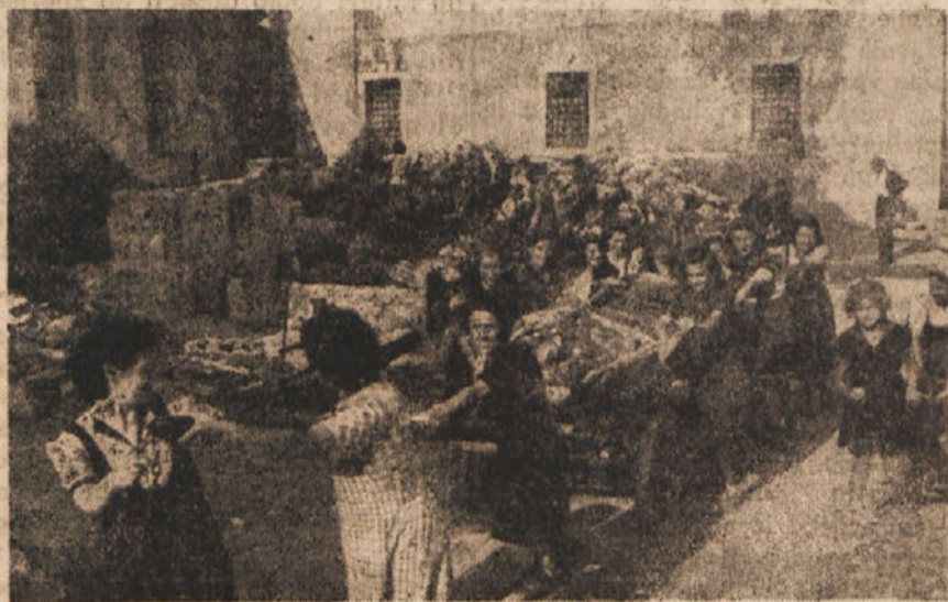
Pridne Idričanke pri čiščenju rodnege mesta ne poznajo odmora

ali nedelavnosti odbora. Samo tako, da zagovarja odbor slednjo, v programu predvideno stvar, ki ni bila dovršena v določenem času, je možno tudi pregledati v koliko podpira zbor volilcev svoj NOO. Ni namreč dovolj, da izvolimo odbornike in potem čakamo, kaj bo izvršenega, ampak, da ta odbor podpremo s svojim delom, s tistim poštenim in odkritim polemom, kakor so zbori volilcev podpirali NOO v dobi osvobodilne borbe.