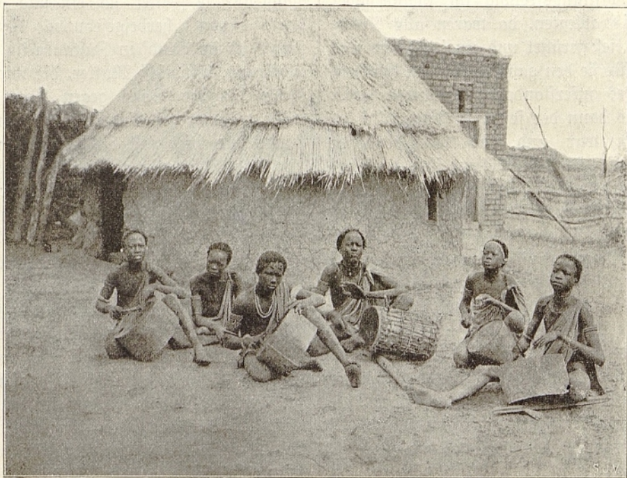
Schillukburichen mit ihren Trommeln.

dessen Türen und Fenster geschlossen waren, der feierliche Akt der Taufe mit ihren mannigfachen, erhebenden Zeremonien. Anwesend waren, wie erwähnt, nur wir Missionäre und die Missionschwester, weil es dazumal im Interesse der beiden Katechumenen ratsam schien, wie in den ersten christlichen Zeiten, die Taufe einstweilen noch geheim zu halten. Wir hatten