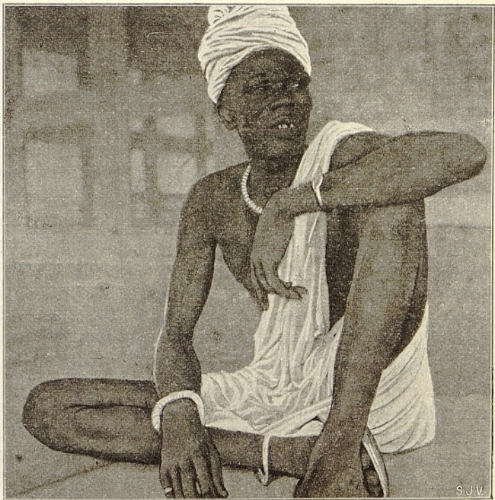
Der verstorbene Großhäuptling von Tanga.

ganz neuer Handelsartikel für die Romadengebiete aufschloß, der einen guten Gewinn versprach, nämlich der Kern von der Frucht der „Dumpalme“. Dieser schlanke Baum, dessen riesige, fächerartige Blätter gewaltig im Winde rauschen, besaß lange, lange Zeit hindurch für die Beduinen nur recht geringen Wert. Meist verwendeten sie