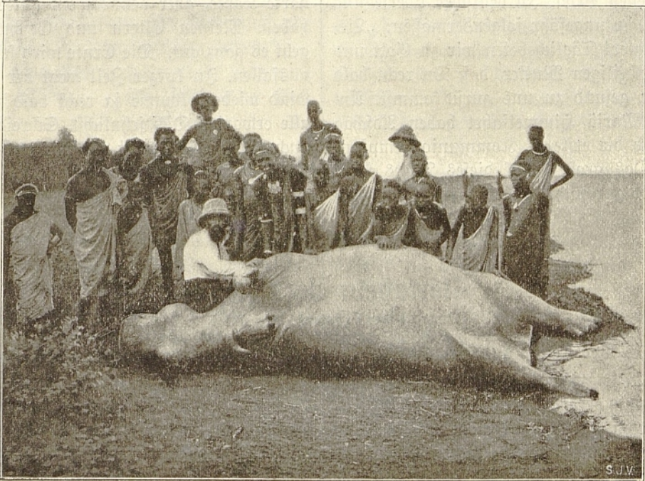
Huf der Nilpferdjagd.

Es ist dem hier am häufigsten vorkommenden Malariafieber eigen, langsam, aber desto sicherer die Kräfte des Menschen zu schwächen und zu untergraben; da bildet in den meisten Fällen nur ein schleuniger Klimawechsel die einzige sichere Rettung. So mußte denn auch ich für einige Monate von meinen lieben Schilluk und dem bereits liebgewonnenen Schilluklande