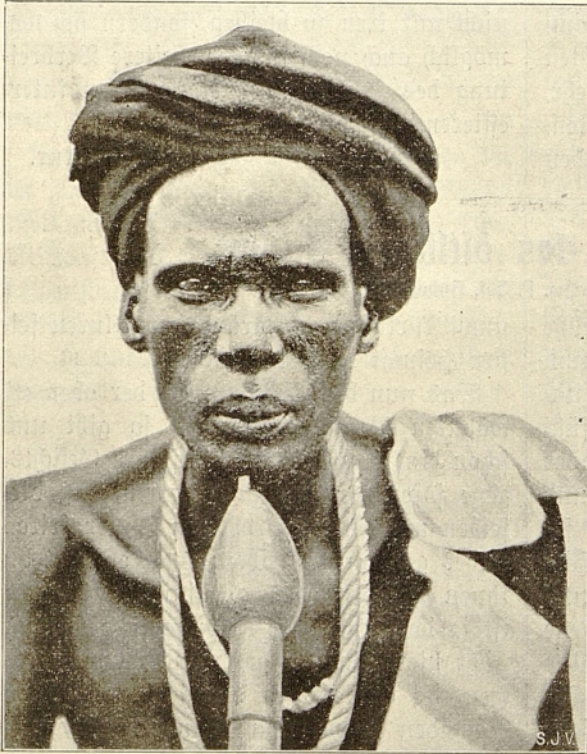
Der neue Großhäuptling von Tanga.

Diese Eindringlinge werden gegen 1900 v. Chr. und später in den Hieroglypheninschriften öfters erwähnt und mit dem Namen „Kuschiten“, d. h. Leute von den Bronzege Gesichtern, bezeichnet. Gegen 1570 v. Chr. geschieht zum erstenmal auch von jenen Nomaden Erwähnung, welche zwischen dem Nil und dem Roten Meere wohnten; sie werden hier „„Auti““ genannt d. h. Gebirgler. Diese Erwähnung geschah gelegentlich eines Raubzuges, den sie ins Niltal gewagt hatten. Solche Einfälle wiederholten sich im Laufe der Zeit. Auch die Arbeiter, welche in den königlichen Goldminen gegen das Rote Meer hin beschäftigt waren, hatten unter diesen Gebirgsbewohnern vielfach zu leiden, weshalb die Herrscher von Ägypten gegen sie und ihre Stammesbrüder verschiedene Feldzüge unternahmen, von denen uns zahlreiche Inschriften in den Tempeln, sowie auf den Grabdenkmälern hervorragender Persönlichkeiten, die an solchen Unternehmungen teilgenommen hatten, zu erzählen wissen.