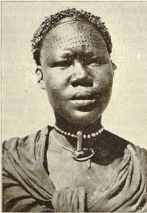
Schillukfrau. (P. Born.)

Da der Hase sah, daß auch der Elefant besonderen Gefallen an seinem Redo-Schmucke fand, so sagte er ihm eines Tages: