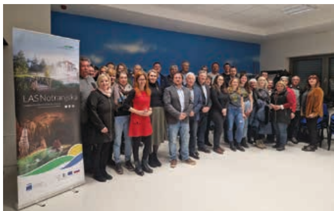
Skupščina LAS Notranjska

Članstvo LAS je prostovoljno in odprtega tipa, kar pomeni, da se lahko zainteresirani kadarkoli vključite. Za več informacij o vsebinah, delovanju in povezovanju nas lahko pokličite ali se oglasite na OOOZ Cerknica.