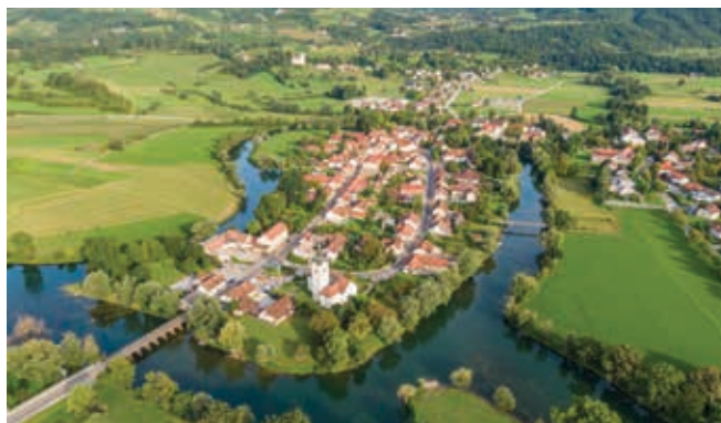
Projekt je sofinanciran s pomočjo Evropskega sklada za regionalni razvoj, Ministrstva za gospodarstvo, turizem in šport ter SPIRIT, Javna agencija.

OOZ Logatec bo v okviru projekta SPOT Svetovanje Osrednjeslovenska regija tudi letos organizirala strokovno ekskurzijo za (potencialne) podjetnike. Tokrat se bomo odpravili na Dolenjsko. Spoznali bomo izzive in priložnosti poslovanja na tem območju. Obiskali bomo nekaj uspešnih podjetij, priložnost pa bo spoznati tudi tamkajšnjo kulinariko ter vinski turizem. Vabilo s podrobnejšim programom bo objavljeno na spletni strani OOOZ Logatec. Udeležba je brezplačna. Obvezne bodo predhodne prijave.