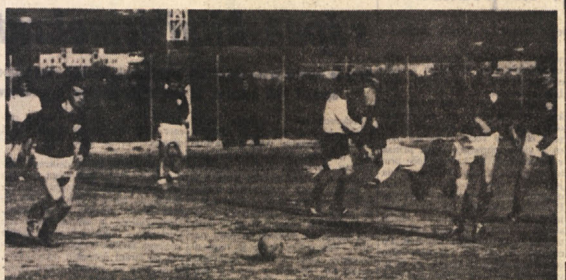
V tekmi Primorje B - Esperia je padlo kar šest golov: na vsaki strani po trije