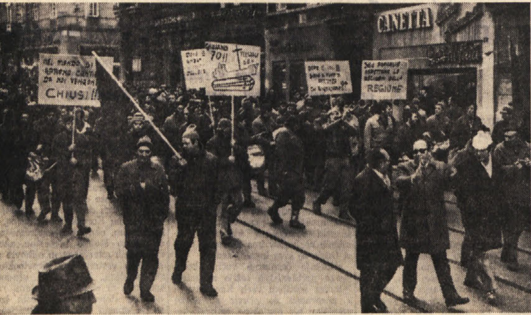
Sprevod delavcev Navalgiuliano iz Milj po korzu

Razgovor z odbornikom za industrijo Dulcujem - Morda rešitev za tovarno srajc, ki je zasedena že 28. dan - Stavke in skupščine tržaskih delavcev proti sodni farsji v Burgosu