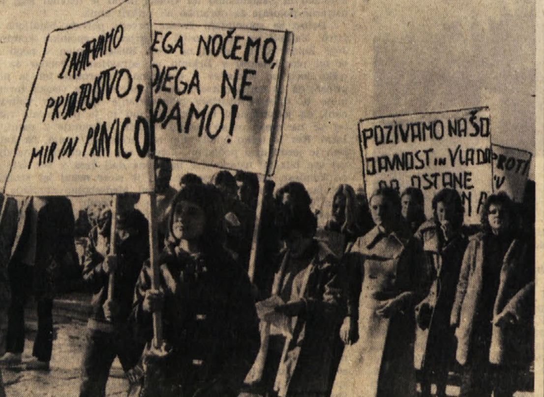
Sobotna manifestacija v Piranu