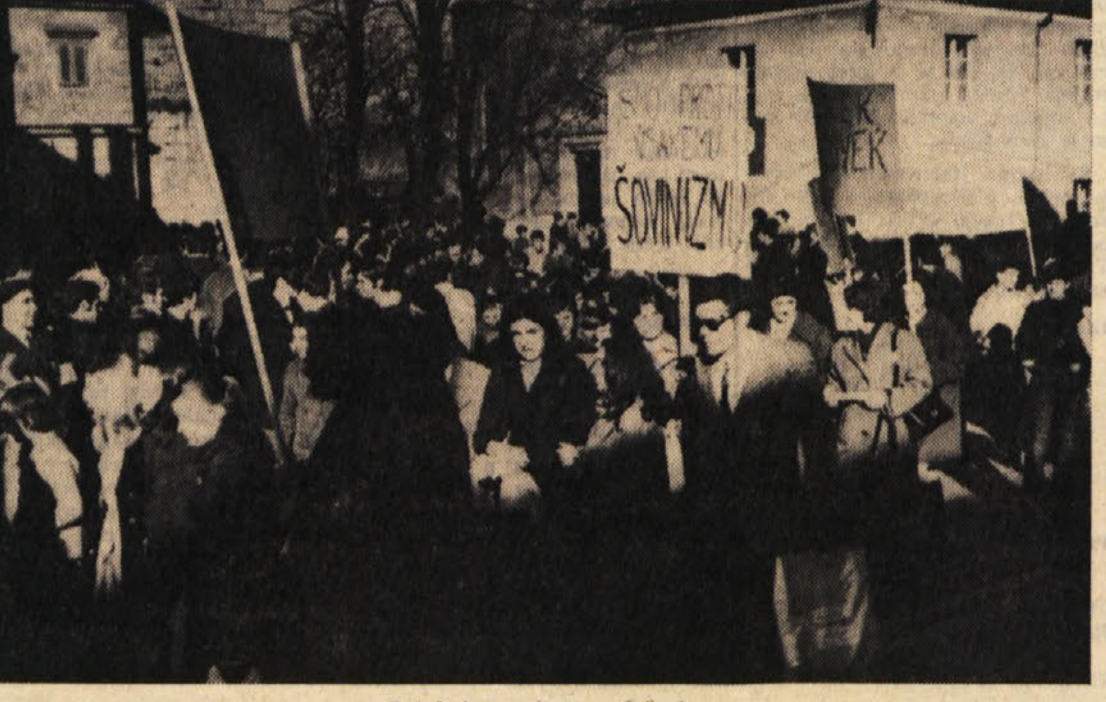
S sobotnega shoda v Sezani