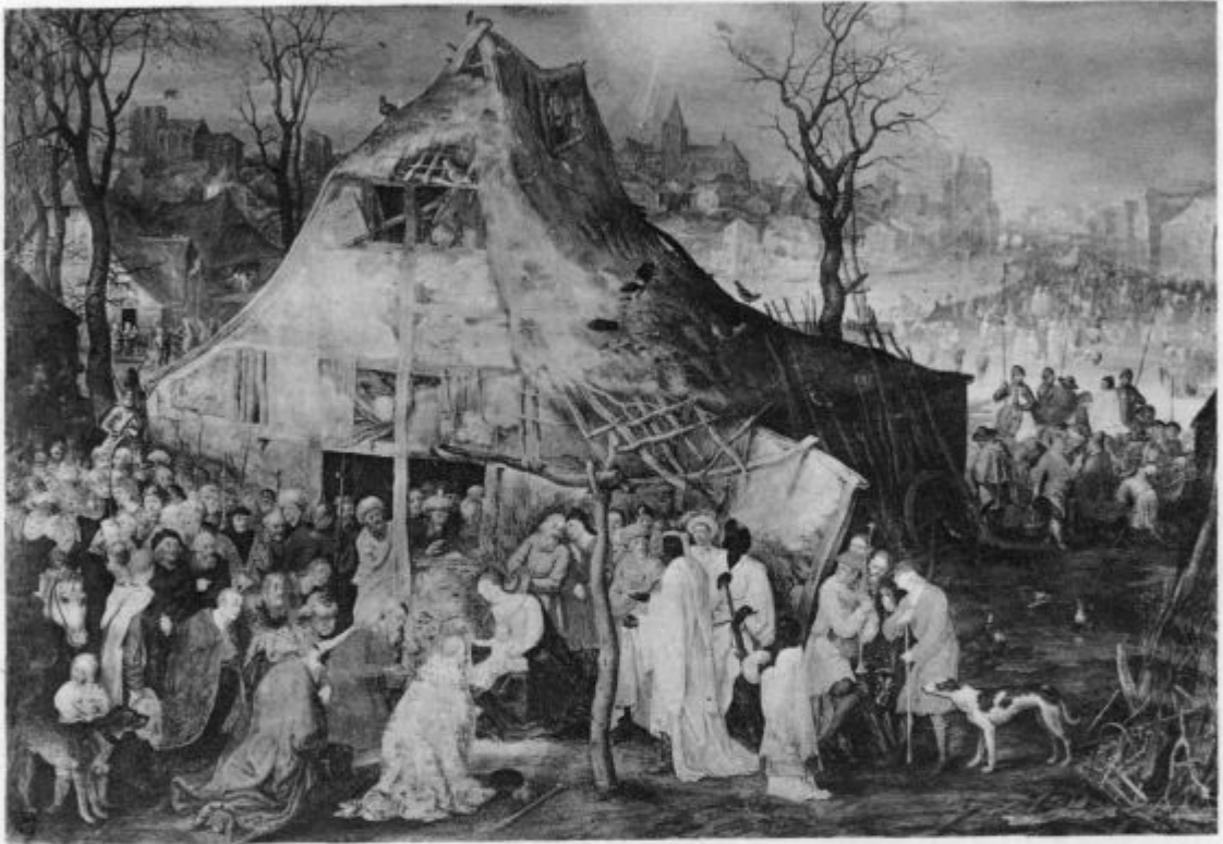
Modri z Vzhoda Jezusa molijo.