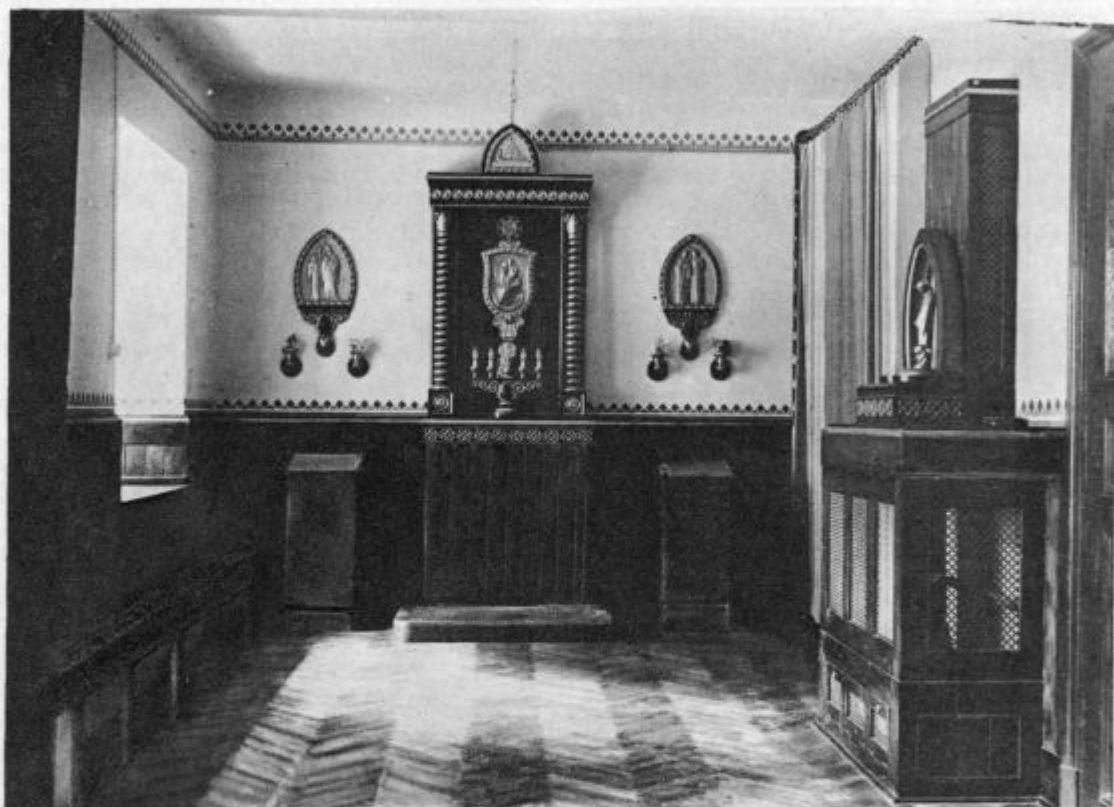
Kongregacijska kapela v Križankah v Ljubljani.

In soba naša? Molilnica nam je, zato so v prednjem delu klečalniki; predavalnica nam je, zato imamo možnost posta-