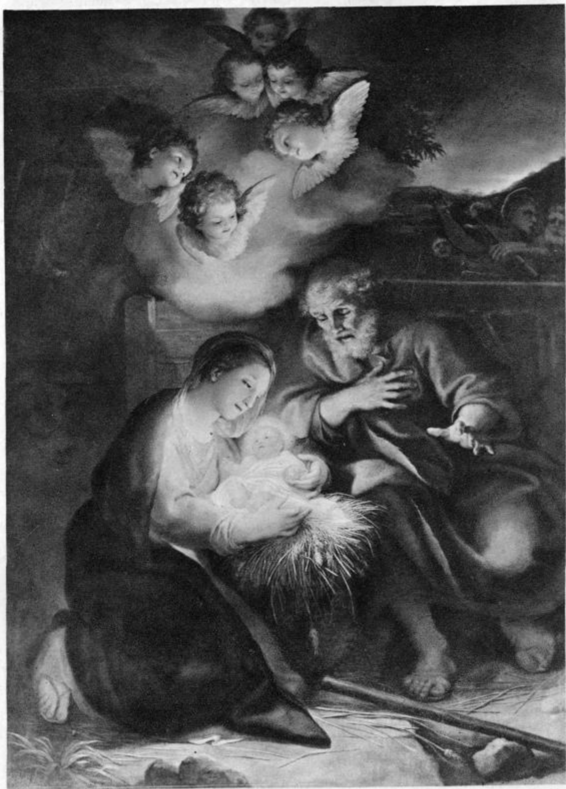
Mengs Ant. Raphael.