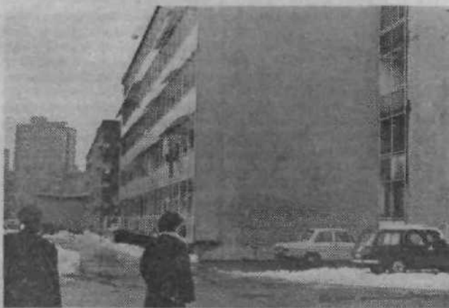
Nadzidave blokov so predvidene v Črtomirovi ulici 22, 23 do 25, 24 ter 27 do 29 in 31; v Neubergerjevi 16, 18 do 20 ter 22 do 24 in v Topniški 60 do 64.

Vsem Bežigrajčanom želimo srečno novo leto