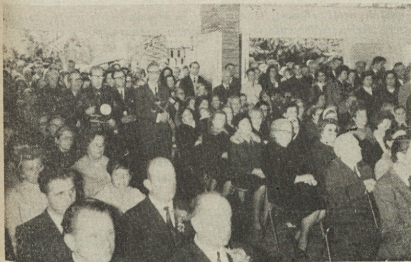
Med sv. mašo ob blagoslovitvi cerkve Marije Pomagaj (Pfeifer)

Vendar današnji kristjani na eni in drugi strani pač nosijo krivdo, da se razdori ne zmanjšujejo, ampak morda celo poglobljajo. Do tega more priti zaradi tega, ker se za edinstvo ne brigajo ali ker gojijo razloge razdora ali ker ponovno in ponovno