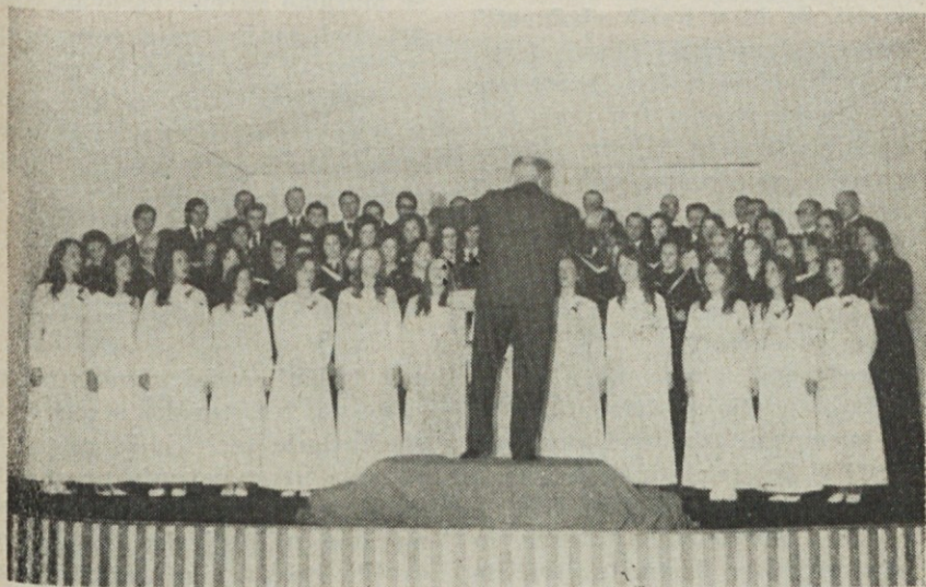
SPZ „Gallus“ in „Slovenske mladenke“ med izvajanjem „Vnebovzetja“

Poudariti moramo še eno: ne smemo misliti, da je ekumenizem samo zadeva nekaterih navdušenih posameznikov in zanesenjakov ali samo zadeva cerkvenega vodstva, ampak je naloga in dolžnost vseh članov Cerkve, kajti