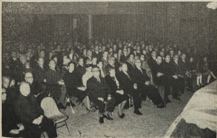
Publika v dvorani Slovenske hiše med izvajanjem „Vnebovzjetja“

Posebno iskreno želimo, da se vsi člani naše Cerkve, predvsem tisti, ki žive pomešani z drugimi krščanskimi brati, nauče čimbolj spoštovati in iskreno ceniti posebnosti liturgije, bogoslužnih in drugih obredov ter pobožnih običajev nekatoliških bratov v duhu pravega ekumenizma, kakor nas uči zadnji vesoljni cerkveni zbor. Veselimo se, da je bilo tako že doslej v mnogih naših krajih in da so se v tem odlikovali naši duhovniki in verniki. Vendar želimo, da se to spoštovanje odvija