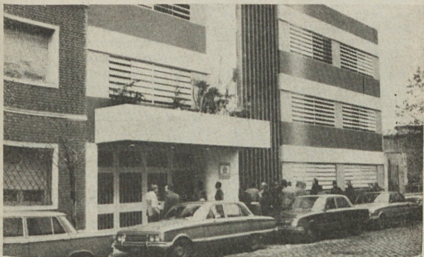
Pročelje Slovenske hiše v Buenos Airesu

Žal pa moramo danes, ko je preteklo deset let, odkar je koncil izdal odlok o ekumenizmu, ugotoviti, da je tisto prvo navdušenje za pospeševanje dela za cerkveno edinost v svetu precej popustilo, ponekod pa celo zamrlo. Tudi pri nas se v zadnjih osmih letih ni veliko storilo. Pohvalimo tiste, ki so organizirali molitve za sveto edinstvo ali v tisku skušali osvetliti različna vprašanja in širiti spoznanje drugih krščanskih Cerkva. Z veseljem ugotavljamo, da je včasih prišlo do srečanja predstavnikov