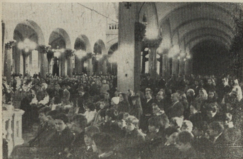
Med sv. mašo pred telovsko procesijo

ja prihodnje in onstransko življenje v Bogu, novi kristjani polagajo ves poudarek na ta svet in trdijo, da se mora božje kraljestvo polno dovršiti že tu na zemlji, v naši zgodovini. Odrešenje, ki ga je Kristus prinesel ljudem s svojo smrtjo in vstajenjem, se ne vrši v nekem bolj ali manj skrivnostnem onem svetu, temveč že tu na zemlji. To odrešenje se enači z osvobojenjem ljudi od zla, ki jih teži in jih odtuja in tako preprečuje, da bi postali popolnoma svobodni ljudje: nevednost, lakota, podrazvoj, politično zatiranje in gospodarsko izžemanje. Zato zlo, od katerega je treba osvoboditi človeka, ni prvenstveno osebni greh, temveč socialni greh, z drugo besedo: tista vsota