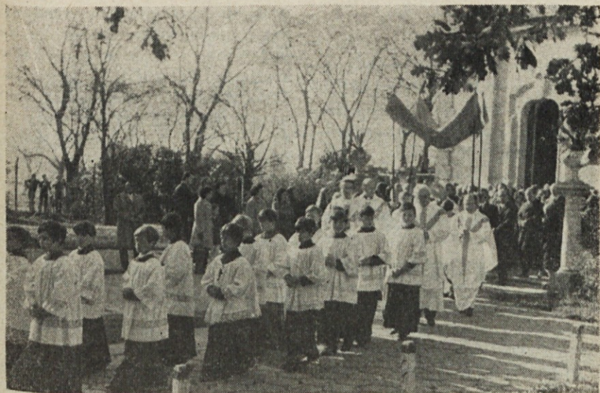
Procesija s sv. Rešnjim telesom

zato se lahko opravlja evharistija tudi brez služabnika. Duhovništvo je pravica vse skupnosti in zato se lahko opravlja evharistija tudi brez služabnika. d) Vesoljna Cerkev je bratsko združenje krajevnih Cerkev, ki so sestavljene iz majhnih osnovnih skupnosti, ki se družijo okoli besede božje in ki so zvesti evangeliju ubogih. e) Katoliška Cerkev, kakršna obstoji danes, s svojo ločitvijo v gospodovalce in gospodovane (hierarhija in božje ljudstvo), s svojimi strukturami gospodovanja in sile, s svojim paktiranjem s političnimi silami kapitalističnega zatiralca, katerega pokriva z religioznim plaščem in od katerega dobiva velike koristi, je radikalno nezvesta evangeliju in