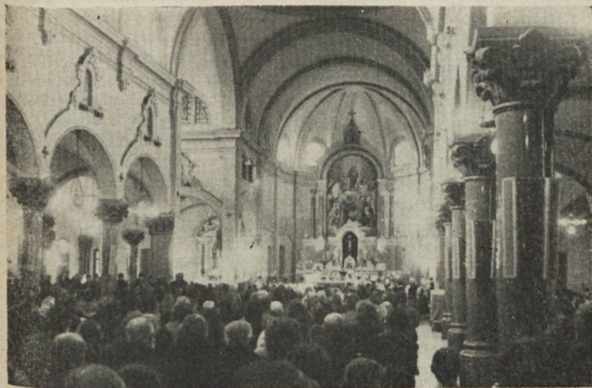
V cerkvi Marije Pomočnice v Ramos Mejiji je bila 16. junija sv. maša in nato po vrtu procesija sv. Rešnjega telesa

Zdi se nam, da ta razdeljenost v Cerkvi ni predvsem na področju dejavnosti. Ne gre namreč pri