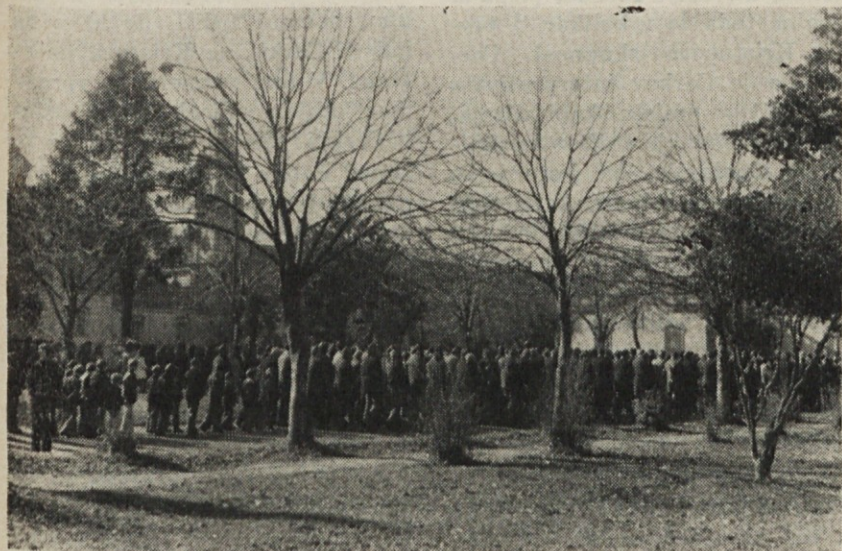
Telovska procesija po vrtu Don Boscovega zavoda

če se ne spremeni človekovo srce. Zato se ne more nadomestiti prvenstvo eshatološkega božjega kraljestva in večnega življenja s prvenstvom sveta in zgodovine, duhovnega prvenstva s časnim prvenstvom. Odrešenje se ne more reducirati na osvobojenje od lakote, podrazvoja in političnega ter ekonomskega zatiranja. Greh se ne more reducirati na socialno zlo, z drugo besedo na kapitalizem. V tem primeru bi dobili zmaličeno krščanstvo, reducirano na politično revolucionarno akcijo, ki se ne bi v ničemer razlikovala od marksizma, razen v tem, da bi ga navdihoval ne Marx, ampak Kristus. Kristusovo veselo oznanilo bi postalo predvsem poslaničca človekovega zemskega osvobo-