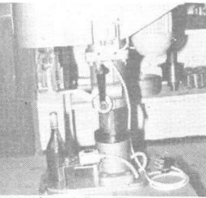
Polavtomatska zapiralna s Plutalovo zapiralno glavo je sad razvoja tega kolektiva. Namenjena je manjšim polnilnicam, zasebnikom, laboratorijem in drugim, ki uporabljajo pri zapiranju navojne zaporkne.