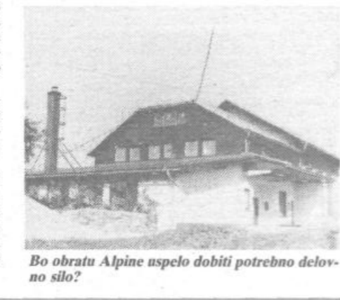
Bo obratu Alpine uspelo dobiti potrebno delovno silo?