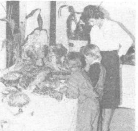
Domaci kmecki priborjki. A le za oci