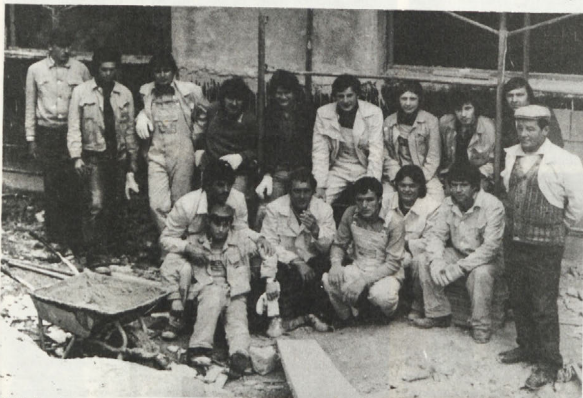
Udeleženci prostovoljne delovne akcije pri gradnji novega samskega doma na Resi v Krškem, ki jo je organizirala OO ZSMS TOZD Gradbeni sektor Krško