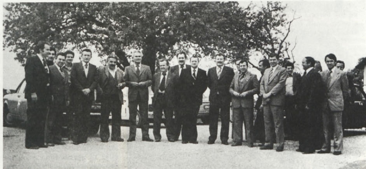
Predstavniki občine Velika Gorica pri Zagrebu in SGP PIONIR ob pričetku del pri gradnji velike poslovno stanovanjske soseske v Veliki Gorici