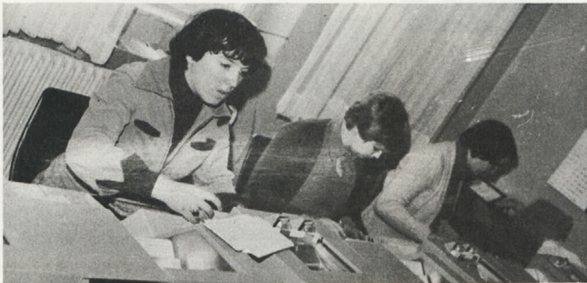
Luknjičarke rečejo z delovnim nazivom dekletom, ki spreminjajo na posebnih aparatih podatke v sistem luknjič na karticah, s temi karticami pa se nato hrani računalnik

Konferenca je imela v preteklem mandatnem obdobju več sej, ves čas je tesno sodelovala pri njihovem delu, tesno pa smo sodelovali tudi z organizacijo ZK IN ZSMS.