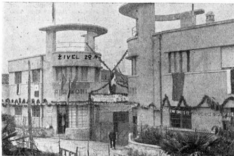
Obrat Argo ob prvem praznovanju Dneva republike

Kakor se s ponosom oziram v preteklost, tako lahko tudi z gotovostjo gledamo v bodočnost. Pot, ki smo nanjo dokončno stopili pred 17 leti, še ni končana. Hočemo, da bi bila končana! Hočemo, da uspehom preteklosti sledijo tudi uspehi sedanosti in bodočnosti. Boj za nadaljnji napredek je v polnem razmahu. Če smo včeraj ustvarjali mnogo in dobro, hočemo jutri še več in še bolje. In naše dosedanje izkušnje, predvsem pa naš široki sistem demokratizma in splošne samouprave nam zagotavljajo uspehe tudi v prihodnje. Danes razumemo bolj kot kdajkoli, da so naši uspehi in bodočnosti odvisni predvsem od nas samih, od naših sposobnosti, da izkušnje iz preteklosti nenehno izpopolnjujemo in jih vedno in povsod s pridom uporabljamo. Ustvarili smo si trdno gospodarsko osnovo, z njo znamo upravljati, zato tudi imamo temelje, da našo proizvodnjo nenehno dvigujemo z večanjem storilnosti, z vključevanjem dosežkov sodobne znanosti, s stalnim organizacijskim izboljševanjem. V pogojih osvobojenega dela, ko naš proizvajalec ni le del proizvodnega stroja, ampak njegov resnični gospodar, je naša največja moč. Zato tudi danes govorimo o ustavi, ki bo te pogoje jasno proklamirala, zato tudi danes lahko spreminjamo pred 17 leti proglašeno ime naše domovine in tudi uradno potrjujemo njen socialistični značaj. Zato si ob dnevu naše republike čestitamo za uspehe in za trdno voljo, ki jo imamo, da bi čim več dosegli tudi v prihodnosti.