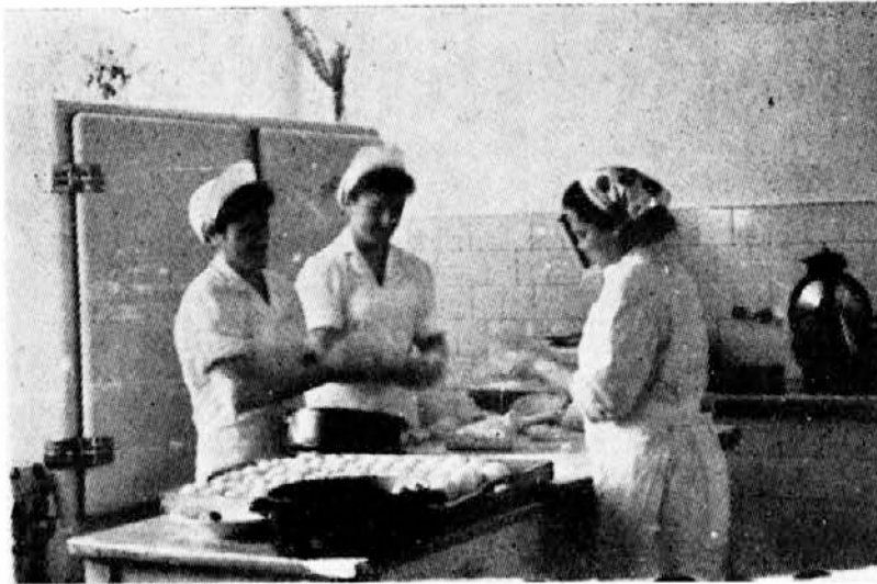
Danes bodo za malico cmoki